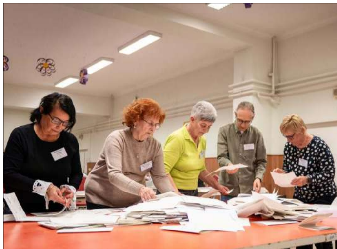
Szavazatszámolás a Békéscsabai Kazinczy Ferenc Általános Iskolában, a 29-es szavazóköri körben