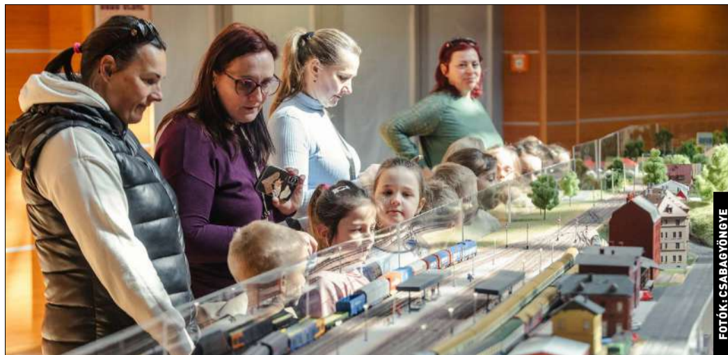
A vasútmodell kiállítás három napon át kalauzolt a mini sínpárok lenyűgöző világába