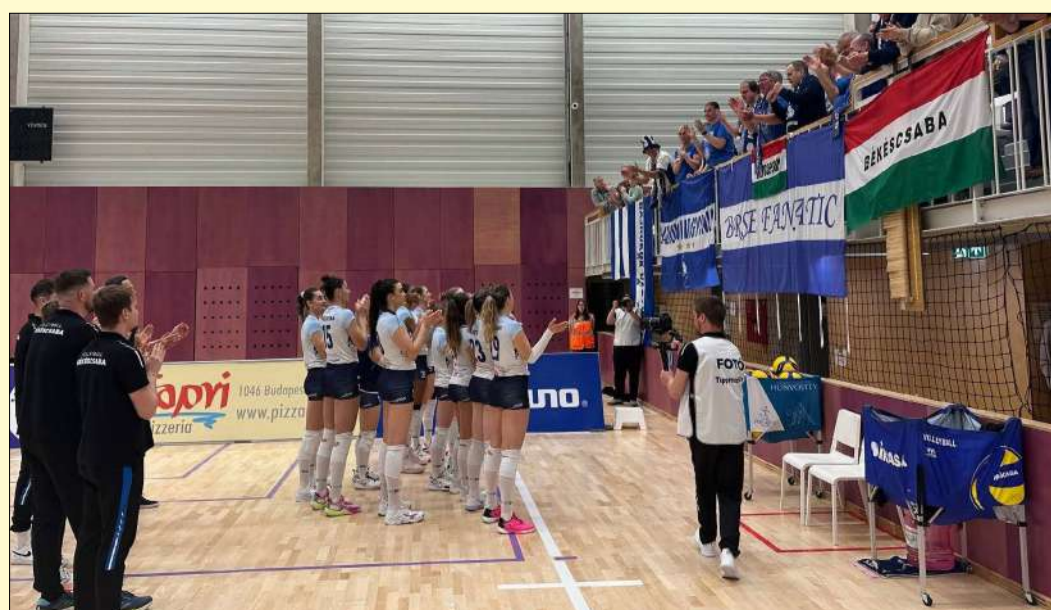
Bár idegenben volt a mérkőzés, a lányokat most is népes szurkológárda kísérte el

be, 3:0-ra győzött és ugyanilyen arányban nyerte meg a bronzcsatát.