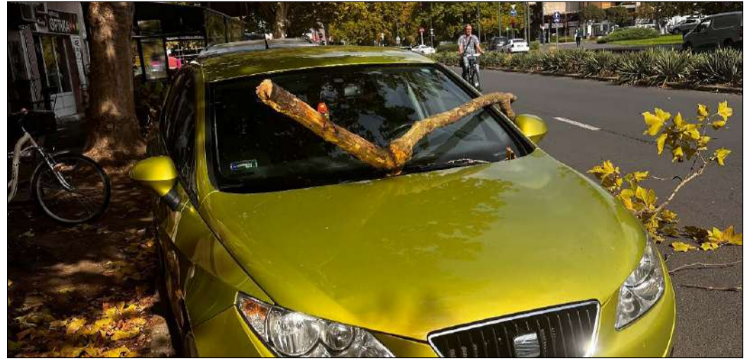
Az Andrassy úton több letört ág okozott károkat az ott parkoló autókban

Személyi sérülést és sok kárt okoznak az előregedett fák