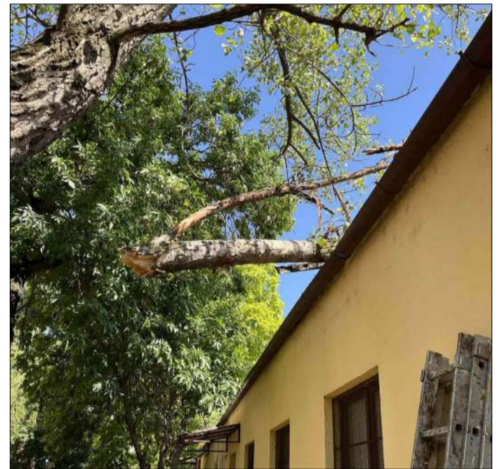
Az Unicon épületének a tetejére zuhant hatalmas faág is komoly károkat okozott