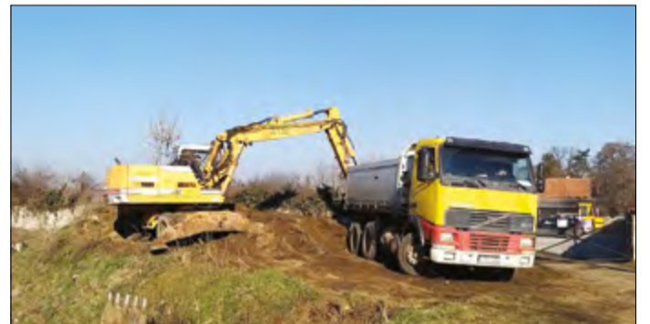
14 helyről összesen 800 köbméter hulladékot szállítanak el

A városvezető tájékoztott arról, hogy 24 darab kutyaürülék-gyűjtő edény található Békéscsaba közterületein, ezeket heti két alkalommal ürítik. Az edényeknél zacskó is van, amellyel a kutyaürüléket össze tudja szedni a gazdi. Amennyiben ezt mégsem teszi és tettenérés történik, akkor a helyszíni bírság összege ötezer forinttól ötvenezer forintig terjedhet. Lakossági bejelentésre egyébként a kutyaürülék-gyűjtő edények száma bővíthető.