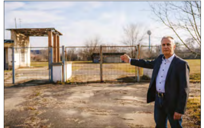
Ezen a területen épül fel a 970 négyzetméteres csarnok

– A Magyar Államkincstár Békés Vármegyei Igazgatóságának – idén február 20-án érkezett – értesítése szerint támogatásra érdemesnek minősítették a város pályázatát. Ennek