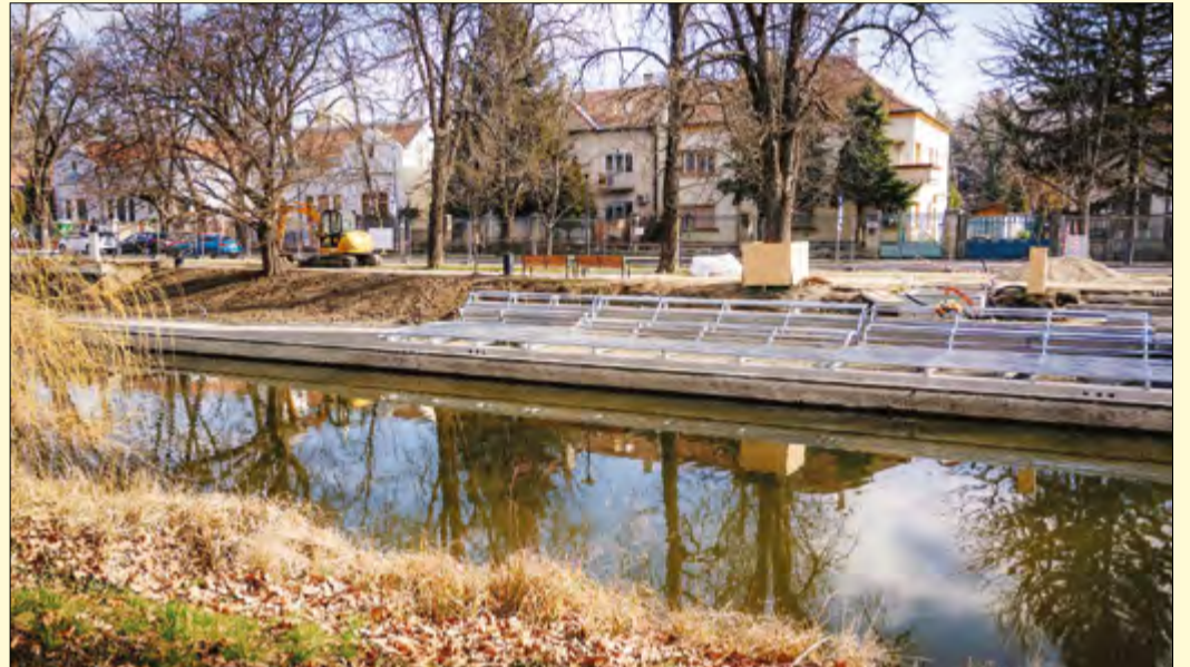
Március végére készülhet el az Árpád sori sétány és pihenő az Élővíz-csatorna partján