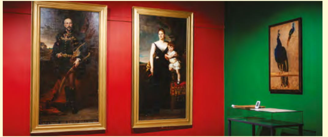
A Benczúr, a fenséges című kiállítás augusztus 10-éig látogatható a múzeumban

A Munkácsy Mihály Múzeum a következő kiállításán Munkácsy kortársát, Benczúr Gyulát, a XIX. század utolsó harmadában külföldről hazatérő, Magyarországon karriert befutó festőművészek egyik legtehetségebbjét mutatják be az intézmény Jankay Termében.