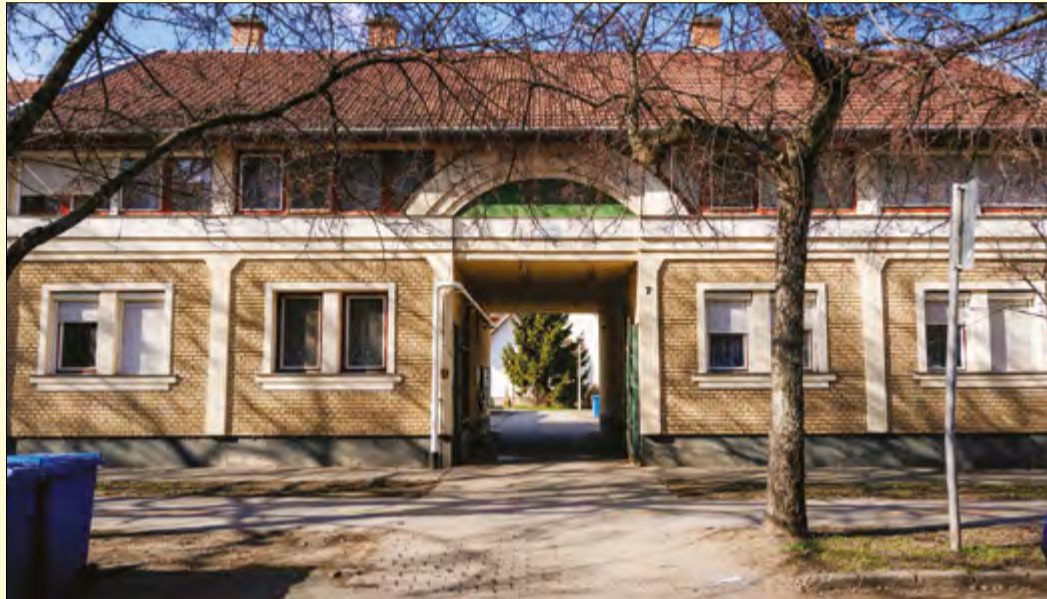
A Dózsa György út 7. szám alatt 28 lakóegység áll a fiatal párok rendelkezésére