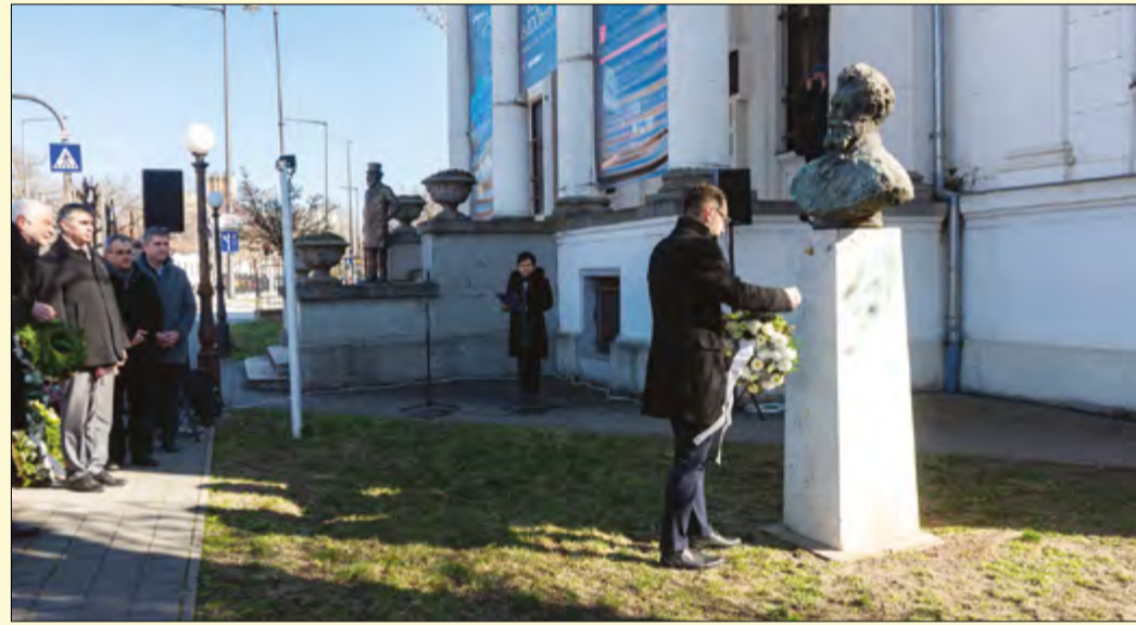
Megemlékezés és koszorúzás a múzeum kertjében található szobornál