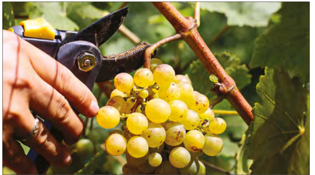
Múlt évben nagyon népszerű volt a szőlőültetvény és gyümölcsös Szedd magad! akciója

2500 szőlővessző talált gazdára az ültetvényen