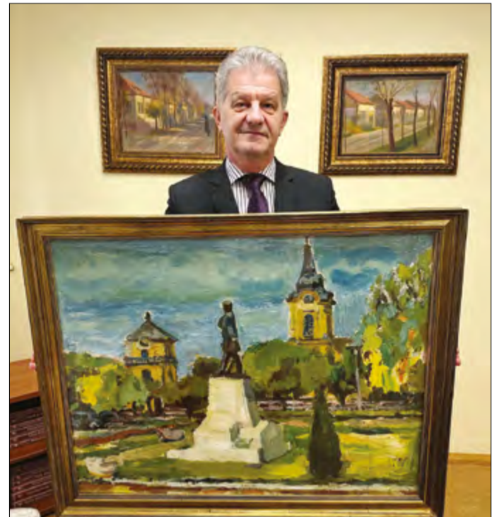
Schéner Mihály festményével gazdagodott a városháza

– Mindig nagy tisztelettel csodáltam Schéner Mihály Kossuth-díjas művésznak az alkotásait különleges