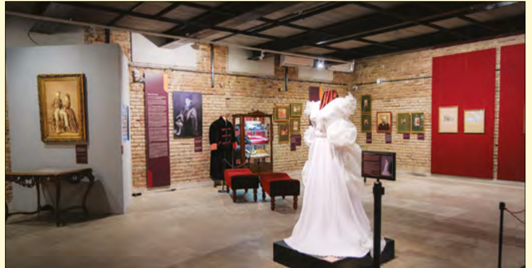
A tárlat különlegessége egy Munkácsy Mihály ihlette menyasszonyi ruha

Olyan komoly tudásbázis van birtokunkban a páratlan relikviagyűjteményen túl Békéscsabán, a Munkácsy