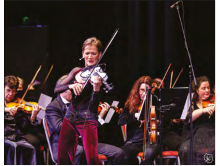
Illényi Katica és a Békés megyei Szimfonikus Zenekar fellépése a Csabagyöngye Kulturális Központban

Az idei fesztivált is igen színesre tervezték, szem előtt tartva, hogy a laza, könnyedebb és a hagyományörző télbúcsúztató események is minőségi programok legyenek. A könnyűzene különböző ágaiktól a komolyzenei koncerteken, stand up és színházi előadásokon át a kiállításig és a maskarás felvonulásig, kiszabáb-égetésig, táncjázig