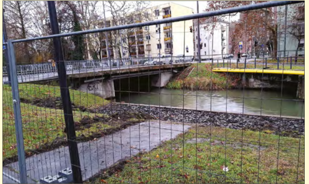
Az Árpád soron a munkaterületet már átadták a békéscsabai kivitelezőnek

Egy nettó 68 millió forint értékű beruházásnak köszönhetően bővül ismét Békéscsaba turisztikai attrakcióinak köre. A Modern Városok Program révén, a Wenckheim turista- és kerékpárút kialakítása projekt részeként egy újabb sétány és pihenő épül az Árpád soron, ahol a munkaterületet már átadták a kivitelezőnek. A részletekről Ádám Pál infrastrukturális fejlesztése-