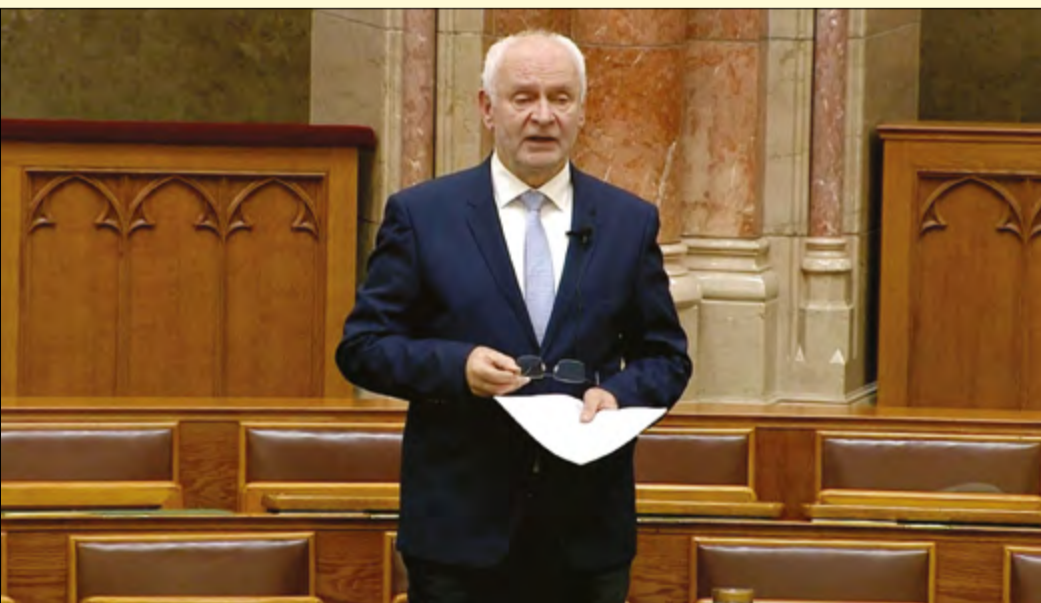
Herczeg Tamás: Sokan nem tudják, de egy kiemelt terület, a környezetvédelem szempontjából jobban állunk, mint az előző esztendőknél.

Herczeg Tamás országgyűlési képviselővel együtt a 2024-es esztendőre tekintettünk vissza. Egyebek mellett a gazdasági helyzet alakulásáról, illetve Békéscsaba lehetséges jövőjéről kérdeztük.