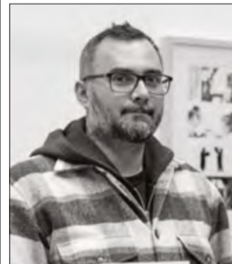
Futaki Attila 1984–2024

A mindössze 39 éves korában, 2024. január 2-án elhunyt, kivételes tehetségű, nemzetközileg is elismert képregény-rajzoló, a Békéscsabai születésű Futaki Attilára emlékeznek a Békés Megyei Könyvtárban egy időszaki kiállítással.