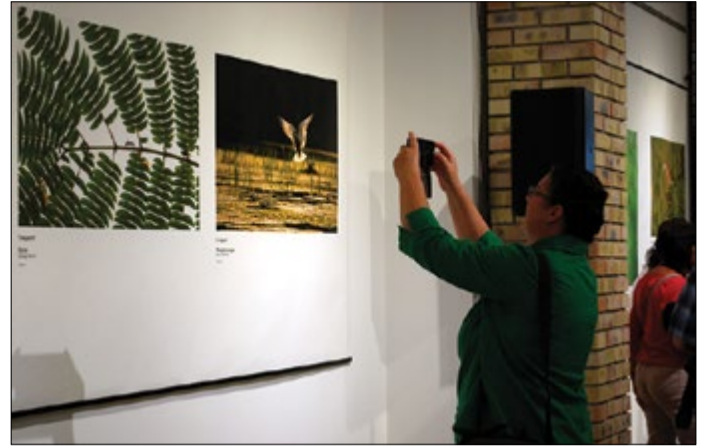
Idén is felnőtt és ifjúsági kategóriában várják a fotókat