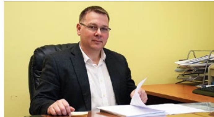
Paláncz György, Békéscsaba alpolgármestere

A nyári szünet kezdetéig jutnak el a hordozható számítógépek az ötödik, a hatodik és a kilencedik évfolyamos diákokhoz. A kormányzati program részleteit Paláncz György, Békéscsaba társadalmi megbízatású alpolgármestere, a Békéscsabai Szakképzési Centrum, Széchenyi István Két Tanítási Nyelvű Közgazdasági Technikum és Kollégium igazgatója mutatja be.