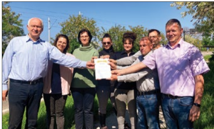
Az idei első Közösség díjat a Menőmegyer Egyesület kapta

– Békéscsabai, Békés vármegyei polgárként, szociológia szakon szociálpolitikai végzettséggel figyelemmel követem, hogy milyen mutatóink vannak, és próbálom összehasonlítani más országok adataival, valamint azzal,