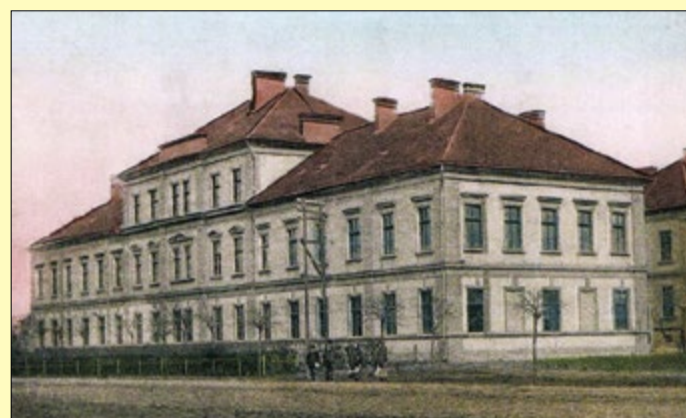
A kaszárnyát 1894. április 29-én szentelték fel

A 101. Császári és Királyi Gyalogezred 1883-ban alakult, melybe Békés megye és Békéscsaba hadköteleseinek 60 százaléka kapott behívó