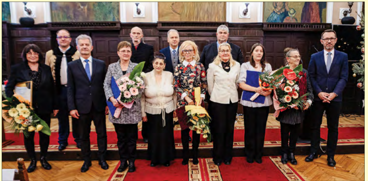
A városi és a nemzetiségi vezetők az ünnepségen a kitüntetettekkel a városháza dísztermében

A nemzetiségek napja alkalmából tartott ünnepséget a békéscsabai, valamint a hat nemzetiségi önkormányzat december 10-én a városháza dísztermében. A gálaműsor részeként a korábbi évek hagyományainak megfelelően az egyes nemzetiségi önkormányzatok által alapított kitüntetéseket is átadták.