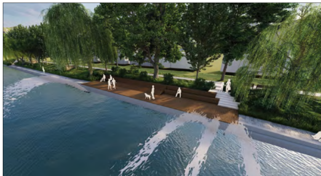
A Bánszki utcai híd és a Réthy Pál híd közötti új sétány látványterve

– A kormány 100 százalékos támogatásával Jaminában,