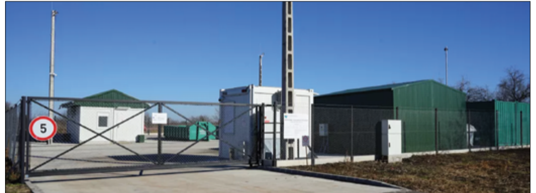
A hulladékudvar év közben is igénybe vehető a lakcímkártya felmutatásával