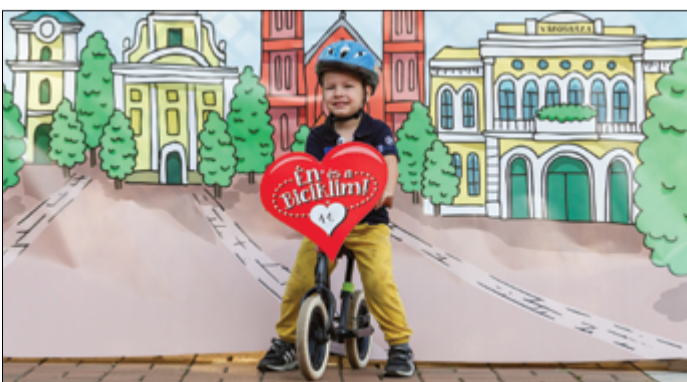
A nyertes fotó Botonddal és a futóbiciklivel