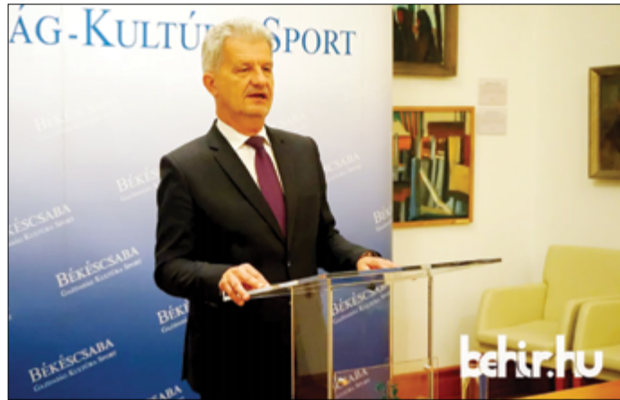
Szarvas Péter: Változatlanul azzal a városvezetői kvalitással dolgozom, mint eddig

– Azt kívánom minden kedves csabainak, hogy ez az ötéves ciklus teljen jó egészséggel, alapvetően pozitív életérzésekkel. Azért dolgozom, hogy 2029-re, a ciklus végére Békéscsaba – a jelenlegi értékeket megtartva – még fejlettebb állapotban legyen, mint amilyenben most van. Hiszem, hogy közös erővel, közös munkával olyan tartós eredményeket érhetünk el, amelyek városunk fejlődését és közösségünk javát szolgálják – tette hozzá a polgármester.