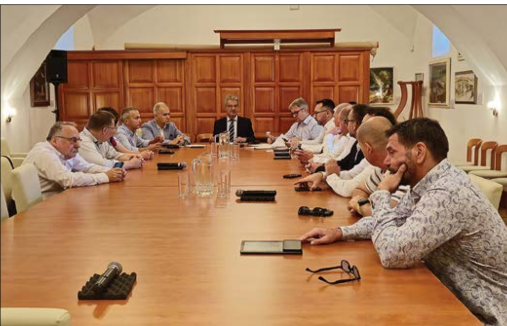
A sorok kívüli közgyűlést a városháza Mokos termében tartották

Sorok kívüli közgyűlés volt a városházán július 26-án. Két cég fejlesztene a városban, ezért hívták össze a képviselőket.