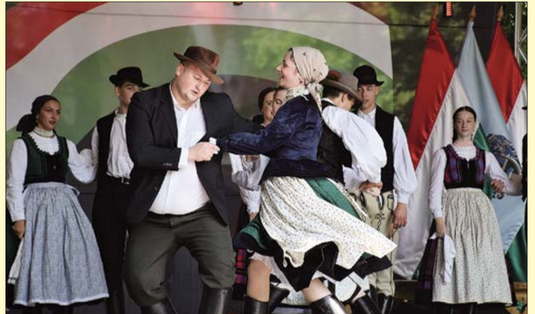
A Csaba Nemzetiségi Néptáncgyűttest idén is láthatjuk majd augusztus 20-án

– Az előző évek megmutatták, hogy az ebéd és a