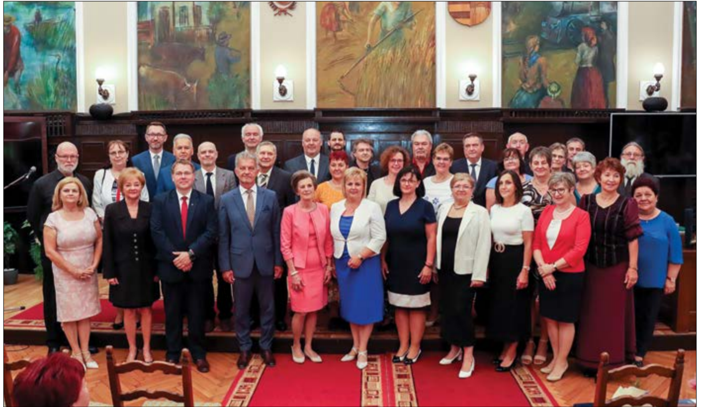
Az elismerésben részesült pedagógusok a városháza dísztermében, a városvezetőkkel

A gyermekek iránti szeretete, a munkába vetett hite, a társak tisztelete mindig mutatja a helyes utat a kollégái számára. Egyénisége, rátermettsége, jó felkészültsége kiváló pedagógust formált belőle. Oktatóként és vezetőként is mindig fontosnak tartotta tudásának folyamatos fejlesztését és erre ösztönözte munkatársait is. Tanítványai megalapozott tudással kerülnek ki a kezei alól. Kiemelkedő tehetséggondozó munkája bizonyítékként tanítványai az elmúlt évtizedekben számtalan országos