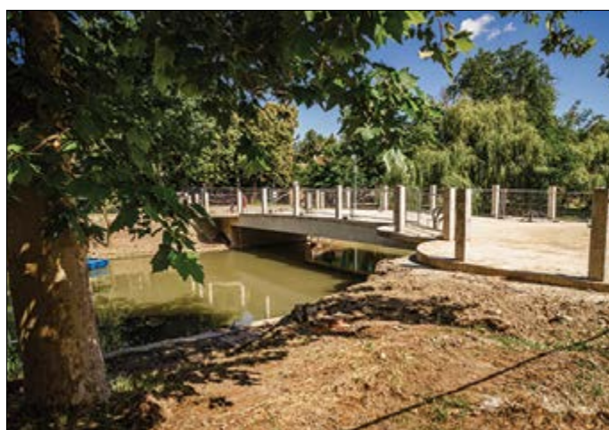
A híd egyes elemeinek elkészítése folyamatban van

A hídepítéssel kapcsolatos kérdések, bejelentések, észrevételek e-mailben a bcsvarosfejlesztas@bcsvarosfejlesztas.hu címre, illetve postai úton a Békéscsabai Városfejlesztési Nonprofit Kft., 5600 Békéscsaba, Szent István tér 10. sz. 1. emelet 4. sz. iroda címre küldhetők. (Levélnél tett bejelentés esetén szíveskedjenek megjelölni az értesítési címet.)