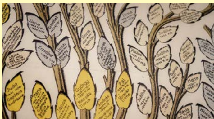
Az Áchim család részlete középen Andrással