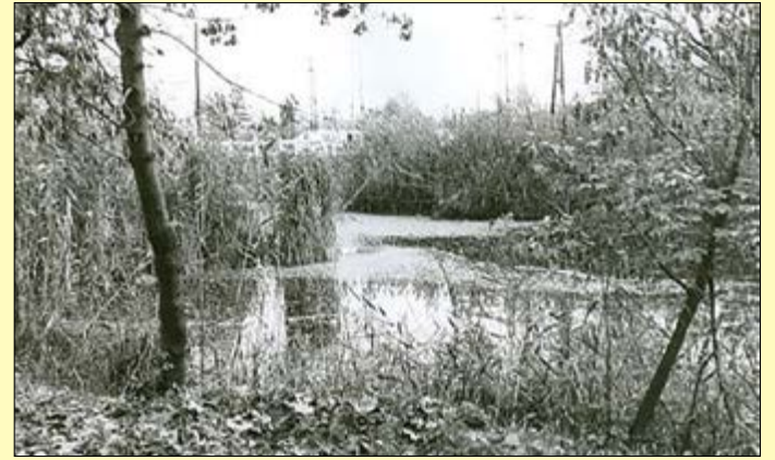
Az egykori meleg vizű népfürdő helye 2000-ben

Noha akkor még a víz tetején korom és olajfolt is úszkált, az idősebb korú lakosság úgy találta, a meleg víznek reuma elleni gyógyhatása van. A helyi lap, a Békésme gyei Közlöny is felfigyelt a naponta százak által látogatott népfürdőre, és hosszú írásban tudósított a helyszínről: „szinte pazar látványosságot nyújt, ha a kora esti órákban elsetálunk a villanytelep csatornához. Megszámlálhatatlan öreg anyóka meg apóka két marokkal keni izmaira a