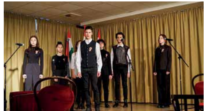
A Csabai Színistúdiósok műsora zárta a napot