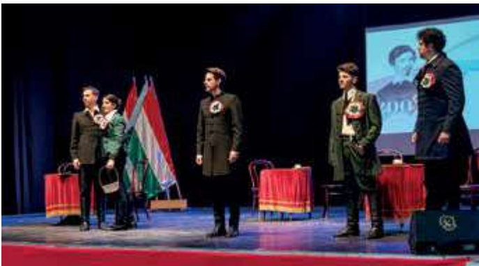
Vésd fel ezt a nagy napot – a színház előadása