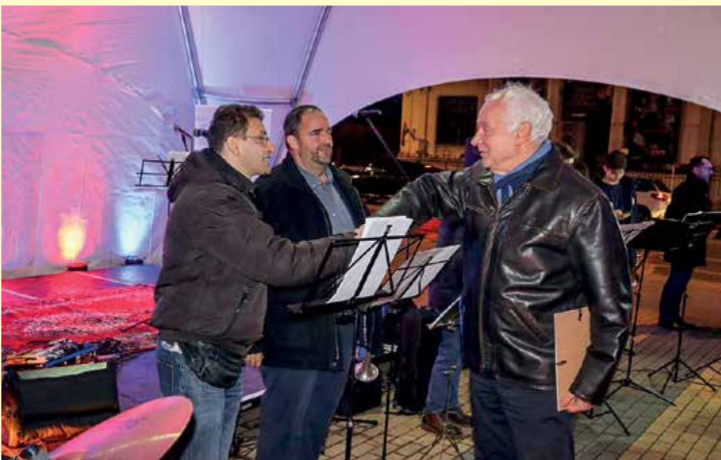
Tíz évvel ezelőtt adták át a Csabagyöngyét, januárban csak az épület előtt jubilálhattak, de április 3-án pótolják az elmaradt ünnepséget

Új gyorsforgalmi összeköttetés létesülhet Magyarország és Románia között, lassan kinyitnak az energiatárolási okokból átmenetileg bezárt kulturális intézmények, ülésezett a Nemzeti Összetartozás bizottsága – Herczeg Tamás országgyűlési képviselővel beszélgettünk.