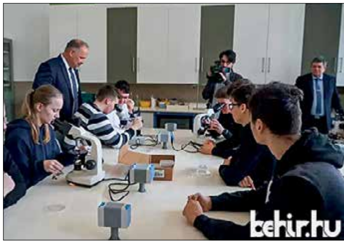
A közelmúltban átadott szaktanterem a MOL 5 millió forintos támogatásával jöhetett létre

A Békéscsabai Szakképzési Centrum 2021-ben írta alá a MOL Nyrt.-vel az együttműködési megállapodását. A MOL azóta a fluidumkitermelők legnagyobb duális partnere, így a diákok már ipari környezetben tölthetik el szakmai gyakorlatukat. A cég 5 millió forinttal támogatta azt a törekvést,