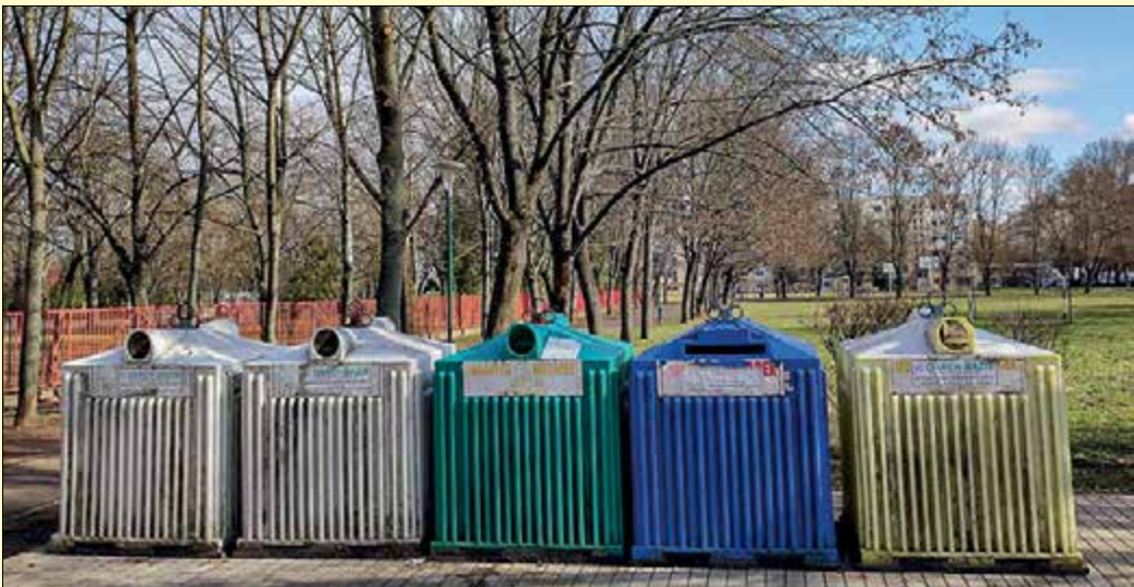
A városban több mint 20 szelektív hulladékgyűjtő sziget található

Sokan igyekeznek Békéscsabán tudatosan odafigyelni a környezetükre, részben azzal, hogy próbálnak kevesebb hulladékot „termelni”, részben pedig úgy, hogy a hulladékot szelektíven gyűjtik. Az önkormányzat fejlesztéseinek is köszönhetően a városban évről évre bővülnek a lehetőségek a szelektív hulladékgyűjtésre.