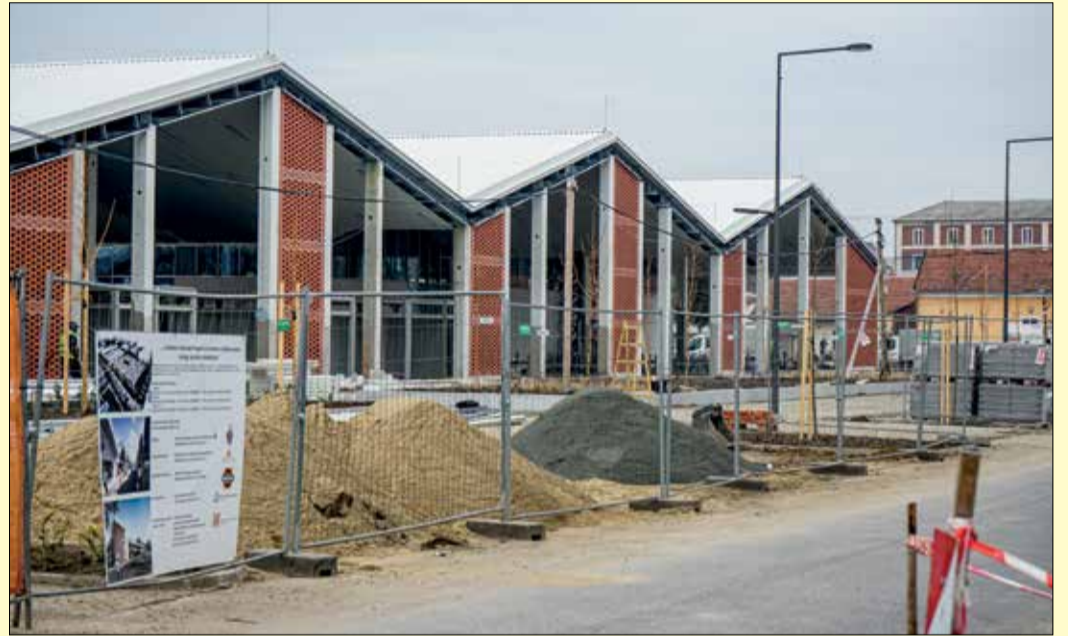
Több mint hatezer négyzetméteres, fedett-nyitott csarnok építése is a fejlesztés része

A végéhez közeledik a térségi piac építése Békéscsabán. A beruházás a tervezés és kivitelezés során több alkalommal is szerepelt a közgyűlés városüzemeltetési bizottságának napirendjén, ezért a fejlesztés részleteiről Ádám Pált, a bizottság elnökét kérdeztük.