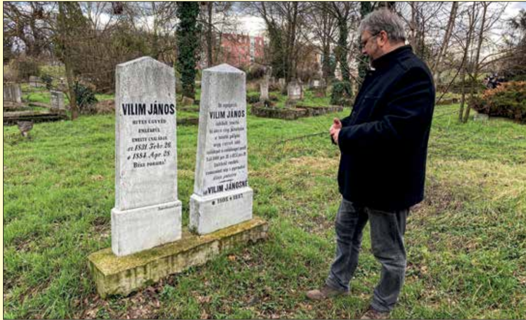
A Békéscsabai Városvédő és Városszépítő Egyesület több sírt is felújított

Békéscsaba képviselő-testülete még múlt év végén döntött arról, hogy az önkormányzat 2023-ban is támogatást biztosít az egyházi temetők gondozására, azokra a sírkertekre is, ahol ma már nem temetnek, viszont az állapotuk régóta beszédtema a városban.