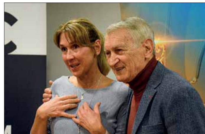
Békéscsabán járt Nagy Tímea és Dunai Antal

Mindent a siker érdekében! címmel rendezte meg február 7-én soron következő programját a Mathias Corvinus Collegium csabai képviselője. Ezúttal a Halhatatlan Magyar Sportolók Egyesülete (HMSE) két ikonja érkezett: Dunai Antal olimpiai bajnok labdarúgó és Nagy Tímea kétszeres olimpiai bajnok párbajtőrívó.