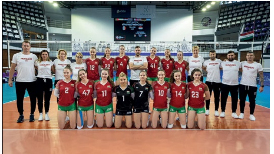
A magyar válogatott au U17-es női röplabda Európa-bajnokság csoportkörében

– Azok, akik ezen az U17-es Eb-n pályára lépnek, pár éven belül a felnőtt válogatottak környékén lehetnek, akár Törökországban, akár Németországban, akár Belgiumban a legjobbak között szerepelhetnek. Bízunk abban, hogy a mérkőzésekre kilátogató gyerekeket is motiválja, hogy ilyen magasságokba is el lehet jutni – fogalmazott Ludvig Zsolt.