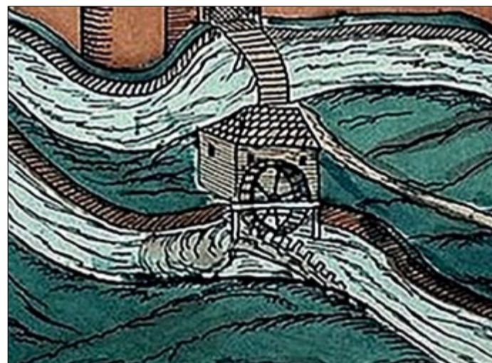
Vízimalom a 17. század elején Temesvár mellett. Részlet Ludwig Förster nyomtatványából, Watyay Ferenc műve alapján

Feltűnő, hogy a forrás Haraszi Gergely gerlai házáat említi. Haraszi még 1508-