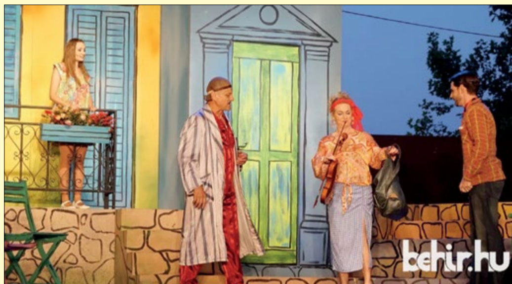
Anconai szerelmesek a Jókai színház előadásában a Szent István téren