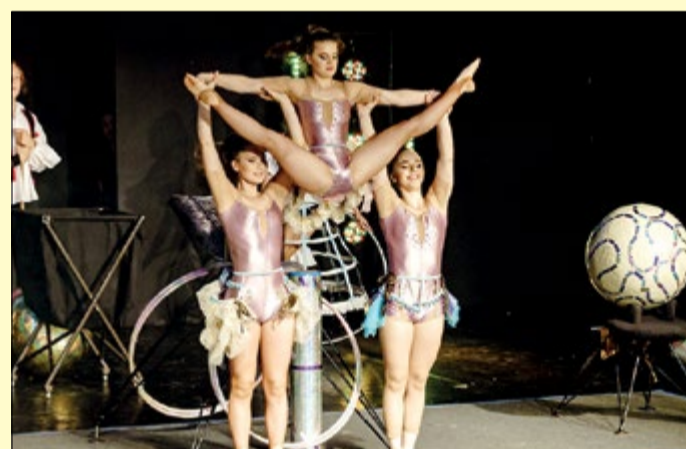
A Világok vándora – Petőfi 200 cirkuszi produkció

A Csabai Nyár részletes programjait lapunk 12–13. oldalán tekinthetik meg.