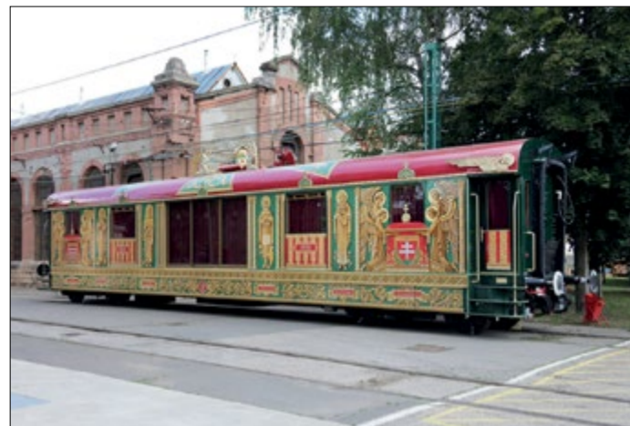
A 2020-ban újraépített Aranyvonat

A magyar tervező- és díszítőművészet remekének számító középső vagon a MÁV dunakeszi műhelyében