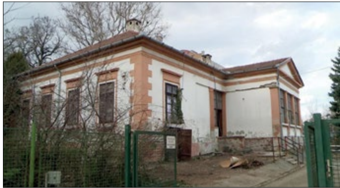
Az Urszinyi-Beliczey-kúria bő két évvel ezelőtt