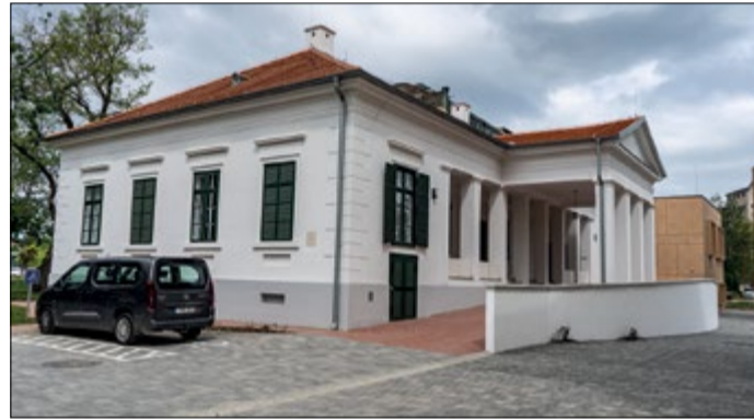
Ilyen lett a műemlék épület a felújítás után