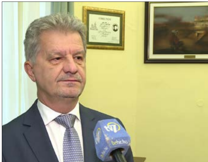
„A Magyar Posta Zrt. vezetőivel a rugalmas szolgáltatásokról kívánunk egyeztetni”

A polgármester elmondta, hogy 2022 október végén 319 millió forintot kapott támogatásként az önkormányzat, amely összeg az iparüzési adó elvonását kompenzálja. A testület úgy döntött, hogy ebből 100 millió forintot városüzemeltetésre, 82 millió forintot a közösségi autóbusz-közlekedés szolgáltatásra, 20-20 millió forintot az Árpád fürdő és a sportlétesítmények fenntartására, 7 millió forintot az Ormay sor szilárd burkolattal történő ellátására, 2,5 millió forintot pedig a Csányi utcai extrém-sport-pálya továbbfejlesztésére fordít.