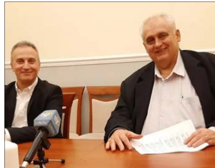
„A posta gyakorlatilag mindent a várossal fizetett meg, ezért más megoldáson gondolkodunk”