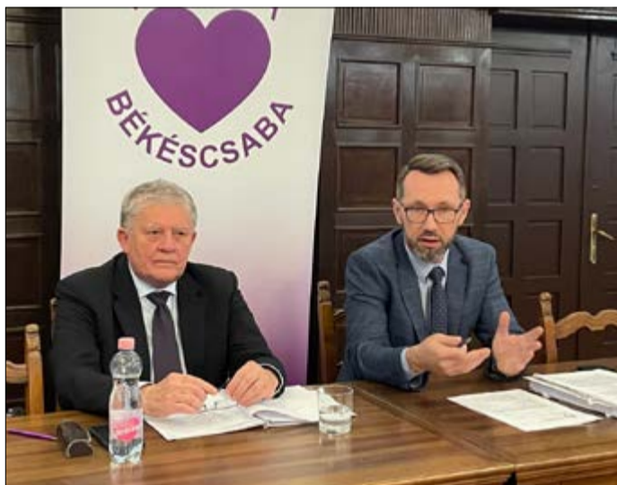
„Sok a bizonytalansági tényező a költségvetésben”