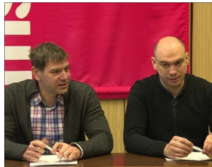
„Állami segítség nélkül a hiány kigazdálkodhatatlan”