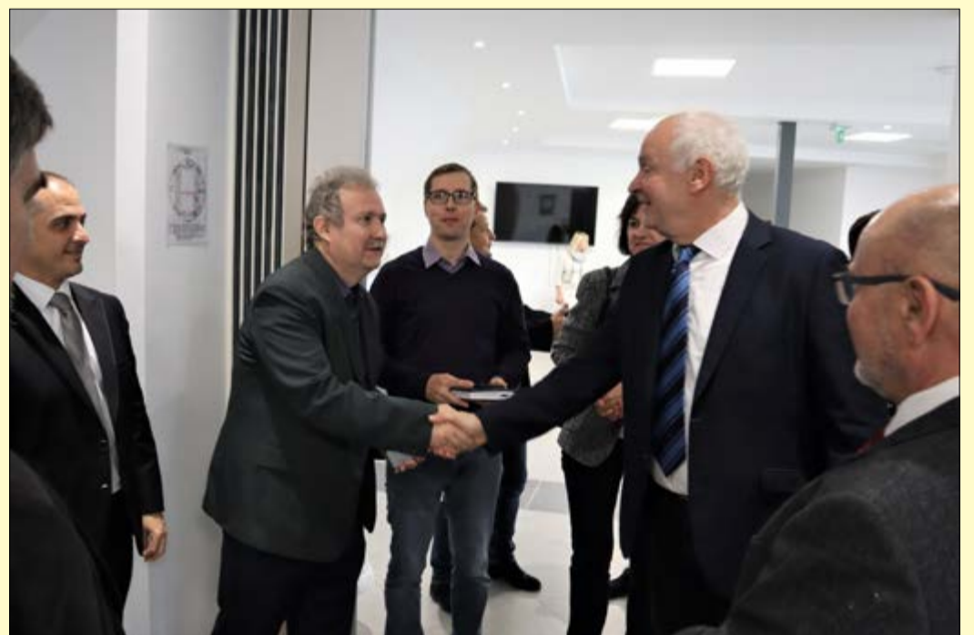
A Smart Grid program I. ütemének záróeseményén, a városi sportcsarnok VIP-termében