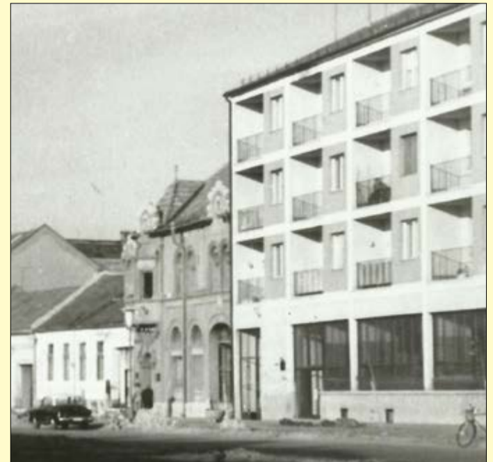
Az egykori Corvina könyvnyomda épülete a jobb oldali emeletes ház területére esett