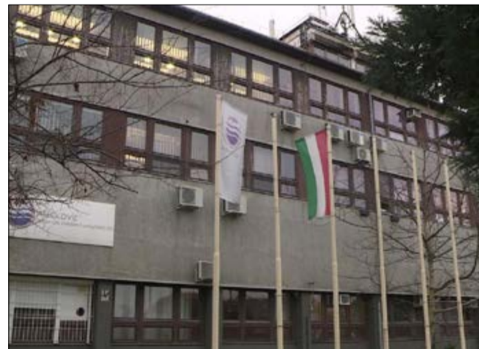
Az Alföldvíz 450 ezer ember számára szolgáltat ivóvizet

soron állami feladat. Tehát ha az önkormányzati tulajdonú víziközmű cégek nem tudják ezt biztonságosan ellátni, akkor az államnak kell ezt a kötelezettséget teljesítenie. Az Alföldvíz Zrt. az elmúlt időszakban meglehetősen kritikus éveket élt át. Számos konzultáció, egyeztetés eredménye volt, hogy megtörtént a cég integrációja a Nemzeti Vízművek Zrt.-be. Az Alföldvíz az ország negyedik legnagyobb víziközmű szolgáltató cége, és körülbelül 450 ezer ember számára szolgáltat egészséges ivóvizet, 4 megye 132 településén. A cégnél elindult egy bérfelzárkóztatási folyamat, ugyanis e tekintetben jelentős volt az elmaradás a mintegy 1200 főt foglalkoztató szolgáltatónál. Békéscsabán még vannak olyan területek, ahol nincsen ivóvízvezeték-hálózat. Olyan szerződést kötött az önkormányzat a Nemzeti Vízművek Zrt.-vel, hogy a szolgáltató biztosít forrást ezekre a fejlesztésekre, és elvégzi ezt a munkát. A Kenderföldeken már elindult a folyamat: jövő év közepéig a Kenderföldek minden utcájában egészséges vezetékes ivóvízhez juthatnak az ott lakók. Az is fontos volt, hogy Békéscsabán maradjon a cég központja, valamint hogy továbbra is legyen tulaj-