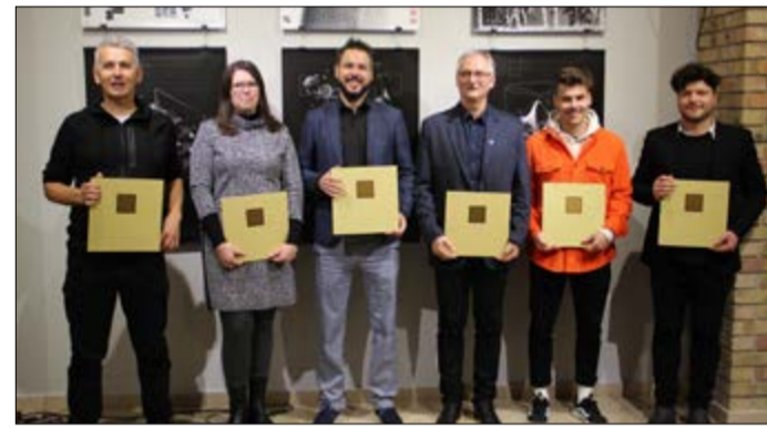
A XXIII. Tervezőgrafika Biennálé díjazottjai