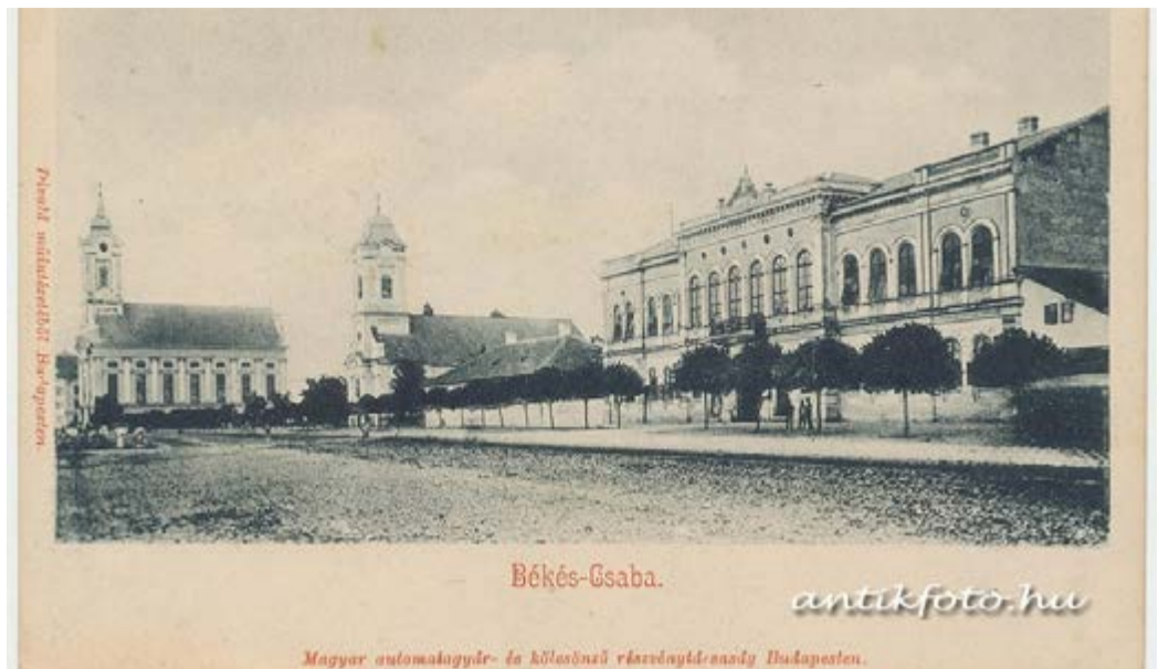
A Szent István tér a városháza épületével az 1900-as évek elején