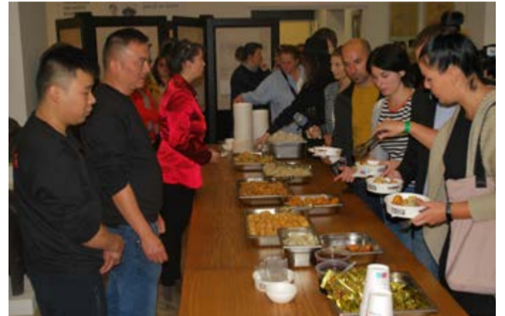
Ázsiai ételek kóstolója a Munkácsy Mihály Múzeumban