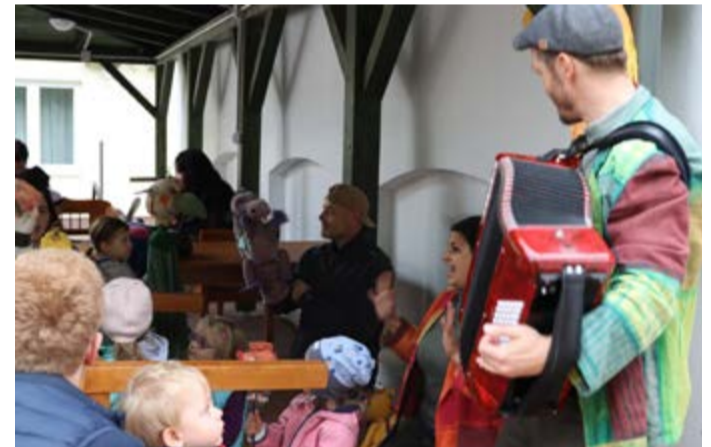
A bábszínház interaktív mesefoglalkozása gyerekeknek

A Lencsési Községi Ház tisztelettel meghívja Önt