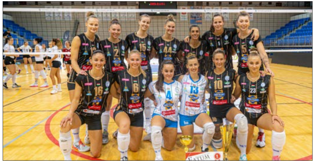
A BRSE ötszettes csatában hódította el a Fatum Kupát Nyíregyházán, a hazaiak ellen