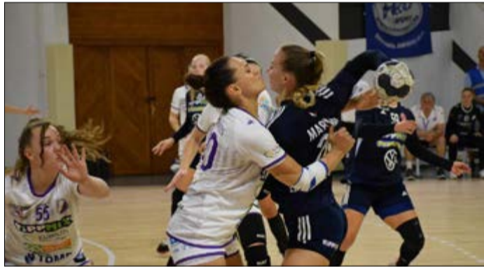
A kézisek keményen küzdöttek a mérkőzéseiken