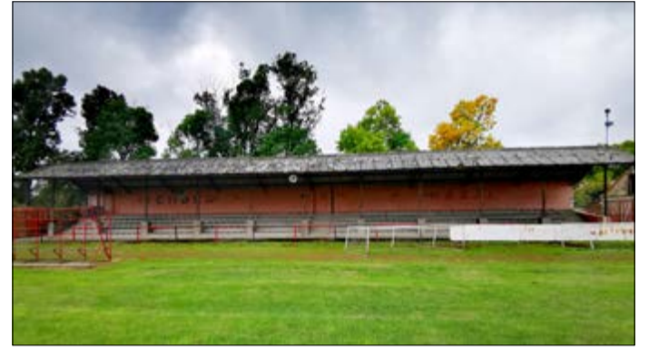
A Csányi utcai sporttelep tribünje

A CSAK a pályáját 1920-ban vehette birtokba. 1924