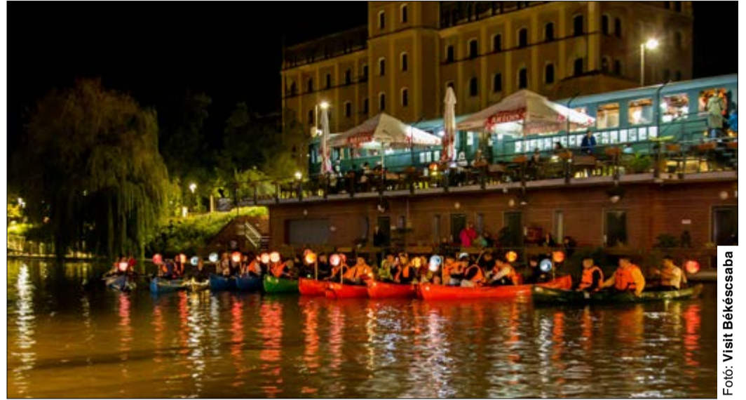
A vízi felvonulást a Békési Kajak-Kenu Club és a diákönkormányzat szervezte