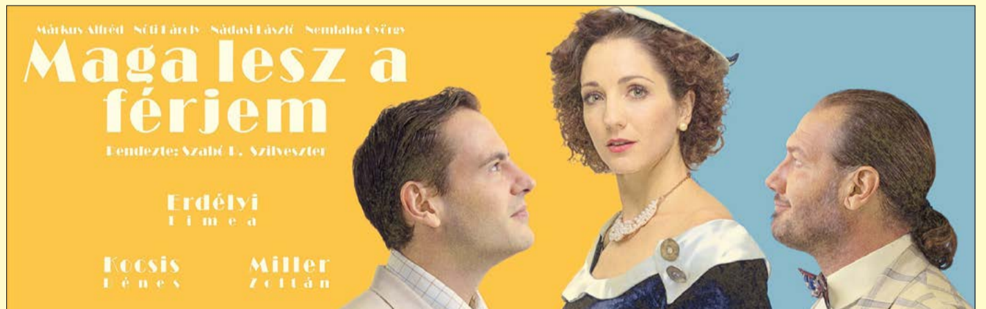
Június 24-én 20.30 órától, a Maga lesz a férjem című darabbal indul a Városházi Esték