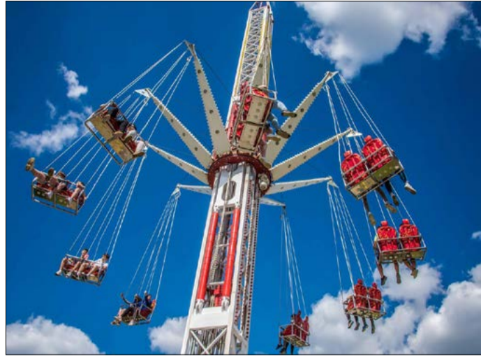
Egy 30 méter magas körhintát állítottak fel a parkolóban

Az évad során látható lesz többek között Szórényi Levente és Bródy János rockballadája, a Kőműves Kelemen; az Egy szoknya, egy nadrág Bodrogi Gyula rendezésében, a Szenté Vajk által színre vitt Funny Girl, valamint a Puskás, a musical is. Az évadon belül rendezik meg a X. Cervinus Művészeti Fesztivált is,