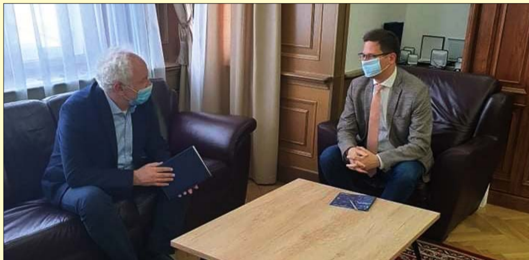
Herczeg Tamás országgyűlési képviselő és Gulyás Gergely miniszter

Az elmúlt hetekben több témában is döntött az Országgyűlés. Kiterjesztették a diákhitelt a szakképzésben és felnőttképzésben tanulóknak, segítik az egyszülős családokat, valamint kivonják a kereskedelmi forgalomból az egyszer használatos műanyagokat. Herczeg Tamás országgyűlési képviselővel ezek mellett arról is beszélgettünk, hogy folyamatosan javulnak a járványügyi adatok, és nyári táborok sora várja a gyerekeket.