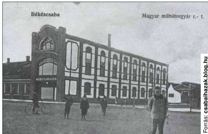
A régi épület eredetileg műbútorgyár volt

A Béköt épülete eredetileg műbútorgyár volt, melyet 1905-ben alapított Reisz Miksa és Porjesz Mihály. A különleges szecessziós homlokzatú bútorüzemet 27