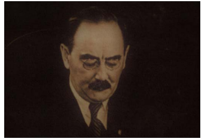
Nagy Imre

Nagy Imre 1955 elejéig élvezte a szovjet vezetés támogatását, akkor Moszkvába rendelték. Hruscsov éles bírálatban részesítette a reformokat radikalizmusáért, és ezek megváltoztatására szólította fel. A kialakult helyzetet Rákosi kihasználta, 1955 tavaszán sikeres ellentámadást indított Nagy Imre ellen, akit április