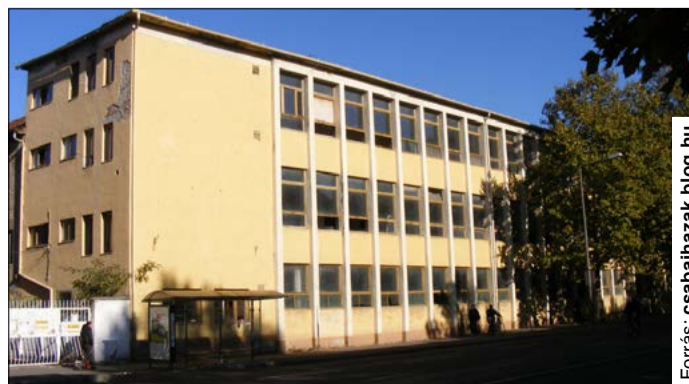
A kötöttárugyár épülete 2011-ben