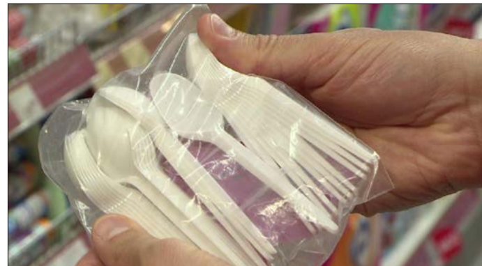
Júliustól a műanyag evőeszköz sem forgalmazható

– Két évvel ezelőtt kiadott egy állásfoglalást az Európa Tanács arról, hogy az egyszer használatos műanyagok használatát korlátozni kell. Hónapokkal ezelőtt a parlament asztalán volt már ez az ügy, de akkor elnapoltuk a döntést. Úgy gondolom, nem érthette váratlanul a kereskedelem, a vendéglátásban dolgozókat, hogy júliustól életbe lép ez a szabály. A korlátozás ráadásul nem azonnali hatályú, a meglévő készletet még felhasználhatják, viszont újakat már nem vásárolhatnak. Ki kell vonni a forgalomból például a hungarocell ételhordó edényeket, bizonyos vastagság fölötti zacskókat, a műanyag evőeszközöket, tányérokat vagy fültisztító pálcikákat. A döntés azt szolgálja, hogy minél kevesebb nem elbomló műanyag szemét keletkezzen. Papírból, fából, illetve a természetes, biológiai úton elbomló anyagokból készült zacskók, tárolóeszközök természetesen használhatóak lesznek ezután is. Ez némi