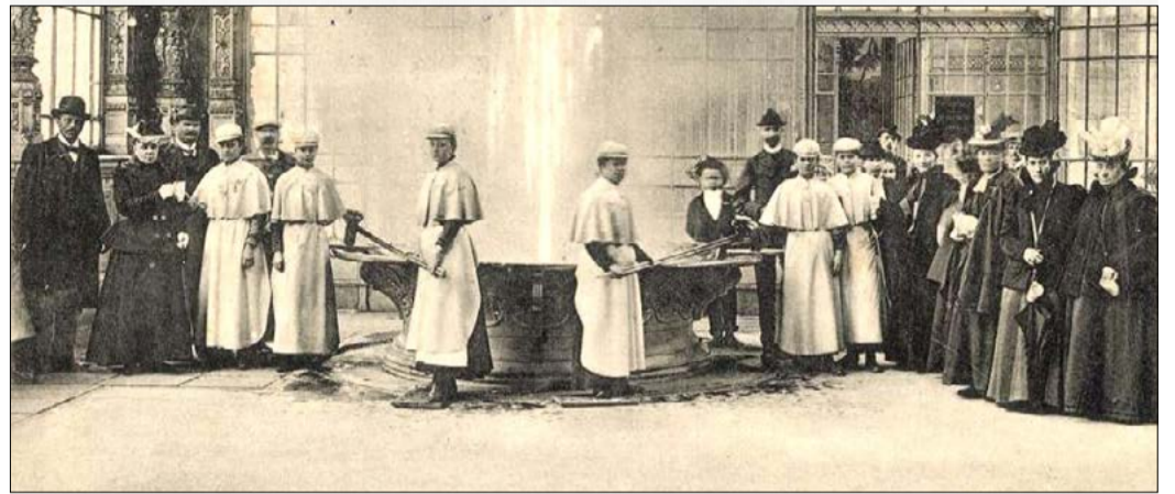
A „Sprudel” nevű gyógyforrás Karlsbadban, 1907-ben, és ahogy a korban egy gyógykezelés zajlott mellette