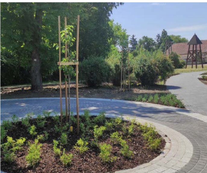
Megújul a gerlai Wenckheim Károly tér is

Békéscsaba Megyei Jogú Város Önkormányzata