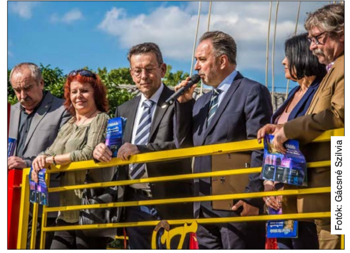
„Ki szeretnénk csalogatni az embereket az előadásokra”

amely július 14-e és 22-e között zajlik majd. A programsorozat a hagyományoknak megfelelően zenés díjátadó gálaműsorral zárul.