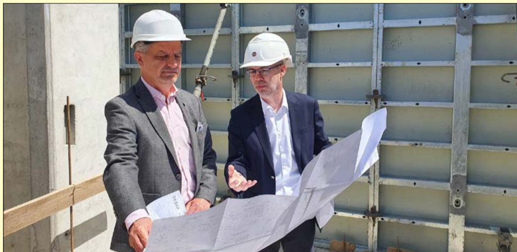
A terveknek megfelelően a parkolóház építésével indult a piacefejlesztés