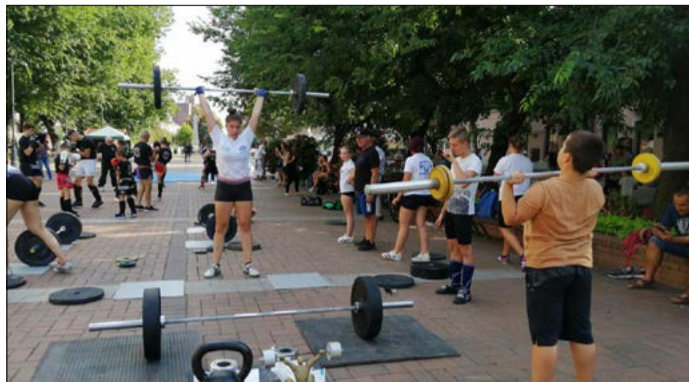
Augusztus végén, szeptember elején lehetnek sporthétfők

– Szerencsére a járvány enyhülése miatti jogszabályváltozások érintették a táboroztatást is. Ahogy már megszokhatták a csabai családok, a tankerületi központtal együtt idén is megszervezzük a nyári napközis tábort a Lencsési iskolában és a Madách utcai iskolában június 30-ától július 30-áig. Idén fokozott jelentősége van ennek a város által nyújtott szolgáltatásnak, amelynek költségeit az önkormányzat állja. A szülőknek csak az