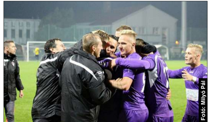
Ebben a szezonban is ilyen pillanatokat szeretnének