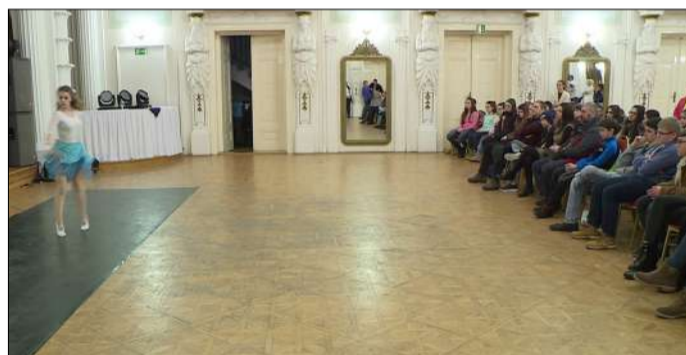
Artista- és táncosképzésre várják a diákokat