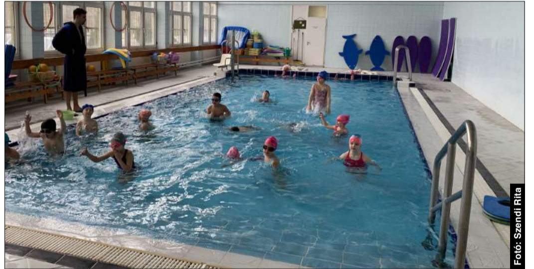
A program keretében a gyerekek tíz alkalommal vehetnek részt úszásoktatáson

A sportprogram része például a nagycsoportos óvodások vízhez szoktatása, ami azt jelenti, hogy 6 éves korig 10 alkalommal vehetnek részt a gyerekek úszás-oktatáson. A Békéscsabai Előre Úszó Klub oktatója, Papp Szilvia elmondta, hogy a tizedik alkalom végére már nagyon sokan elsajátítják a lábtempót, valamint a hátúszás alapjait is.