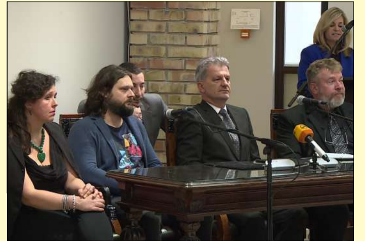
Kiemelték: ez lesz az évtized kiállítása a múzeumban

hogy a mezőlaborci múzeumot 1991-ben alapították, és ez volt az első intézmény a világon, amely Andy Warhol művészetét kívánta bemutatni (a művész szülei ugyanis arról a környékről származtak).