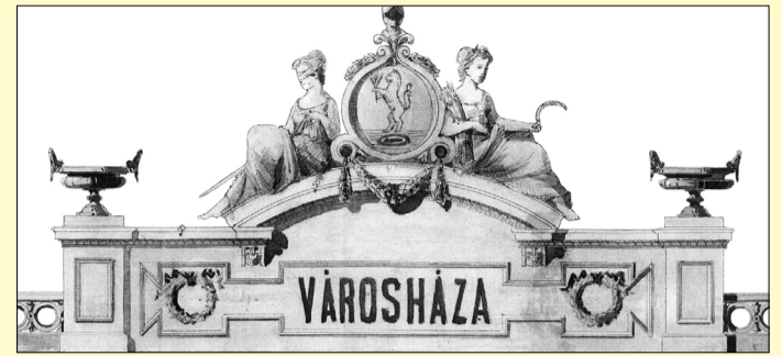
Themis és Ceras allegorikus szobrok a városháza felett (A tervek szerint az eredeti hasonmása visszakérül a helyére)