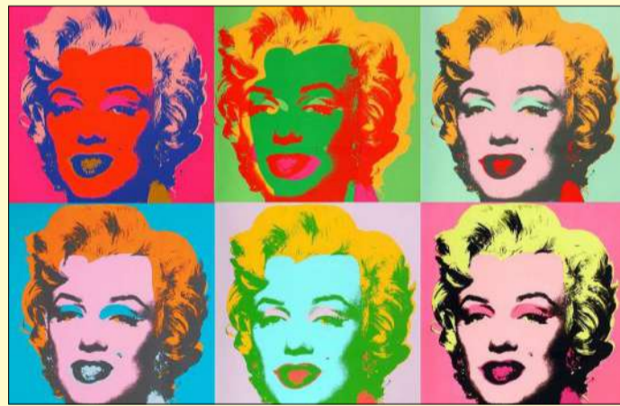
A múzeum elhozta a pop-art fejedelmének munkáit