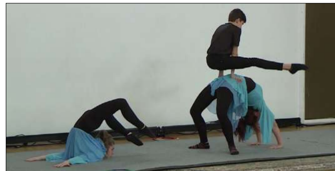
Az érdeklődők elképesztő bemutatót láthattak