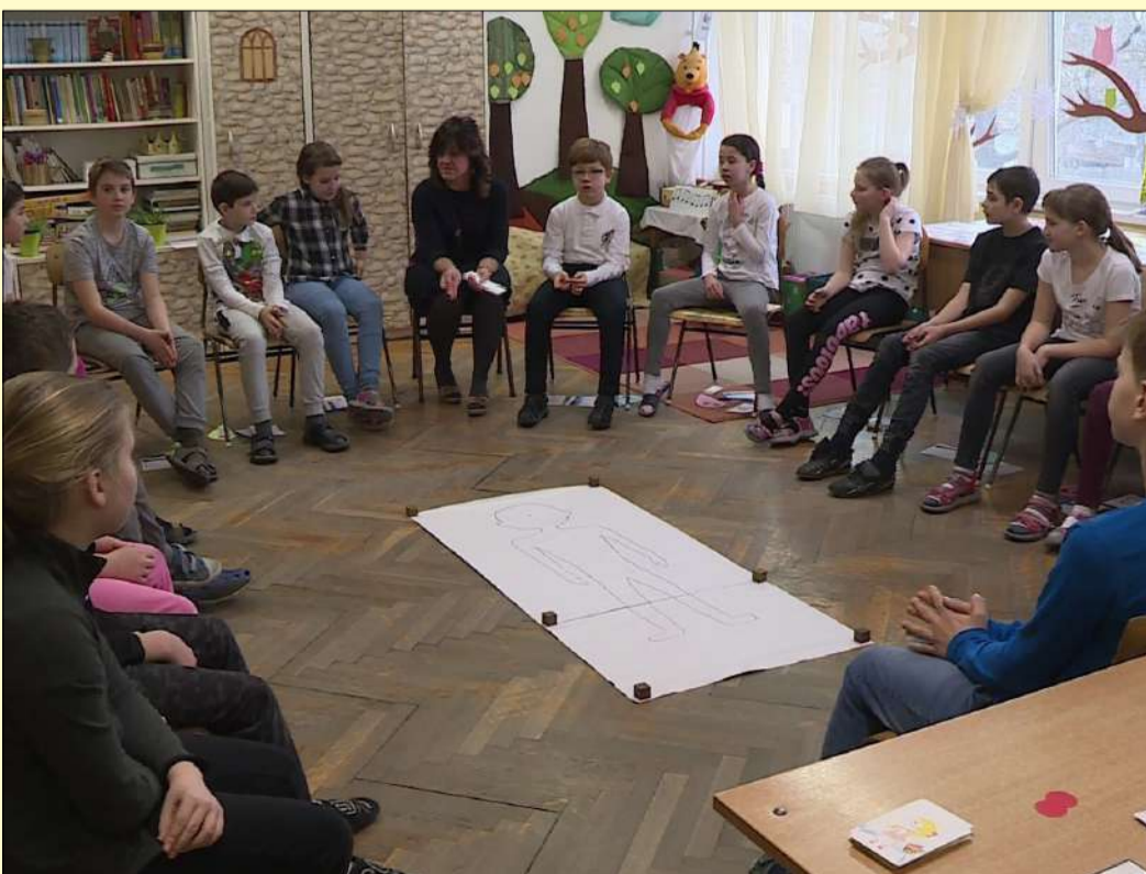
A boldogság képessége tanítható, az iskolában ezen dolgoznak

Boldogságórát tartanak az Erzsébethelyi Általános Iskolában Békéscsabán. A program célja, hogy a gyerekek olyan témákat dolgozzanak fel, amelyek segítenek a pozitívabb életségében és a problémák könnyebb megoldásában.