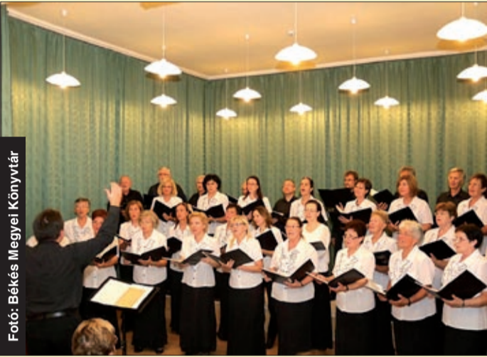
A Bartók Béla Vegyeskar fellépése a könyvtárban

Az Országos Könyvtári Napokhoz a Békés Megyei Könyvtárral együtt harmincegy intézmény csatlakozott a megyében. Az október 2-a és 8-a között zajlott programsorozattal a könyvtárhasználatot és az olvasást igyekeztek népszerűsíteni.