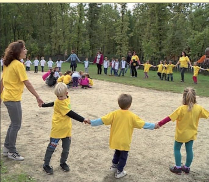
Szinte teljesen megtelt óvodásokkal a CsabaPark

Minden az alma körül forgott a CsabaParkban azon a rendezvényen, amelyet a város nagycsoportos óvodásainak rendeztek a közelmúltban. A szervezők játékos programokon keresztül hívták fel a gyerekek figyelmét az egészséges életmódra és a gyümölcsfogyasztás fontosságára.