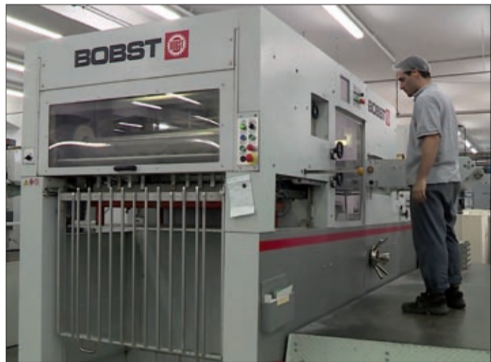
A munkáltatók igényeihez kell igazítani a szakképzést

alatok menedzsmentjével tárgyalva kiderült, hogy egyre nagyobb mértékben hiányzik a szakképzett munkaerő Békéscsabáról. Ezért a város érdeke is, hogy a munkáltatók igényeihez igazodjon a szakképzés. A szövegbe nem csak a munkahelyteremtés, hanem a lakhatás támogatásának fontossága is bekerült, illetve a nagy vállalkozások segítése, a karrierkövetési, valamint a vállalkozási információs rendszer kialakítása és működtetése. De a dokumentumban megjelenik a sportturizmus fogalma is.