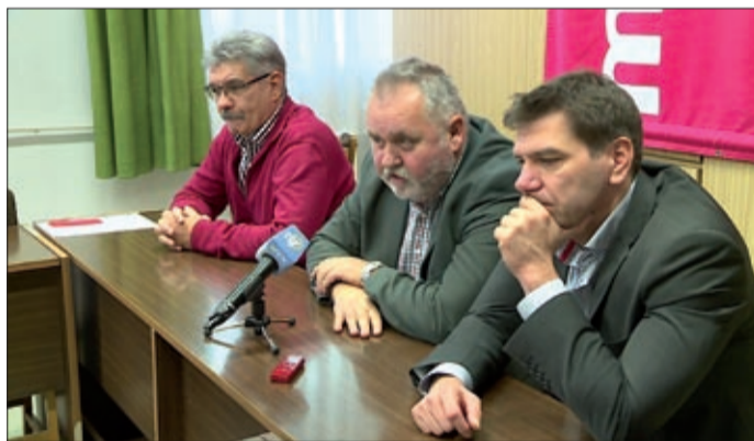
„A szürkegazdaságot fogja erősíteni a minimálbér-emelés”