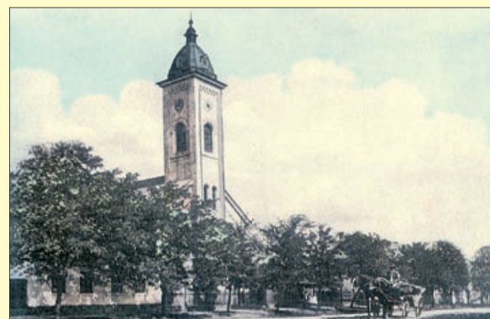
A jaminai evangélikus templomot 1876. november 27-én szentelte fel Szeberényi Gusztáv püspök

Az erzsébethelyi evangélikus templom 140 éves