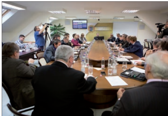
Soron kívüli ülés még lehet ebben az évben is

A megyeyűlés bejelentésekkel zárult, melyekből kiderült, hogy bár a mostani volt az utolsó soros ülés ebben az évben, rendkívüli közgyűlés várhatóan lesz még idén.