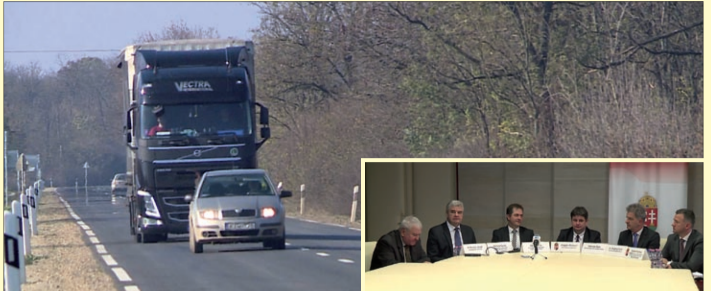
A Tiszakürt és Kondoros közötti 61,4 km-es útból 37 km érinti Békés megyét

Decemberben vagy a jövő év elején kezdődhet a munka