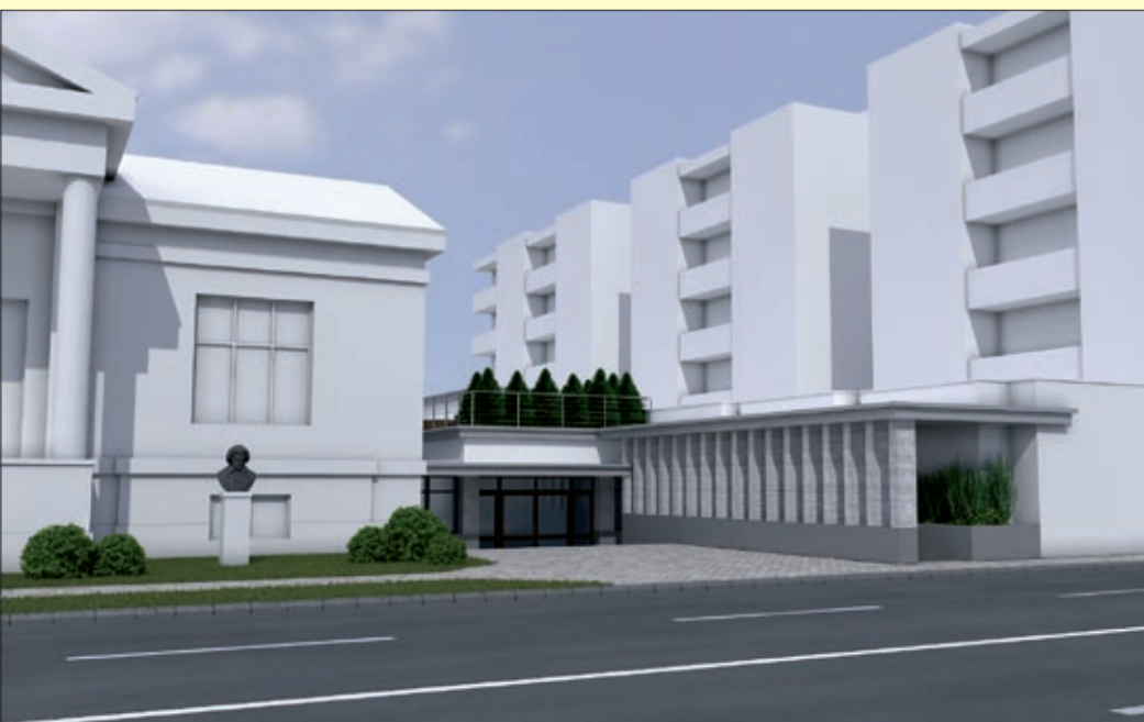
A munkálatok a tervek szerint 2017 nyarán kezdődnek és egy évig tartanak

A két épület összekötésével új kiállító- és közösségi fogadótér jön létre