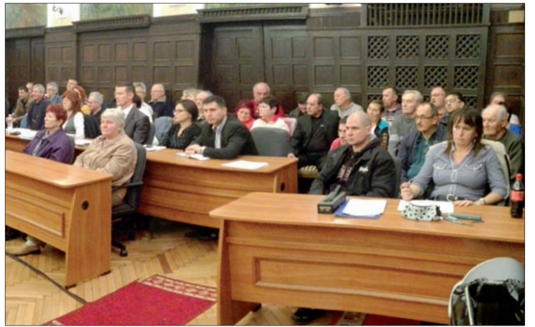
A közmeghallgatásra nagyon sok érdeklődő eljött

Gyűjtő hangú beszéd hangzott el a Csabagyöngye szőlőültetvény mellett, azt ugyanis az előző közgyűlésen az egyik