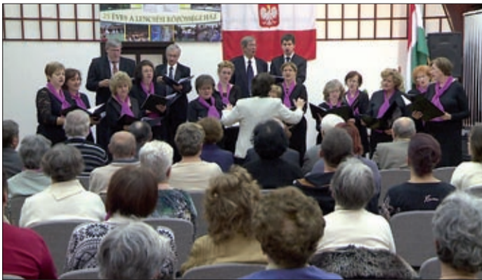
A Chopin kórus lengyel dalokat énekelt a közösségi házban