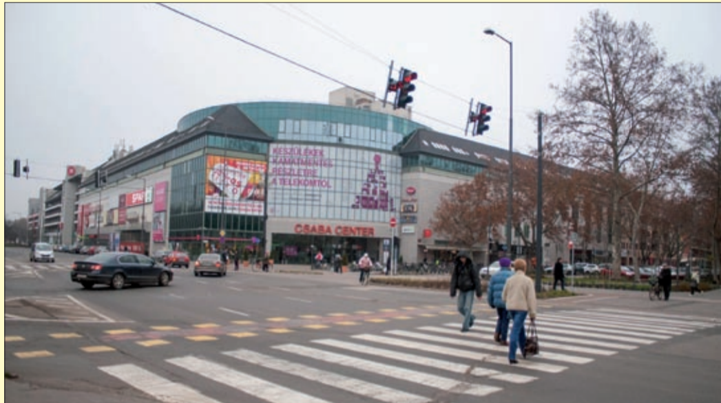
A belváros-rehabilitáció során kinyitották az Andrássy utat a Petőfi és Jókai utca felé