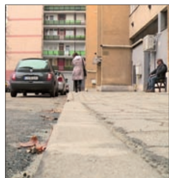
Aszfaltoltak, szegélyköveket cseréltek, burkoltak

A megszüpült, megújult részek hivatalos átadásakor Bíró Csaba , Békéscsaba 5. számú választókerületének önkormányzati képviselője kiemelte, hogy egy nagyon fontos fejlesztést valósítottak meg önkormányzati forrásból, amely a lakók és az arra járók mindennapjait is megkönnyíti.