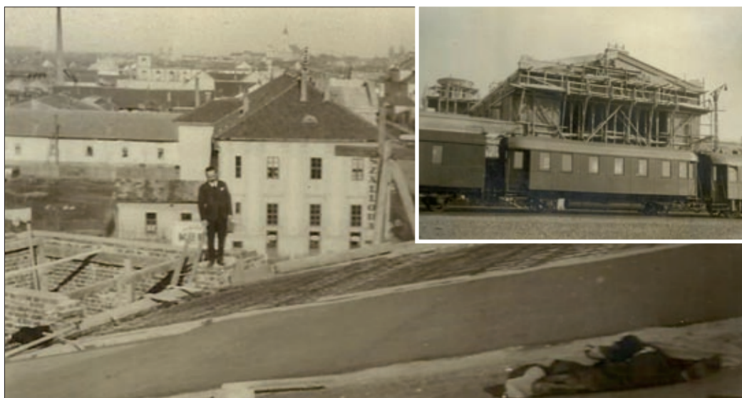
Képek az új állomás építéséről (a néhai Darida János építőmester archívumából)

A 157 éves csabai vasútállomás múltjáról