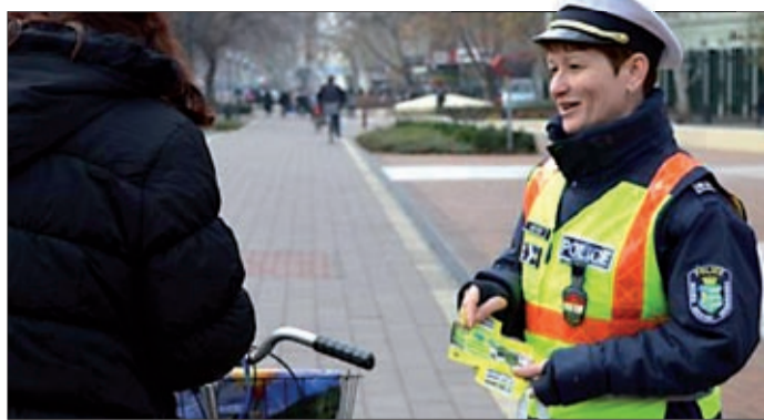
A biztonságos közlekedésre figyelmeztetnek

A téli hónapokban rövidebbek a nappalok, ráadásul köd is gyakran nehezíti a közlekedők dolgát. Ezért a gyalogosoknak és a kerékpárosoknak nagy gondot kell fordítaniuk arra, hogy láthatóvá tegyék magukat.