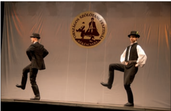
Nálunk hagyománya van a néptáncmozgalomnak