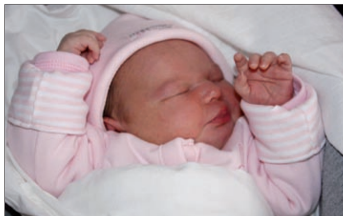
A baba születését követő 90 napon belül lehet igényelni

Az idén született csabai babák szülei már igényelhetik a 42 500 forintos, egyszeri Csaba Baba életkezdési támogatást, amelyet az önkormányzat nyújt azoknak a családoknak, akik a gyermek születésekor és az azt megelőző három évben is itt éltek. Lapzártánkig még nem igényelték ezt a támogatást az idén érkezett gyermekek szülei.