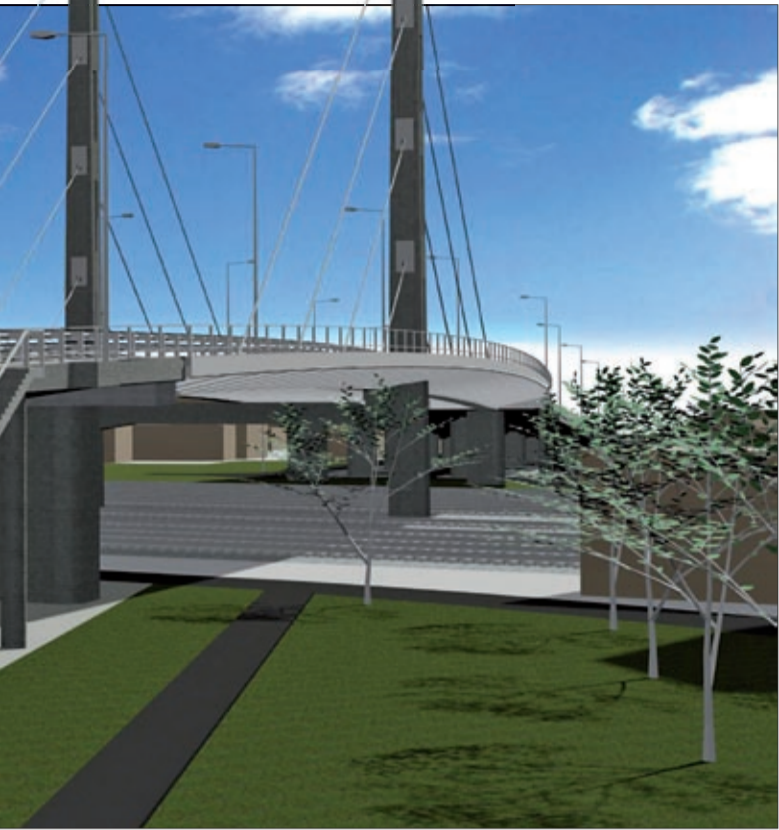
nyáron ível át a sínek felett. Az Új Széchenyi Terv Közlekedés Operatív Program keretében 34,9 milliárd forintból megvalósuló beruházás leglátványosabb részét egy magas pilonú hídon külön gyalogos és kerékpáros sáv is létesül, ami biztonságosabb, de szebb is lesz a réginél.