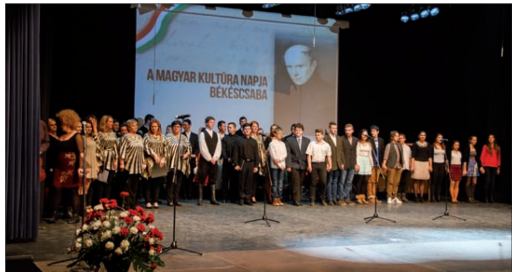
A színpadon a Csabagyöngye Kulturális Központ alkotó közösségei

– Minden nemzetre, minden közösségre jellemző az, hogy miképpen szelídíti meg a természetet és hogyan hagyományozza ezt át nemzedékről nemzedékre. Ezek a tradíciók tartják egyben és teremtik újjá a közösségeket, a nemzeteket. A brazilokat a tánc, az angolokat a tea, a németeket a precizitás, az olaszokat a muzsika, a magyarokat a bor, a békéscsabaiakat