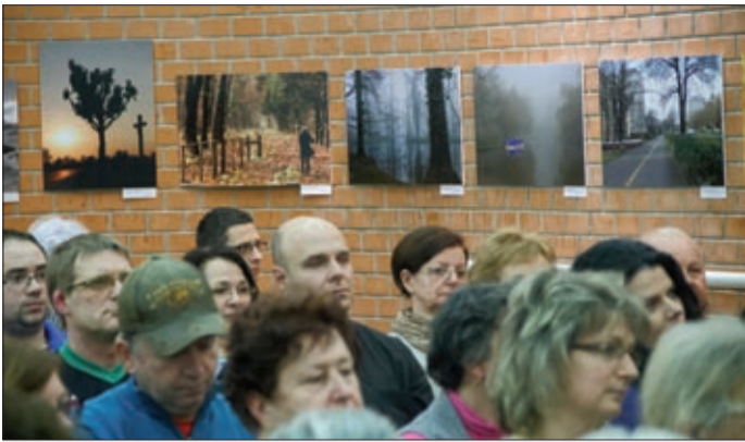
Több mint harminc fotó látható a közösségi házban

Fotókiállítást nyitottak meg január 21-én délután a Lencsési Községi Házban. Az esemény a magyar kultúra napjához illeszkedő programok sorozatába tartozik.