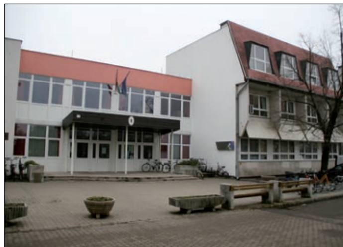
Január végétől március elejéig tartják a nyílt napokat