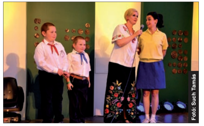
A múzeumban a retro jegyében zajlottak a programok