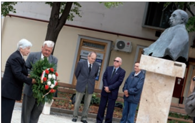
A Nagy Imre Társaság Békéscsabai Szervezete koszorúzott

A Nagy Imre Társaság Békéscsabai Szervezete tartott megemlékezést a mártírháltalt halt miniszterelnökről elnevezett téren június 16-án délelőtt.