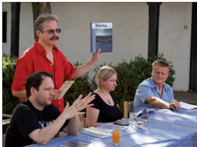
A Bárka irodalmi, művészeti és társadalomtudományi folyóirat legfrissebb számát is bemutatta