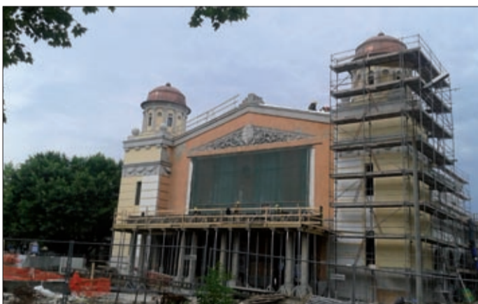
Augusztus második felében megszűnik a felvételi épületen keresztül történő közlekedés

A vasútállomás épületénél a gyalogos-aluljáró szerkezetkész. Augusztus második felében megszűnik a felvételi épületen keresztül történő közlekedés, ekkortól az utasok a C peront már az aluljárón keresztül közelíthetik meg. A C peront június 22-én adták át az utazóközönségnek, a nyár folyamán épül az A és a B peron is. Az állomás előtti téren megkezdődik a P+R parkoló építése, jelenleg a közművek kiváltását végzik. Június 26-ától augusztus 18-áig Békéscsaba és Gyula között vágányépítés miatt vonat-