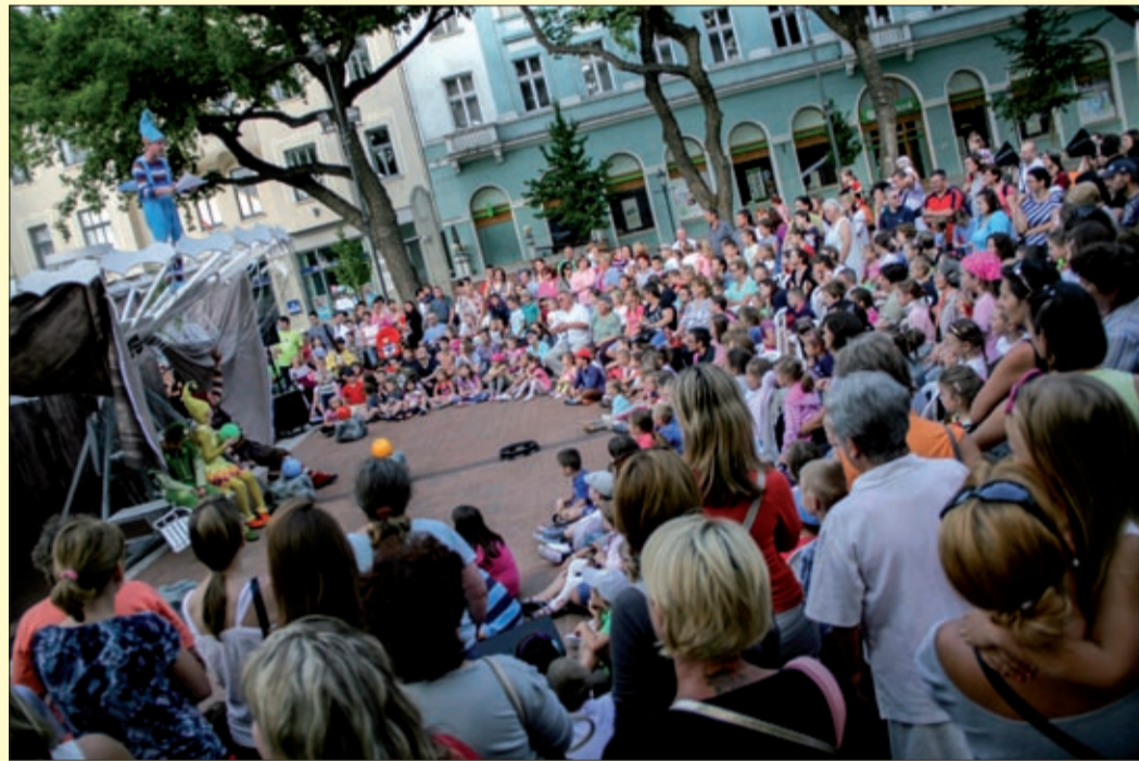
A fotóteren idén is egész nyáron válogathatunk a programok között