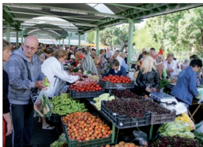
A Békéscsabai Járásbíróság döntése szerint az Agórának át kell adnia az ingatlanokat a vagyonkezelő részére

Június 5-én jogerőre emelkedett a Békéscsabai Járás-