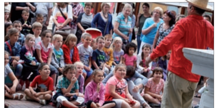
Három napon át 27 előadást láthattak a nézők