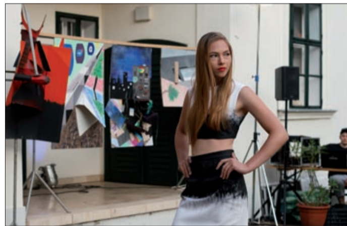
Divatbemutató az emlékház udvarán