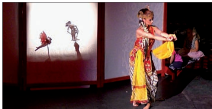
Még Indonéziából is érkeztek bábművészek