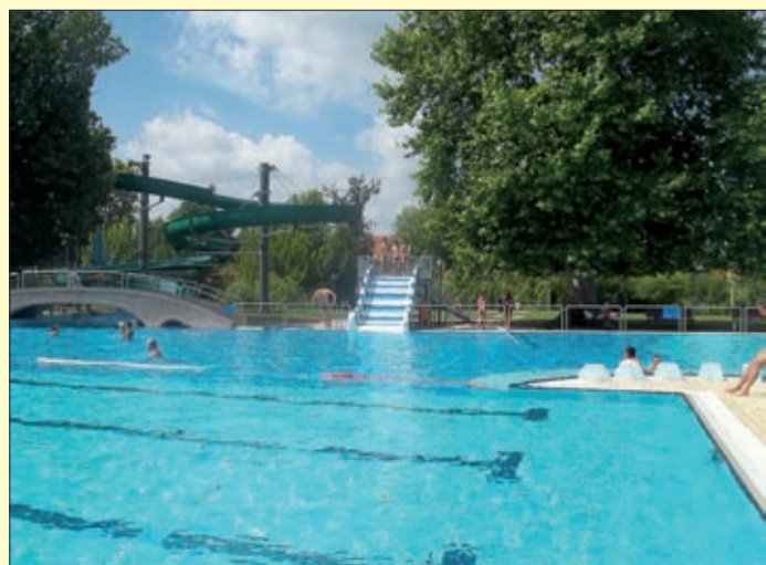
A csúszda használataért nem kell külön fizetni

Az Árpád fürdő új élményelemmel gazdagodott: a strand élménymedencéjében családi csúszdát adtak át június 19-én. Másnap, a magyar úszás napján – amikor mintegy ezren éltek a fürdőben a délelőtti ingyenes belépés lehetőségével – sokan ki is próbálták az új eszközt.