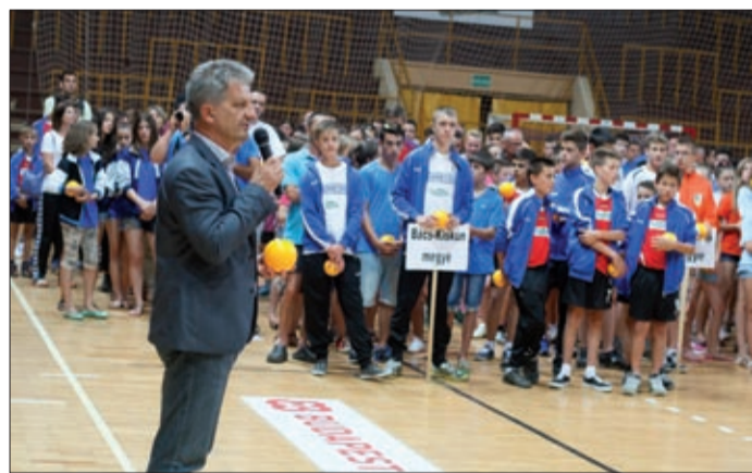
Közel kilencszáz diák vett részt a megmérettetésen