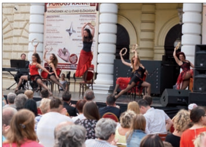
Részleteket láthattunk a Land of Music produkciónak

A Gálfy László színművész, a teátrum egykori igazgatója emlékére, a családdal közösen létrehozott díj, a Gálfy Gyűrű-díj odaítéléséről a hagyományoknak megfelelően szakmai bírálóbizottság döntött. A kitüntetettre az elmúlt évadban bemutatott darabok rendezői tettek javaslatot, ebből a zsűri választotta ki a legérdemesebbet. A szak-