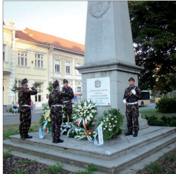
1914. augusztus 2-án indultak a háborúba a 101-esek, akiknek emlékét obeliszok őrzik városunkban

A magára maradt gyerek ezután sok helyen megfordult, de legtöbbször Csabán tar-