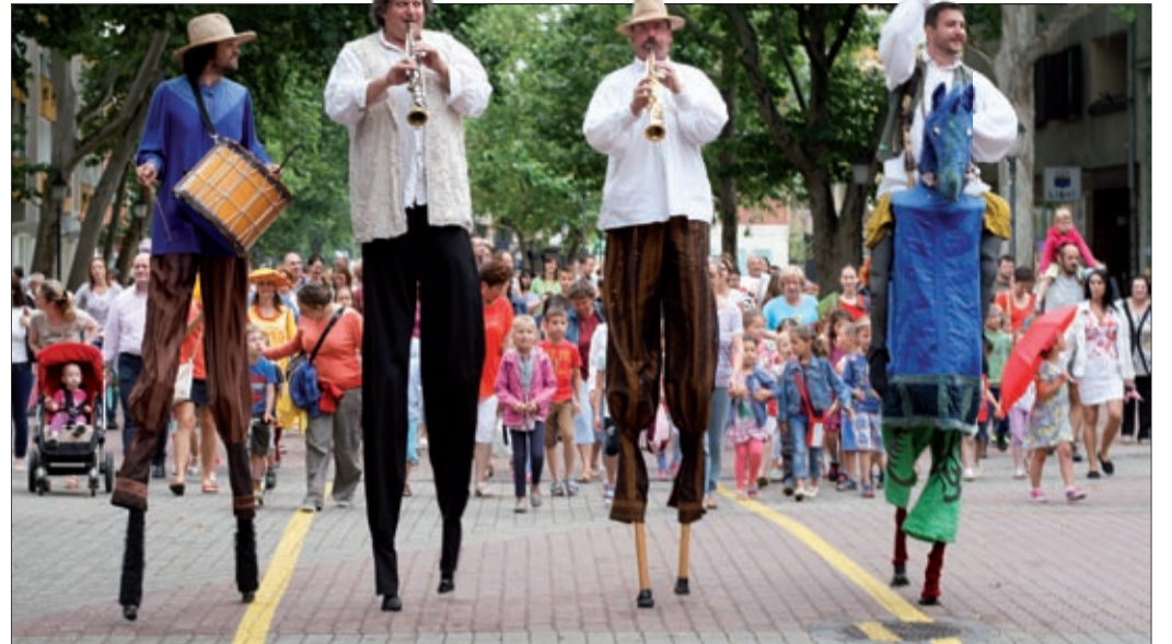
Langaléta Garabonciások és mögöttük a népes „kurta lábú publikum”

Valóban fantasztikus volt az, amit a Békéscsabai Napsugár Bábszínház és a közreműködők június 19-e és 21-e között elének tártak a bábfesztiválon, ahol kilenc hazai mellett öt külföldi társulat is képviseltette magát. Összesen 27 produkciót láthatott a közönség, három napon át szinte folyamatosan zajlottak a bábos előadások, amelyekben volt minden a vásári komédiától a báboperáig. A bábéledad-