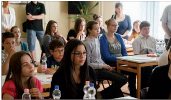
A diákok öt állomáson adtak számot tudásukról

A Békéscsabai Történelemtanárok Munkaközössége harmadik alkalommal szervezte meg a városismereti versenyt azzal a céllal, hogy a csabai diákok minél jobban megismerjék Békéscsaba történelmét. A versenyen tíz iskola 4-4 fős csapata mérte össze tudását.