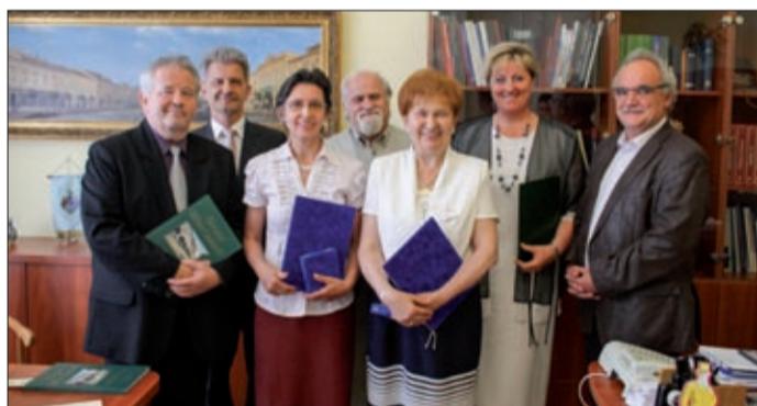
A polgármester irodájában fogadták a pedagógusokat

Szarvas Péter városunk diákszága, a pedagógustársadalom és a városvezetés nevében köszönte meg a kitüntetettek munkáját – méltatva életpályájukat és további jó egészséget kívánt szakmai munkájukhoz. A polgármester személyes ismerősként is üdvözölhette az