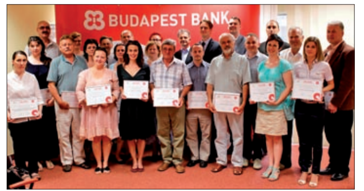
A támogatott szervezetek képviselői a Budapest Bankban

Mint megtudtuk, a Budapest Bank bankműveleti központja a 2006-os létrehozásától kezdve nemcsak gazdasági tevékenységével, hanem a sport-, oktatási és kulturális célok felkarolásával is aktív szerepet vállalt a helyi társadalom életében. A „Budapest Bank Békéscsabáért