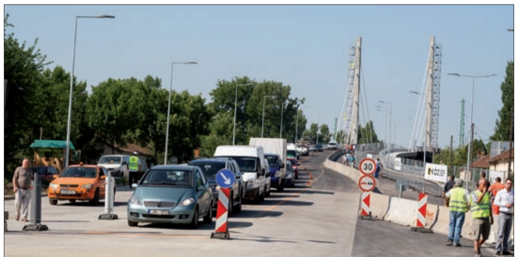
Egyelőre 2 x 1 sávon és a közös gyalogos-kerékpáros sávon lehet közlekedni

Vantara Gyula országgyűlési képviselő arról beszélt, hogy a jaminaiaknak és az arra közlekedőknek bizony nagyon sok kényelmetlenséggel járt a híd és a kapcsolódó fejlesztések építése. Köszönetet mondott a Nemzeti Fejlesztési