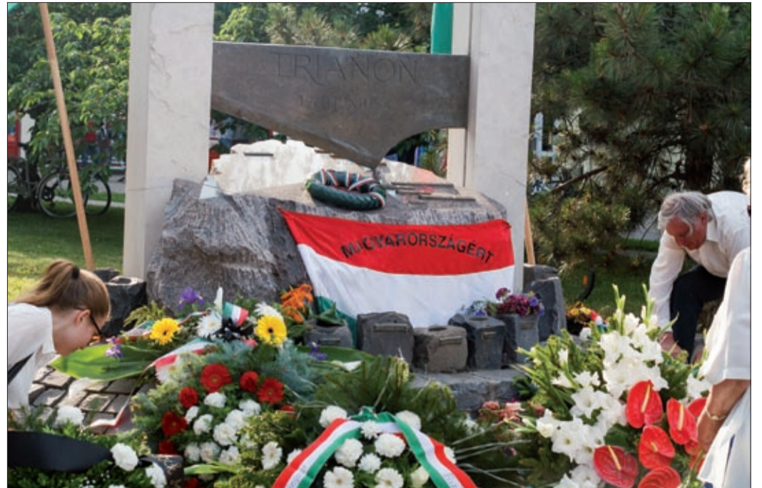
A város, a pártok, szervezetek, elcsatolt területek képviselőinek koszorúja az emlékműnél

halmaza, hanem folyamatok összessége. Ezt bizonyítandó, felidézte a magyarság