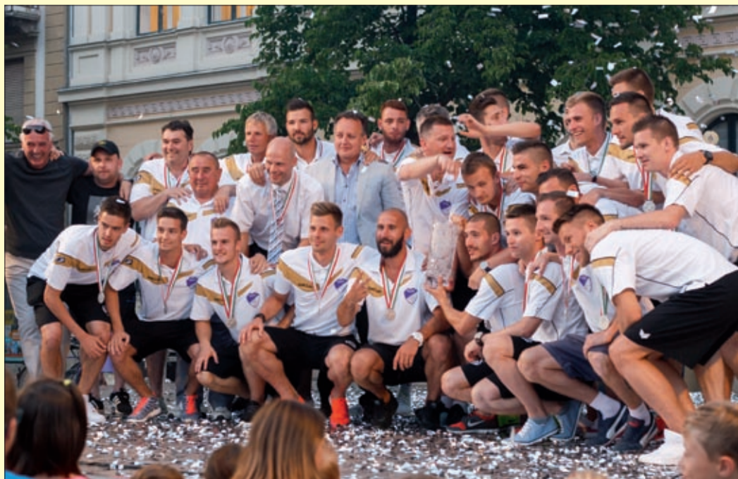
Békéscsaba 1912 Előre: Megcsináltuk, mert együtt erősebbek vagyunk

Ezüst konfettieső bullott a csabai focistákra a főtéren