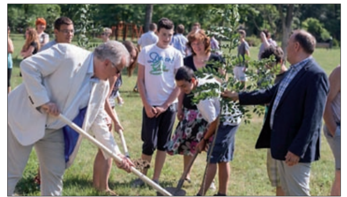
Negyedik éve ültetnek fát a ballagók a Lencsesin

Három kimagasló teljesítményt nyújtó diákot jutalmaztak meg a Lencsesi Általános Iskolában június 10-én, majd a végzős osztályok egy-egy fát ültettek el a közeli parkban.