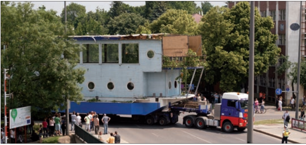
Egész tömeg figyelte, ahogy a Gyulai útról bekanyarodott a hajót szállító kamion

Városszerte nagy feltűnést keltve, június elsején, egy nagy kamionon, közúton érkezett meg a Gőzmalom térre a B38 rendezvényhajó. A hajót a felújítást követően, várhatóan a nyár második felében nyitják majd meg a nagyközönség előtt.