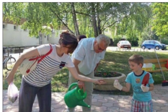
A környéken lakók segítségével pótolták a virágokat

Példás összefogás és lakossági kezdeményezés eredményeként ismét szép környezetben várakozhatnak a betegek a Lencsési lakótelepi orvosi rendelők előtti kis téren.