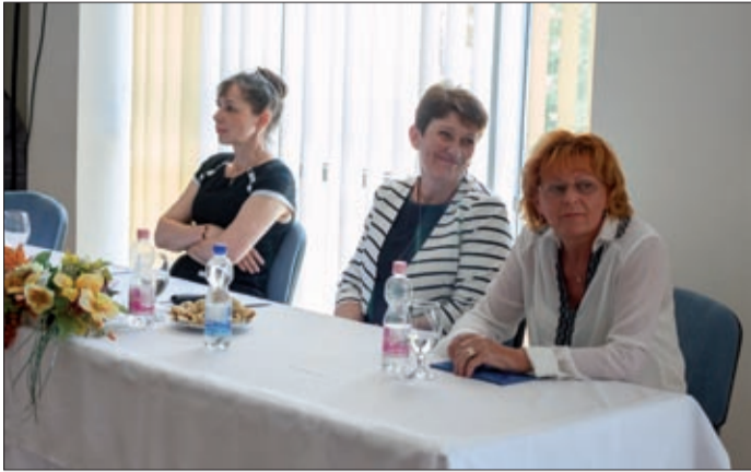
Az évforduló a védőnői hivatásra irányítja a figyelmet

A Csabagyöngye Kulturális Központban június 5-én ünnepelték a védőnői szolgálat megalakulásának 100. évfordulóját.