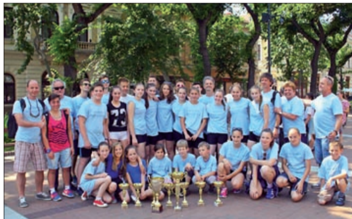
A győztes az első sportfesztiválon Békéscsaba lett