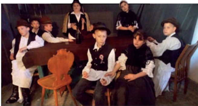
További képek: www.nyitottszemmelkhe.hu

Két kategóriában hirdettünk nyertest: A közönség-szavazás 1. helyezettje a Lencsési Általános Iskola Kutyacsalád című kompozíciója, a zsűri pedig a Jan-