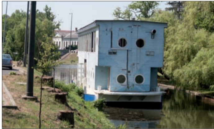
A hajót átalakítják, várhatóan a nyár második felére lesz kész