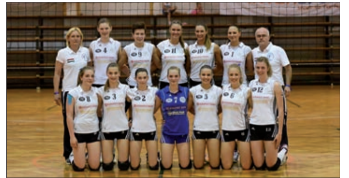
Aranyérmet szerzett a BRSE junior csapata is

A felnőtt és a ifjúsági gárda elsősége után a Békéscsabai Röplabda SE junior csapata is aranyérmet szerzett.