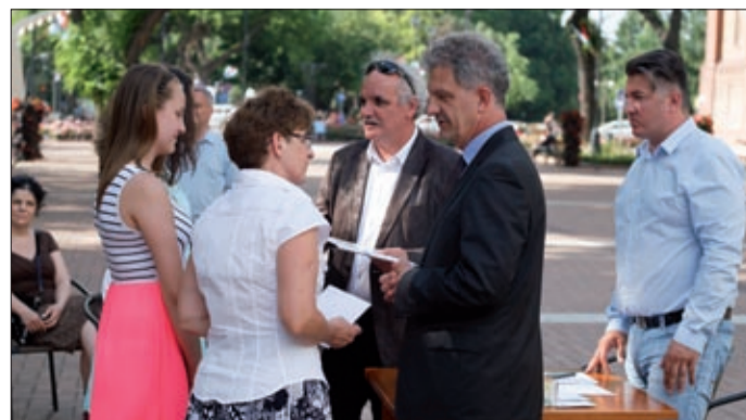
A pedagógusok és a diákok vették át az utalványokat