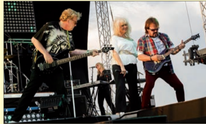
A zenei programok sorát a Neoton kezdte