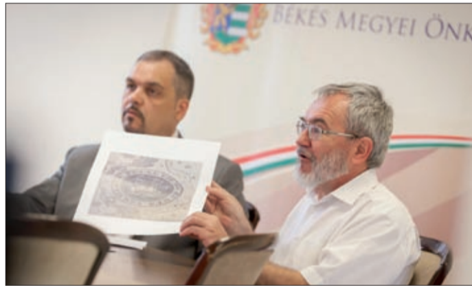
Javaslatot tesznek a jelképek helyreigazítására