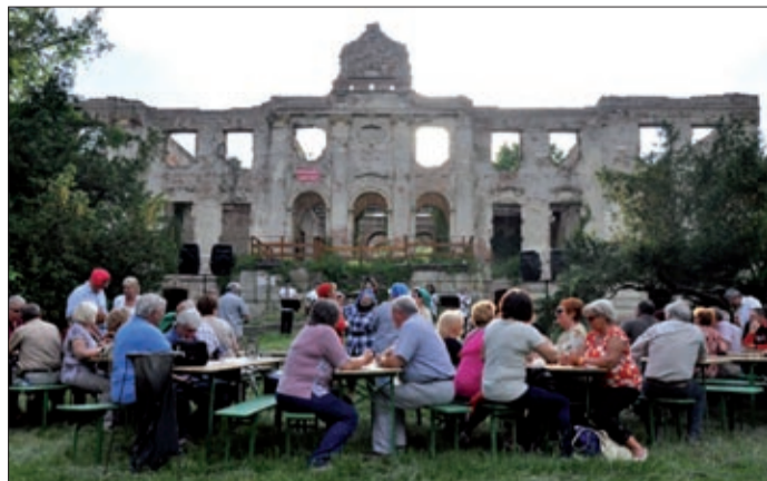
Jó hangulatban telt a Hetedik Csabai Tavasz Szesztivál