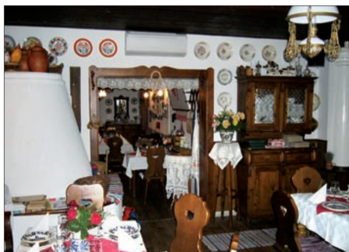
A kézzel készült berendezések is különlegessé teszik

dezések, székek, függönyök, festett tányérok is különlegessé teszik. A kisvendéglőt a szakma is többször elismerte, 2003-ban az Ígyenc túrák, majd az Ízutazás ajánlotta gasztronómiai úti célként, aztán bekerültek az ország száz legjobb vendéglőjét felvonultató kiadványba, a Vendég és hotel című nemzetközi szaklap Harmónia és dizájn a vendég szemével című versenyén országos első helyezettek lettek, s most a 25 legjobb magyar kisvendéglő közé kerültek.