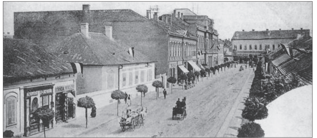
Innen idultak és ide tértek vissza a korzók

A Magyar-Holland Kultúrgazdasági Rt., valószínűleg a csabai korzó hírnevének köszönhetően határozta el, hogy filmet forgat róla. A forgatás idejét, 1929. november 3-át a Békéscsaba Képzőművészeti Társaság figyelmébe ajánlva a 11–12 óra közötti forgatást. Továbbá tudatták, hogy a felvételeket még novemberben a Csaba Mozgóban levetítik.