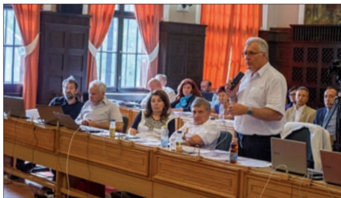
A fiatalok életkezdését, itthon tartását rejti a program

Az idei költségvetésben ötmillió forintot különítettek el a Békéscsaba hazavár! ösztöndíjprogram első támogatási időszakára. Elkészült az ösztöndíjprogram koncepciója, amelynek alapján a rendelet kétféle támogatást különböztet meg: a felsőoktatási hallgatói ösztöndíjat és az életkezdési, munkába állási ösztöndíjat.