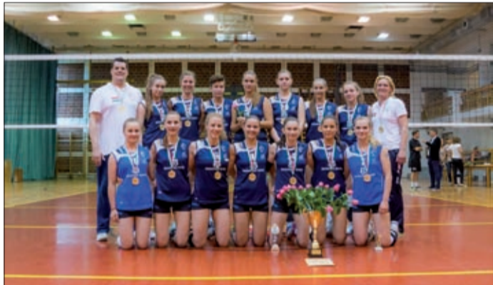
A csapat nyert az Országos Ifjúsági Kupa döntőjében

Hatalmas csatában sikerült megvédenie tavalyi elsőségét a BRSE ifjúsági korosztályú csapatának a Békéscsabán rendezett Országos Ifjúsági Kupa döntőjében. A csabai lányok, csakúgy, mint egy éve, az örök rivális Vasas Óbuda ellen léptek pályára, és egy közönségszórakoztató csatában, a döntő szettben sikerült nyerniük.