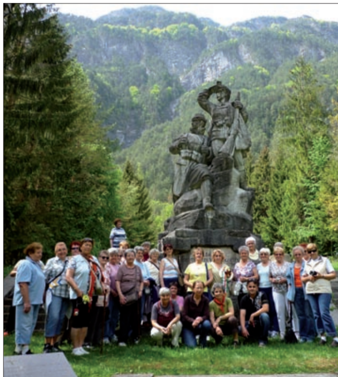
Bejárják a Békéscsaba történetéhez is kötődő helyszíneket