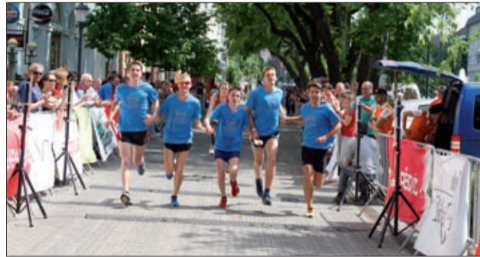
Befutók másnap a Szent István téren