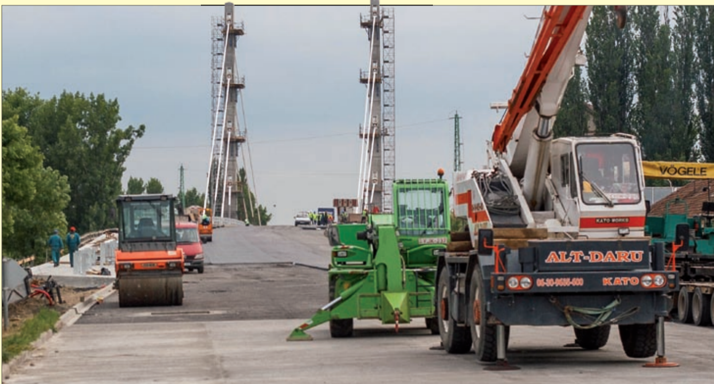
Az utolsó simítások az Orosházi úti felüljárón az ideiglenes forgalomba helyezés előtt

– A felvételi épület déli szárnyán elkészült az új manzárdtető és a külső felújítás, a színezés kivételével. Belül már a gépészeti szerelési munkák folynak. A kijárati csarnok előtt befejeződött a négyoszlopos portikusz helyreállítása is. Jelenleg az utasforgalom a csarnokon keresztül zajlik. Jó ütemben halad a pénztárak