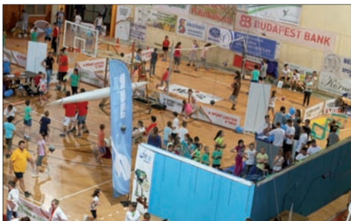
Mindent kipróbálhattak az iskolások

A Sport Legyen a Tied program keretében, május huszadikán, a helyi sportegyesületek közreműködésével tizenötféle sportot láthatnak és próbálhattak ki az általános iskolások a sportcsarnokban. Volt, aki ott fogott először a kezébe teniszütőt, próbálta ki a vívás, a küzdősportokat, vagy először röplabdázott, méghozzá rögtön a magyar bajnokcsapat, a BRSE büszkeségeivel. Ott voltak az atléták, a vízilabdások, a kosarasok, a tornászok, de még a kajak-kenut is ki lehetett próbálni, persze csak a küzdőtéren felállított eszközök segítségével.