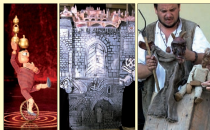
Kilenc hazai és öt külföldi társulat darabjait láthatjuk