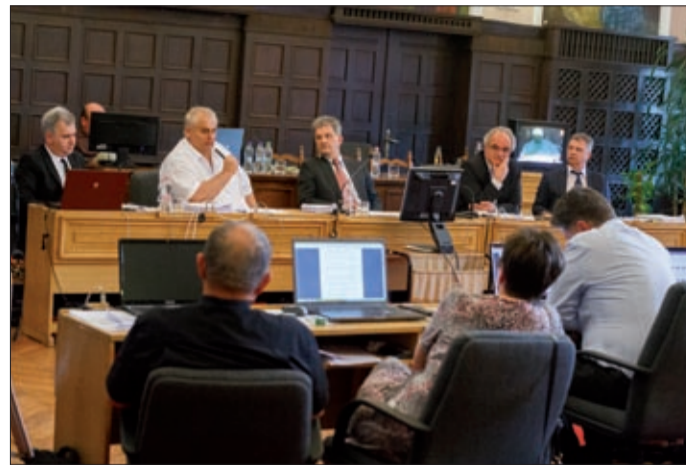
A Terület- és Településfejlesztési Operatív Program részdokumentumai a tervezett fejlesztéseket tartalmazzák

A kormányhatározatban rögzített forráskerete Békéscsabanak 2014–2020-ig szólóan 13,2 milliárd forint. A dokumentumban megfogalmazottak szerint a következő területeken várható fejlesztés: Munkácsy Kulturális Negyed program; zöldfelületi, közterületi infrastruktúrafejlesztés; kerékpárút-építés; a vállalkozásokat rendszerbe szervező Csaba Szíve Program; 2017-ben a Luther év eseményei és az ezekhez kapcsolódó fejlesztések; az északi és a déli iparterületek fejlesztésén túl a repülőtéren és a Csanádapácai út mellett valósulhat meg gazdaságfejlesztési projekt; a Berényi út mentén komplex szociális városrehabilitáció, közösségi ház kialakítása, parképítés és térrehabilitáció; a Lencsési lakótelep rehabilitációja, amely magában foglalja a közlekedésfejlesztést, egy komplex