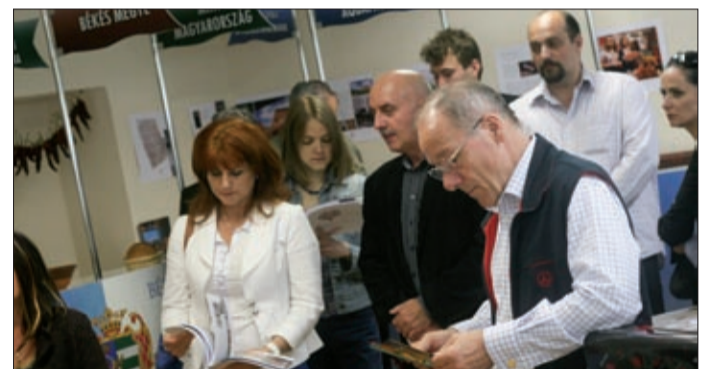
A bemutatóteremben egy helyen láthatók megyénk értékei