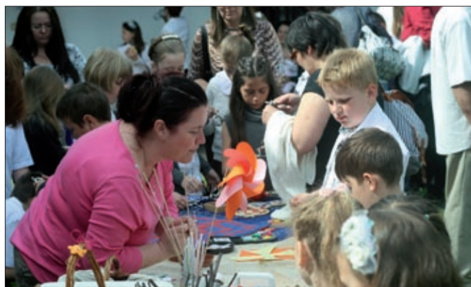
A gyerekek játszottak is a Meseházban