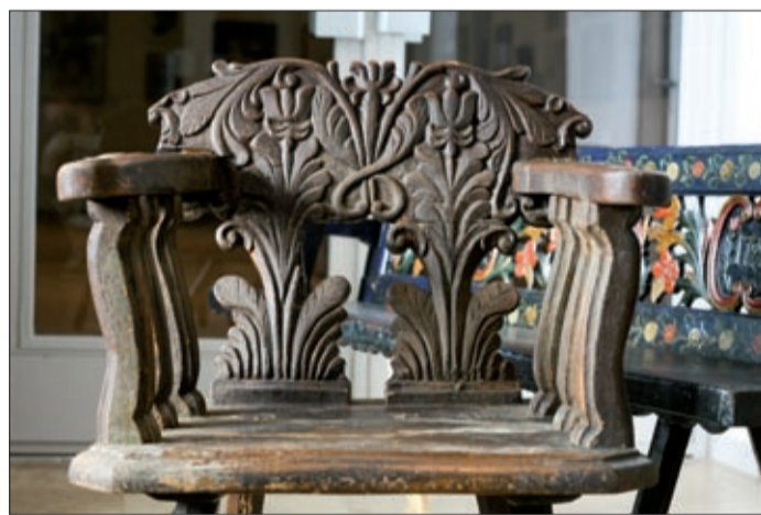
A bírói szék, háttérben egy festett, jellegzetes csabai paddal

– A békéscsabai szlovákoknál használatos bútorok többsége sötétkék alapon színes, bazsarózsás, tulipános díszítéseket visel magán. Ezek a XVIII. század végén jelentek meg, amikor II. József türelmi rendeletének hatására német templomépítő mesterek érkeztek hozzánk, az itt élők vélhetően tőlük tanulták a díszes faragást, festést. Erről árulkodik az is, hogy a népi bútorok és a templomi berendezések sok hasonlóságot mutatnak például méretben, díszítettségben – mondta Ando György, majd arra emlékeztetett, hogy maga Munkácsy Mihály is készített, illetve festett jellegzetes, csabai bútorokat. Mint ismert, 1854-ben Lang mesternél volt asztalosinas a később művész pályára lépő Munkácsy, s ekkor vett részt ő is a bútorok készítésében. Erről 1890-ben városunkban is szó esett, amikor a festő Aradra menet megállt itt, később visszaemlékezéseiben maga is említést tett erről.