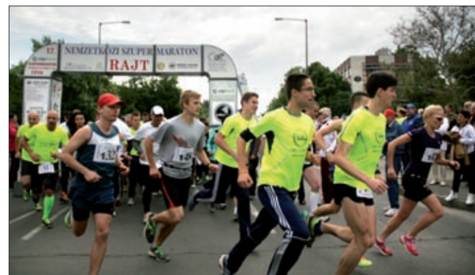
Idén a Budapest Bank volt a verseny névszponzora

A 18. alkalommal megrendezett Békéscsaba-Arad-Békéscsaba Nemzetközi Szupermaraton résztvevői május 16-17-én ismét 200 kilométeres távot teljesítettek két nap alatt. A verseny névadó szponzora idén a békéscsabai bankműveleti központot is működtető Budapest Bank volt.