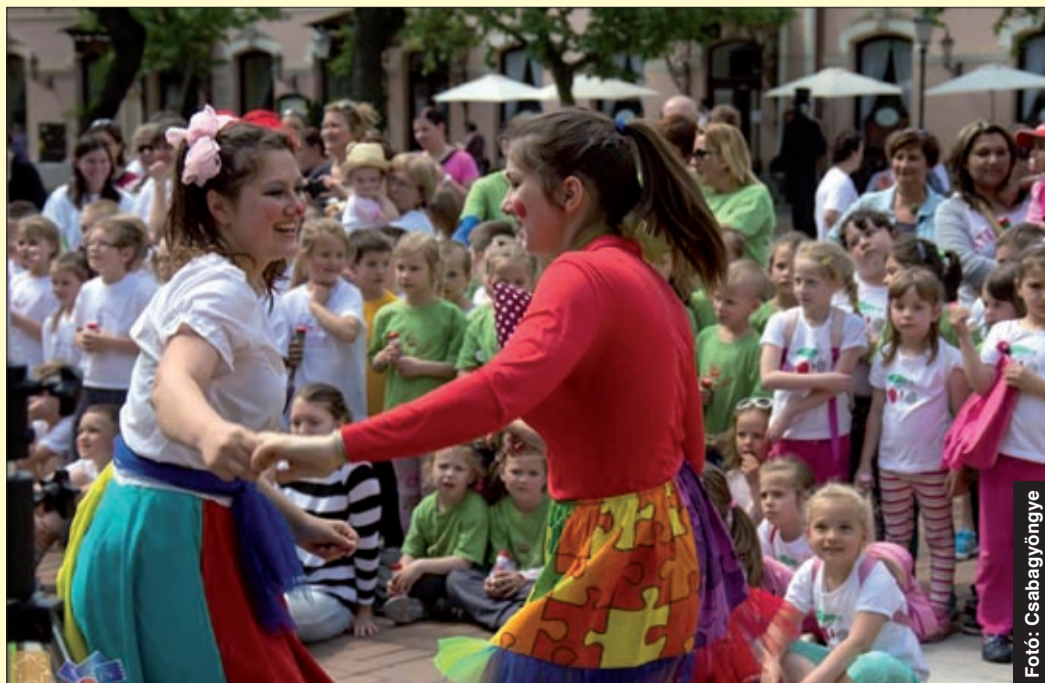
Az óvodások először csák nézték a műsort, aztán együtt táncoltak a bohócokkal

A jubileumi, 20. városi sportnapon versengtek a kicsik