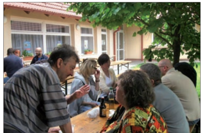
Megoszthatták egymással örömeiket, gondjaikat

Május második vasárnapján mintegy hatvanan vettek részt a vesebetegeknek, szervátültetetteknek és hozzátartozóiknak rendezett családi napon a Jaminai Községi Házban. Elmondható, hogy ezen a napon valamilyen jól érezték magukat.