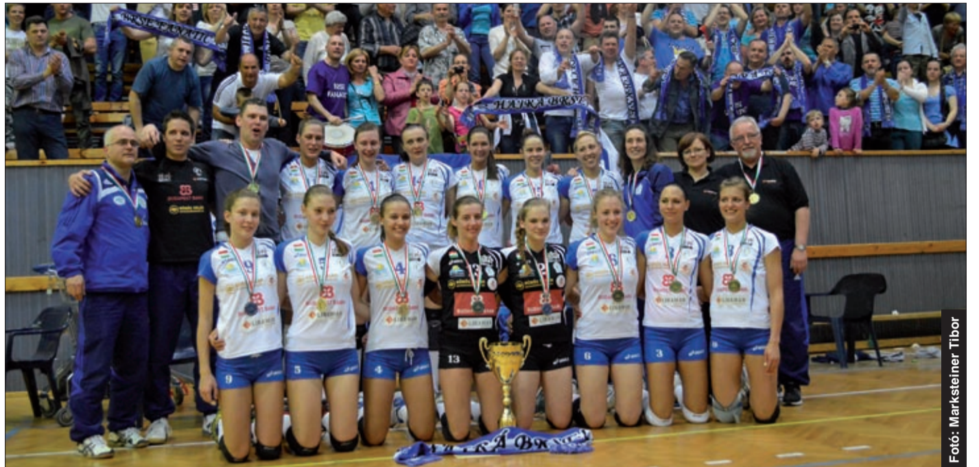
A Vasas Folyondár utcai csarnokában a bajnokcsapat, háttérben a csabai szurkolókkal

Március 27-én következett a folytatás a csabai sportcsarnokban. A nagy érdeklődésre való tekintettel a sportcsarnok összes szektorát megnyitották, csaknem kétezer ember látta, ahogy a csabai lányok 3:1-re győztek. Ezután a csapat a következő budapesti meccsre készült, a közösségi oldalakon pedig szerveződtek a szurkolók.