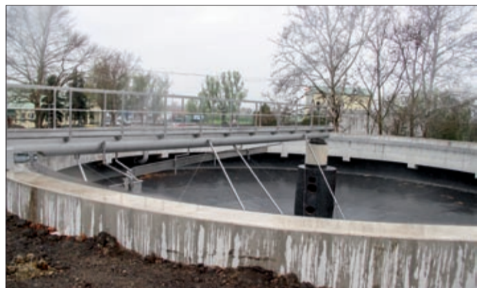
A szennyvíztelep korszerűsítése 3,7 milliárd forintba került