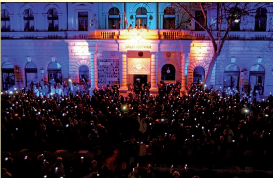
Nemcsak a színház épülete borult kékbe, pár pillanatra a telefonok felmutatásával megannyi kis kék fény csatlakozott hozzá

Kékben ragyogott a Jókai színház azokért, akiknek nehezebb a „világélés”