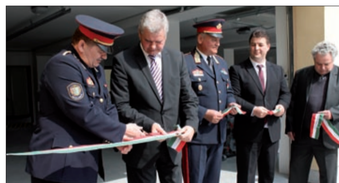
A veszélyhelyzet-kezelési központ is itt kapott helyet

Közel 240 millió forintos beruházással alakították át és újították fel a Békés Megyei Katasztrófavédelmi Igazgatóság „B” épületrészét, melynek költségeit az Országos Katasztrófavédelmi Főigazgatóság (OKF) állta.