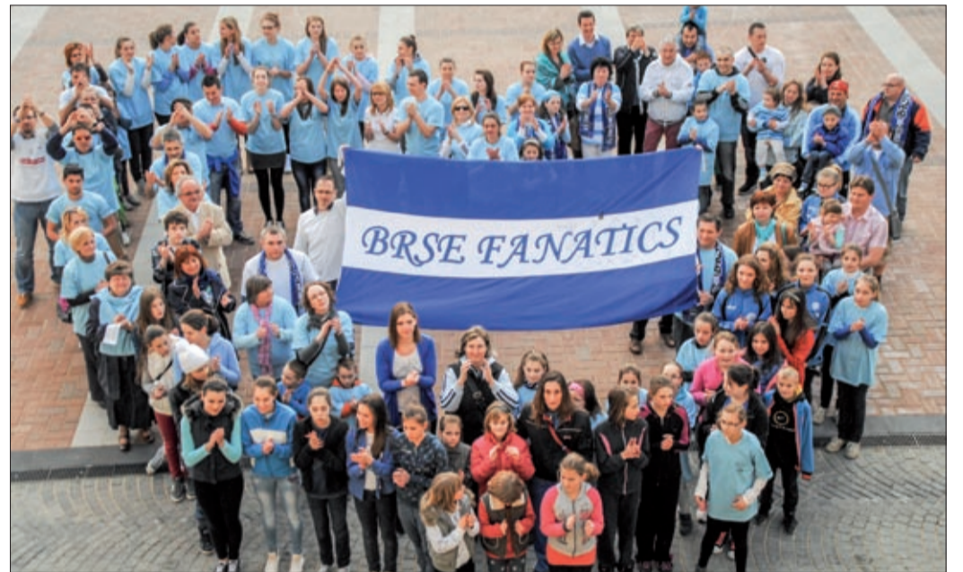
Flashmob március 26-án a városháza előtt, ahol a röpisekért dobogott a város szíve