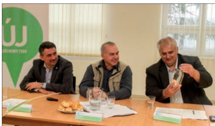
A megtisztított vizet mindenki ellenőrizhette

– Nagyon jelentős, az itt élők szempontjából is fontos beruházás egyik helyszínén vagyunk. A szennyvíztisztító telep fejlesztése még 2012 nyarán az új szennyvízvezeték, az új tisztítóberendezések kialakításával kezdődött. A csatornahálózat mára elkészült, működik, s ez máris javít környezetünk állapotán