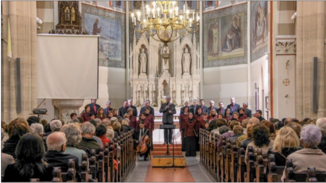
„Lélekhangoló” a fesztivál keretében a Pádúai Szent Antal Társszékesegyházban

Március 7. és 31. között több mint ötezer látogatója volt a XII. Békéscsabai Tavasz Fesztiválnak csak a CSaKK-ban, azaz a Csabagyöngye Kulturális Központban. A látogatói kör ennél azonban sokkal népesebb volt, hiszen több mint egy tucat intézmény, szervezet összefogásával mintegy ötven programot kínáltak a szervezők a fesztiválozóknak, és a rendezvények csaknem fele ingyenes volt.