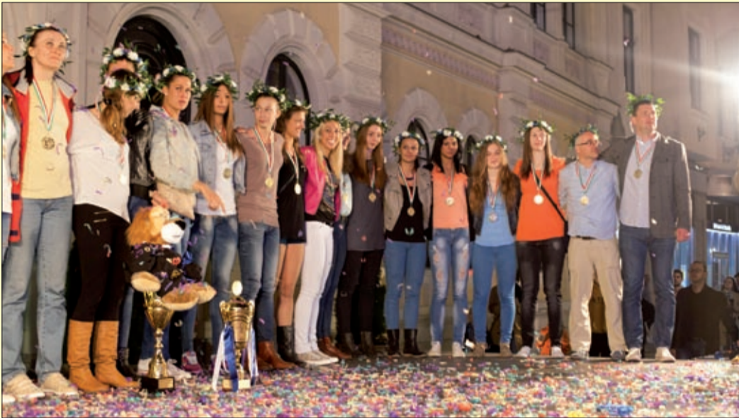
Az „aranycsapat” tagjai a megérdemelt babérkoszorúval a fejükön

Izzik a csarnok, itt a magyar bajnok! – skandálta sok-sok ember március 31-én este Békéscsabán, a Szent István téren, akárcsak egy nappal korábban Budapesten, ahol a Linamar-Békéscsabai RSE harmadszor győzte le a Vasas-Óbuda gárdáját, és ezzel megszerezte a magyar bajnoki címet. A főtéren rengetegen mondtak köszönetet a csapatnak ezért a csodáért.