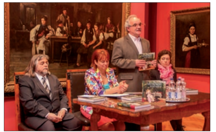
A 400 oldalas könyv újszerűen mutatja be Munkácsy életútját

A múzeumban március 28-án mutatták be a festőóriás születésének 170. évfordulója alkalmából meghirdetett emlékvéketében a Munkácsy-öröknaptár. A 400 oldalas könyv újszerűen mutatja be Munkácsy Mihály életútját, művészetét, hétköznapijait, elsősorban levelezései és „Emlékeim” című önéletrajzi ihletésű írása, valamint festményei alapján.