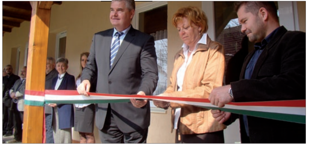
A Jaminai Községi Ház 33,5 millió forintból újult meg

Kívül-belül megszépült, korszerűsödött és egy új szárnyal ki is bővült a Jaminai Községi Ház. A szociális célú városrész-rehabilitáció második ütemét április 1-jén adták át ünnepélyes keretek között.