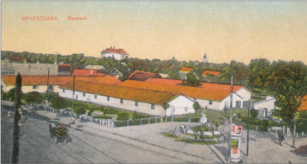
Katonai barakkok lát képe egy az 1920-as években kiadott képeslapon

Száztizenöt éve felállított csabai katonai barakkok lát képét örökítette meg az angyalos értéki kúttal, egy, az 1920-as években kiadott képes levelezőlap.