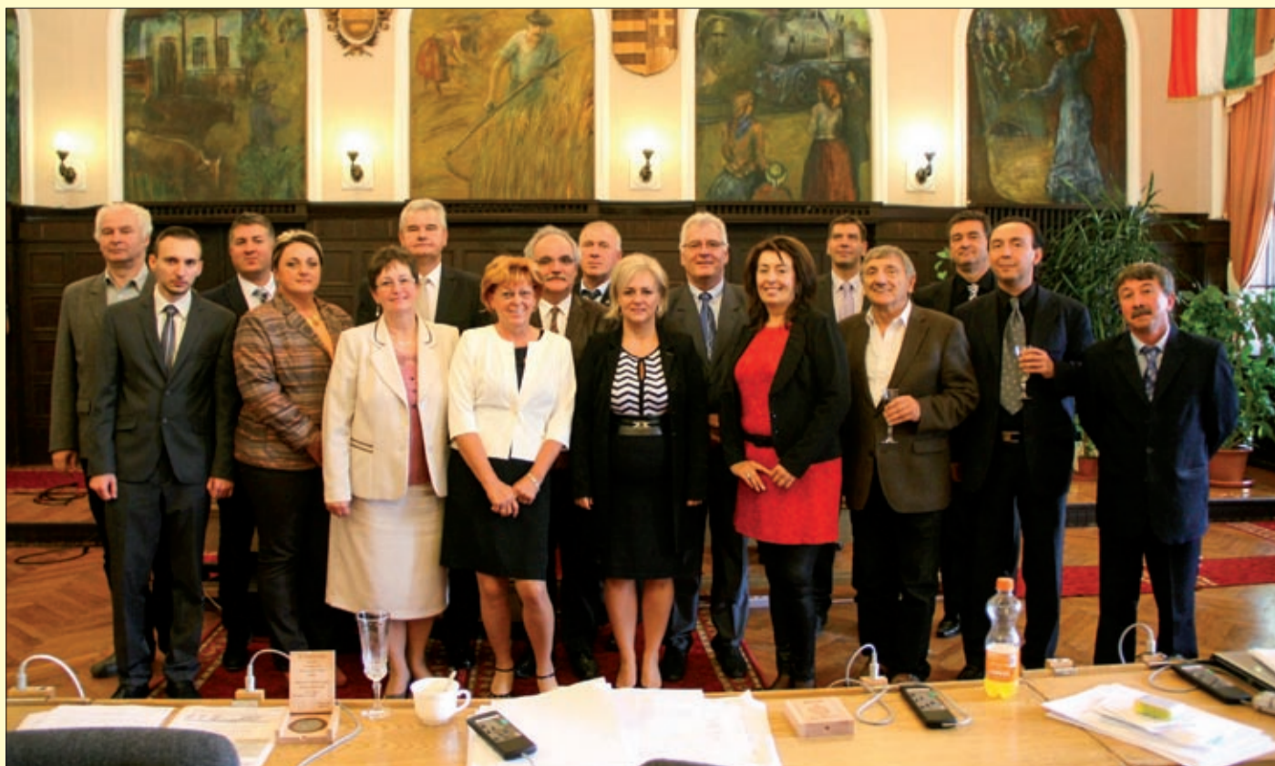
Az önkormányzati választás előtt utolsó alkalommal zajlott ebben a felállásban a közgyűlés

Leköszönt és elköszönt a 2010–2014-es ciklus képviselő-testülete