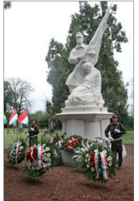
A sebesült honvédek szobra