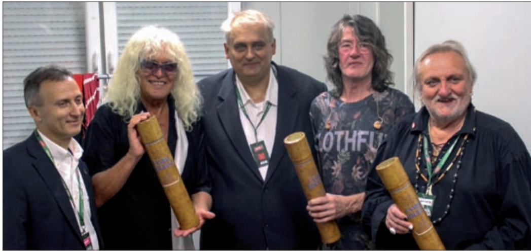
A lengyelországi Lublinban az Omega együttes tagjai is kaptak Csabai kolbászt

Az egyik legrégebbi lengyel településen, Lublinban, az Európai Nemzetközi Ízek Fesztiválján szeptemberben megkezdte közös „hódítóútját” a hungarikummá nyilvánított Csabai kolbász és az Egri bor.