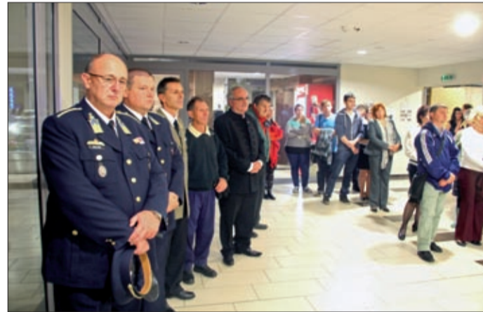
A „Magyar katona a Nagy Háborúban” kiállítás megnyitóján