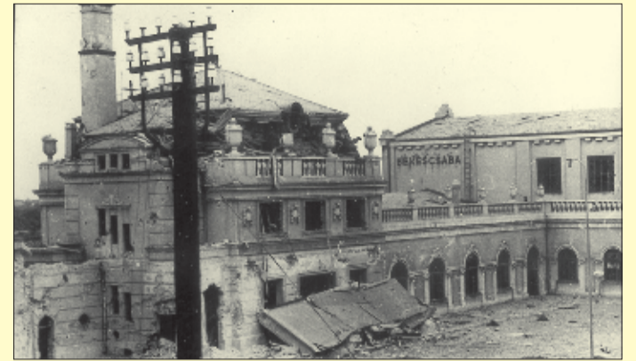
Hatszázhat bombatalálat érte az állomást és környékét

Abban az évben, szeptember 21-én, csütörtökön szinte nyáriasan szép meleg napra ébredtek a város lakói. Nem sejtve, hogy reggel 8 óra után néhány perccel Olaszország déli részén Boeing B-17-es Flying Fortress típusú nehézbombázók és kísérő vadászgépek emelkedtek a levegőbe Debrecen és Békéscsaba pályaudvarainak bombázására. A gépek 6100 méter magasságban, a felhők felett repültek végig az út nagy részét. Szarvas térségébe érve jelentősen javultak a látási viszonyok. Itt a bombázógépek kettéváltak. Kétharmaduk Debrecen felé repült, 30 bombázó és 10 kísérő vadászgép fordulatot téve, támadó alakzatba rendeződve, Békéscsaba irányába indult. Szokás szerint tíz óra után felbögtek a város szirénái. Voltak, akik az óvóhelyre húzódtak, a város lakossága azonban a megszokott átrepülésre számított csak.