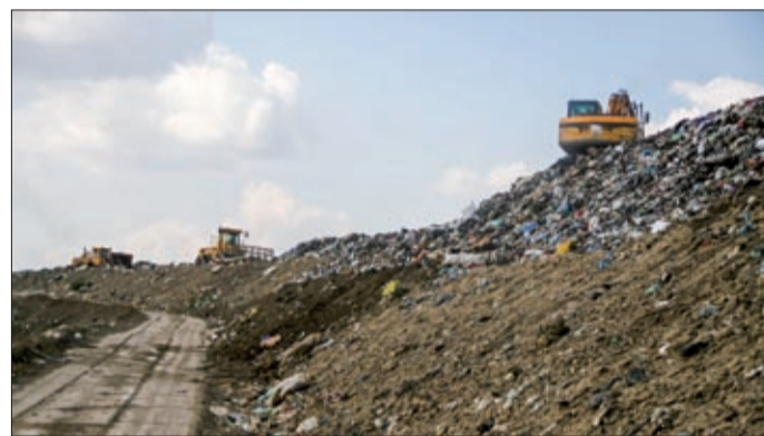
Békéscsabán évente 30-32 ezer tonna hulladék képződik

Mint megtudtuk, fél évig itt tesztelik egy elektromos hulladékgyűjtő prototípusát is. Az új kukáskocsi jelentős megtakarítást hoz, a gázolaj évi 25 millió forintos kiadása helyett mindössze 4 millió forintos villamos energiával üzemeltethető. Az autó ára sorozatgyártás esetén csak néhány millió forinttal haladna meg egy hasonló diesel jármű árát, a befektetés tehát igen hamar megtérülne.