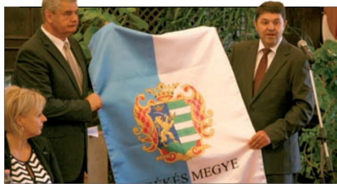
Farkas Zoltán díszzászlót adományozott a városnak

A ciklus utolsó közgyűlésére ellátogatott Farkas Zoltán, a Békés megyei közgyűlés elnöke, aki egy megyei díszzászlót hozott ajándékba. A csabai testület előtt beszélt Békéscsaba és a megye kapcsolatáról, a korábbi egyeztetésekről és a megyétől a városhoz került kiváló intézményekről. Farkas Zoltán ezután megköszönte a város segítségét, és bejelentette azt is, hogy mostantól regionális szinten végez majd területfejlesztési