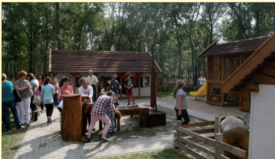
A gyerekek rögtön birtokba vették az egyedi játszóteret

sának pillanatait, amikor a kabinetben arról döntöttek, hogy a városi parkerdő területén egy szórakoztató komplexumot hozzanak létre, mely a gasztronómiai hagyományok ápolásában is szerepet kap. Hanó Miklós köszönetet mondott mindazoknak, akik a CsabaPark 1,3 milliárdos beruházásának tervezésében, kivitelezésében részt vállaltak, s azt is kiemelte, hogy már készen állnak a tervek a fesztiváldudvar kialakítására is, mely