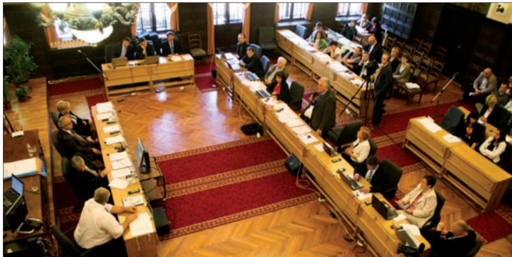
A támogatás azt is kifejezi, hogy a városnak minden kis lakosa fontos