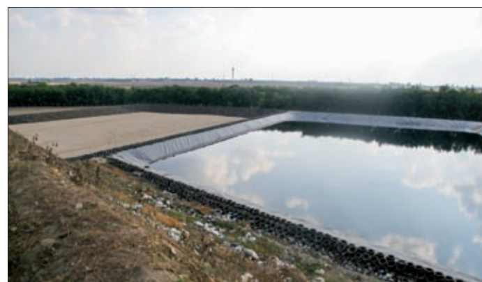
Tavasszal kezdődött a 400 milliós beruházás

Békéscsabán évente 30–32 ezer tonna hulladék képződik, a környező településekkel együtt 70 ezer tonna szemetet szállítanak ide. A korábban épített lerakó még egy évre való hulladékot tu-