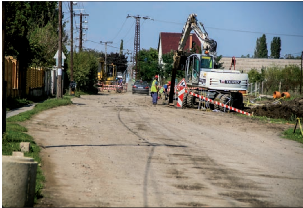
A Gyár és Kereki utca eddig nem burkolt szakaszán 5 cm vastag, 6 m széles aszfaltréteg lesz