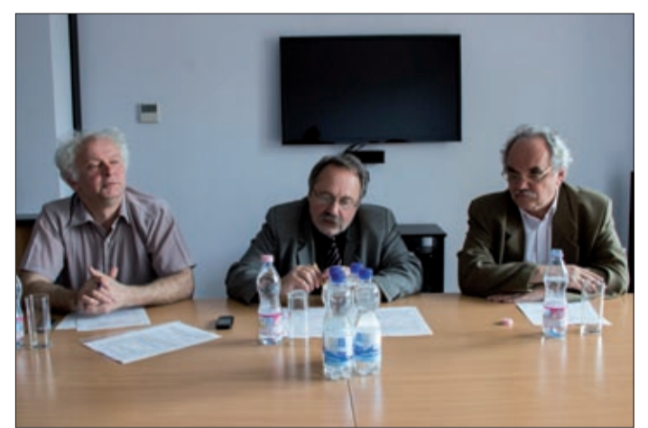
Huszonkétféle tevékenységet valósítanak meg