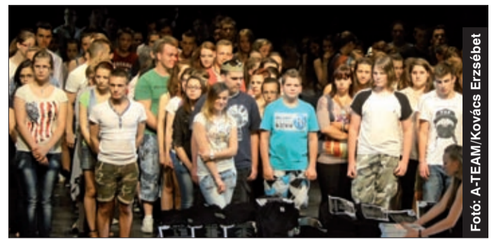
Ezúttal bibliai történeteket dolgoztak fel

A produkcióban a Békés Városi Színház Stúdiója, a Mezőberényi Petőfi Sándor Gimnázium, a Békés Megyei Hunyadi János Közoktatási Intézmény (Mezőkovácsháza), a Kemény Gábor Logisztikai és Közlekedési Szakközépiskola a Kemény Gitárklubbal, a békési Szegedi Kis István Református Gimnázium, a Belvárosi Általános Iskola és Gimnázium, a Széchenyi István Két Tanítási Nyelvű Közgazdasági Szakközép-