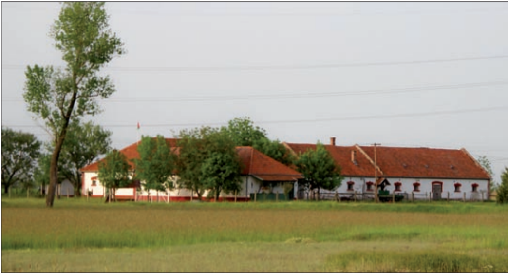
Ma közel ezer lakható tanya van Békéscsaba közigazgatási területén

Tavaly a Békéscsaba és Térsége Többcélú Önkormányzati Kistérségi Társulás a Vidékfejlesztési Minisztérium által az alföldi tanyák, valamint tanyás térségek megőrzése és fejlesztése érdekében kiírt pályázatán sikeresen szerepelt. Mindezek eredményeként a Csabagyöngye Kulturális Központ szakmai koordinálásában tanyafejlesztési programot dolgoznak ki a szakemberek a békéscsabai kistérségben. Április huszonegyedikén és huszonnegyedikén tanyafórumon kérték és várták az érintett lakosság észrevételeit, ötleteit a kulturális központ Panoráma termében, majd a mezőmegyeri Arany János Művelődési Házban.