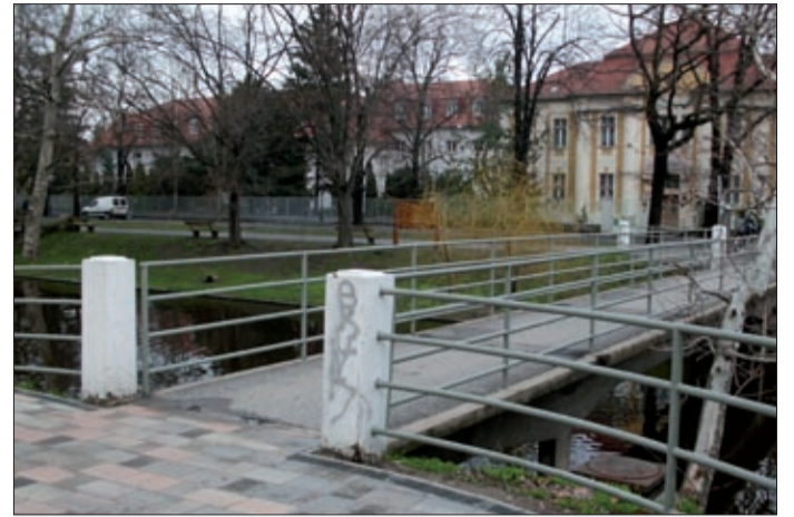
A híd hetvenhét éve szolgálja a csabaiakat