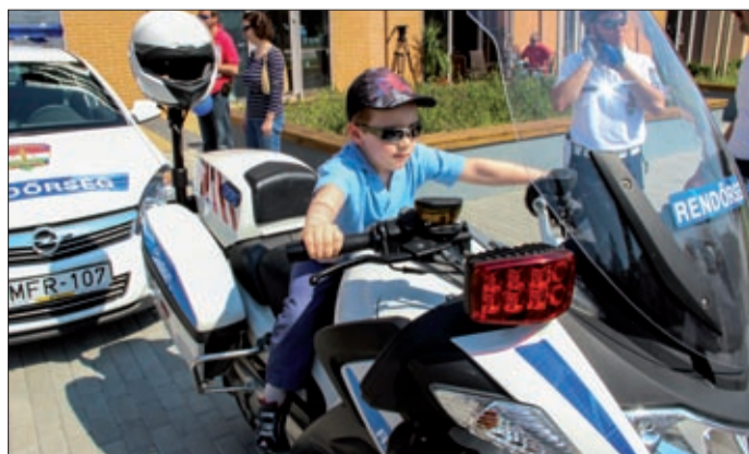
A rendőrmotorra is felpattanhattak a jövő rendőrei