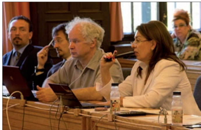
A korábban szétaprózott feladatok a BIC-ben jobban szervezhetők