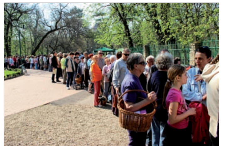
Hosszú sor kígyózott már kora délelőtt

Itt a jó idő, kezdődhet az utcai előkertek, teraszok, erkélyek szépítgetése. Ebben segít a város harmadik esztendeje az ingyenes virágosztással, melyet ezúttal április huszadikán a ligetben tartottak.