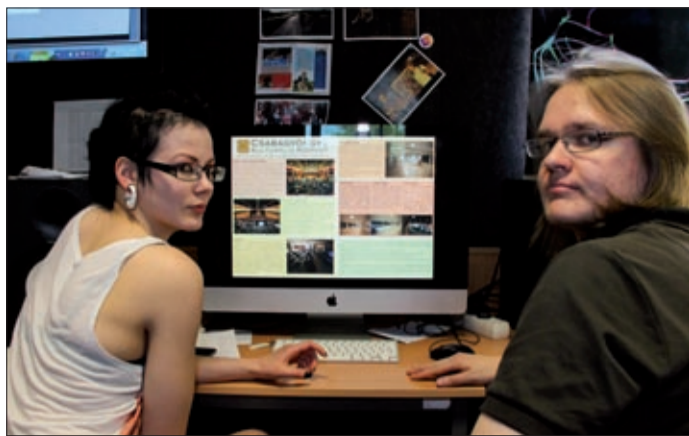
A két finn tanuló hamar megszerette Békéscsabát

A Leonardo program keretében adódott számukra lehetőség, hogy néhány héten át Magyarországon gyakorolják szakmájukat, itt szerezzenek tapasztalatokat, miközben munkájukkal segítik a vendéglátókat. A Leonardo da Vinci program az Európai Bizottság 1994-ben elindított együttműködési programja, mely a szakképzést érinti. Az 1999-ben lezárult első szakasz célja az európai uniós szakmai képzési politika megvalósítása, illetve a tagállamok szakképzési politikájának harmonizációja volt. 2000. január 1-jétől kezdődően új, hétéves szakasz vette