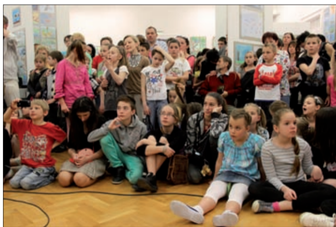
A megnyitóra az ifjú alkotók és a családjuk is eljött

Alig lehetett beférni április huszadikán a Munkácsy Mihály Múzeumban lévő Múzsák termébe. Gyerekek, szülők és pedagógusok töltötték meg a kiállítóteret, a falakat, párvánokat pedig rajzok díszítették.