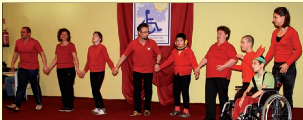
A Napraforgó központba járó gyerekek adtak műsort