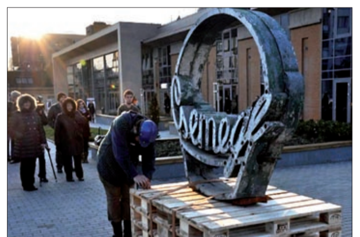
A 3T csoport tisztelgése az „etetőkosár” előtt