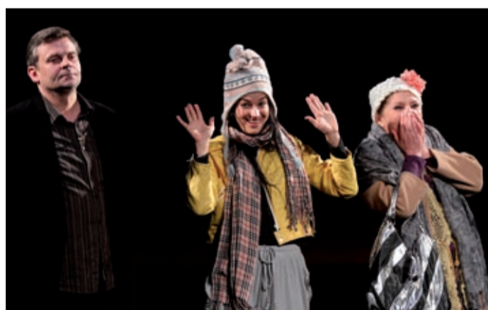
A színészeknek másfél napjuk volt a felkészülésre

A közönségdíjat, valamint a legjobb írónak járó elismerést Háy János és darabja,