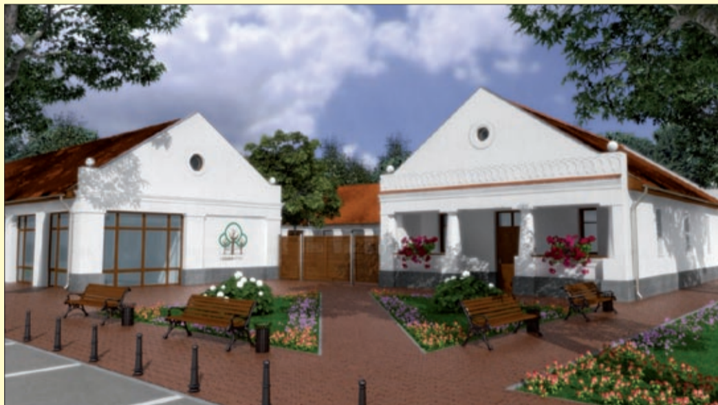
A CsabaParkban felépülő kolbászfalu lehet a Csabai kolbász egyik bázisa

A felmérések megmutatták, hogy városunkban kialakult egy kolbászkészítéssel foglalkozó, abból rendszeres jövedelmet realizáló kistermelői bázis. Jelenleg pontosan nem ismert a kolbászgártók száma. A kolbászkészítés jellemzően családi vállalkozásként működik. A regisztrált kistermelők többsége idősebb, így a (kistermelői) kolbászkészítés generációváltás küszöbén áll. A termékek minősége magas, azonban sok esetben elmarad a prémium kategóriától. Az ár a ráfordítás arányában alacsony, nem fedezi a fenntartható növekedéshez szükséges nyereségtartamot. Probléma, hogy a kolbászkészítők szinte egyáltalán nem folytatnak marketingtevékenységet, lényegében egyetlen „marketingeszközük” a kolbászfesztivál. Ez alól azok a kistermelők a