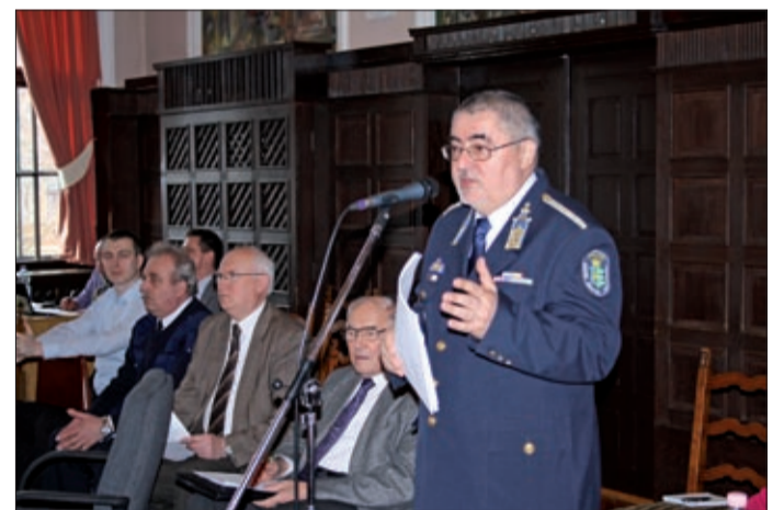
A városi kapitány válaszolt a kérdésekre is

Mint megtudtuk, a regisztrált bűncselekmények száma 3235 volt, ez a szám közel 10 százalékkal magasabb a 2011-ben regisztrált 2916 bűncselekményhez képest. A 100 ezer lakosra jutó bűncselekmények száma nőtt az előző évhez viszonyítva. Az eltérés a megváltozott statisztikai adatszolgáltatással (visszaélés okirattal, ahány irat, annyi esemény) ma-