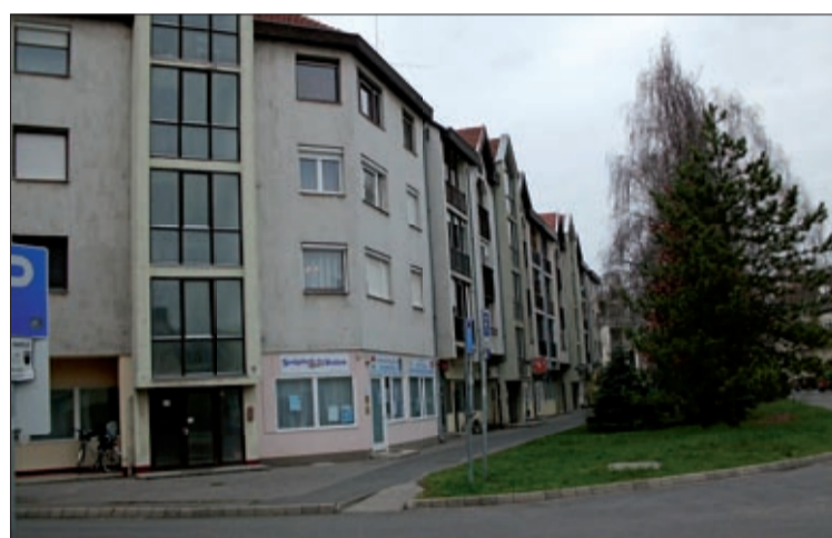
A Munkácsy utcai részlet ma

letes háza, építője Reiner borkereskedő. Építéséről feljegyezték, hogy elkészültek vették észre, az emelethez nem építettek lépcsőt. A régi emeletes ház ma is áll, homlokzata, belső