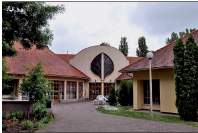
A szociális intézményekben kb. ötszázalékos az emelés

A bölcsődés gyerekek tekintetében az önkormányzat az étkezési térítési díjon felül gondozási díjat állapíthatna meg, azonban ez jelentős mértékben, havonta több mint 26 ezer forinttal növelné a kisgyermekes családok kiadásait, és sokaknál a kedvezőtlen szociális helyzet miatt nem is lehetne érvényesíteni. A testület ezért most sem állapított meg külön gondozási díjat a bölcsődés gyerekekre. Az étkezésért fizetendő térítési díj viszont – az emelkedő élelmiszerárakhoz alkalmazkodva – nő, így a bölcsődékben a korábbi napi nettó 268 forint helyett napi nettó 281 forintot kell fizetni.