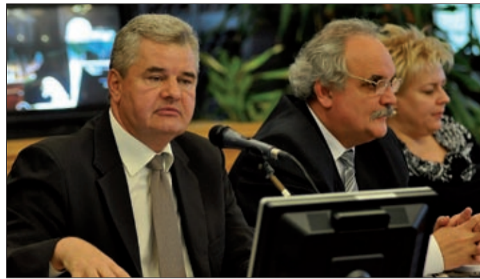
Békéscsaba több száz millió forint értékű vezetékvesztést vesz át

Az Alföldvíz idei üzleti tervéből kiderült, hogy jelentős elvárásoknak kell megfelelniük, miközben a változásokat