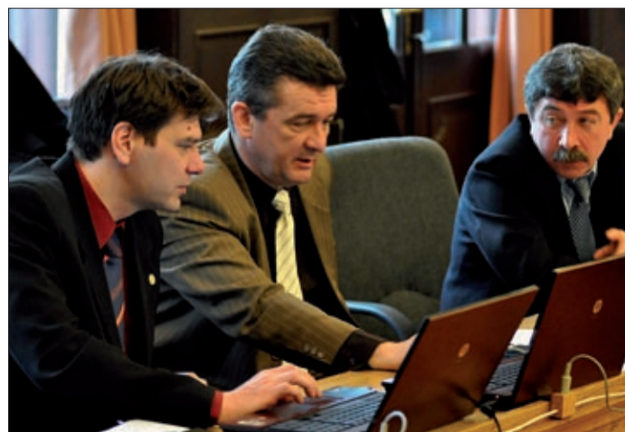
A képviselők megköszönték a helyi rendőrök munkáját