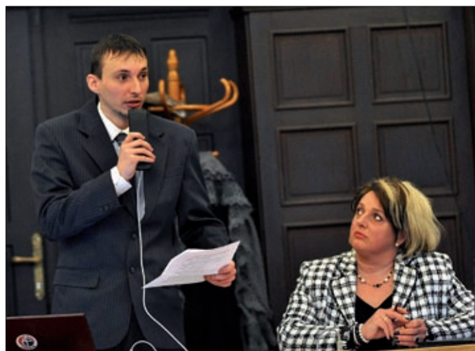
A Jobbik a kezdetektől támogatta a szabályozást

A képviselők az új helyi rendeletet elfogadták, így az a hatályba lépést követően mindenkire vonatkozik, betartását pedig mások mellett a közterület-felügyelők ellenőrzik.