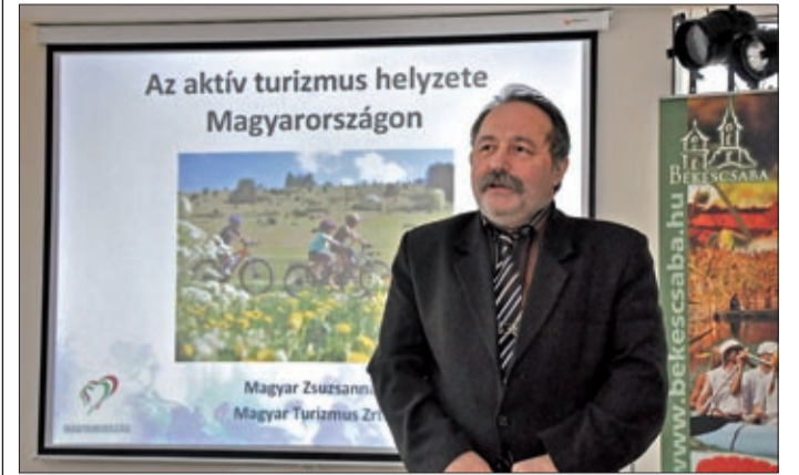
Kerékpáros-, gyalog- és vízi túrákat is ajánlottak

A Csabagyöngye Kulturális Központ és a Tourinform Iroda turisztikai konferenciára várta húshagyókedden a turisztikával foglalkozó szervezeteket, vállalkozókat, közművelődési munkatársakat és az érdeklődőket az IfiCasinoba. A konferenciát tizenegyedik alkalommal rendezték meg – a hagyományoknak megfelelően – a Csabai Farsanghoz kötődve.