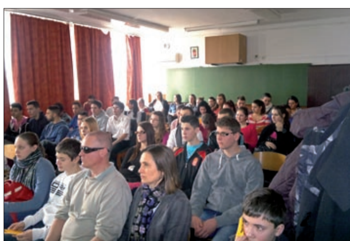
A program jól sikerült, folytatása várható

Történelemnapot tartottak február 16-án a BÉKSZI Zwack József Tagiskolájában. A hatodik alkalommal megrendezett szakmai napon nyolc történelmi témájú előadás hangzott el az iskola tanáraitól. A szervezők a történelem iránti érdeklődés felkeltésén túl az ifjúság látókörének szélesítését tűzték ki célul. A résztvevők pozitív visszajelzése megerősítették a szervezőket abban, hogy a jövőben is érdemes hasonló rendezvényeket tartani.