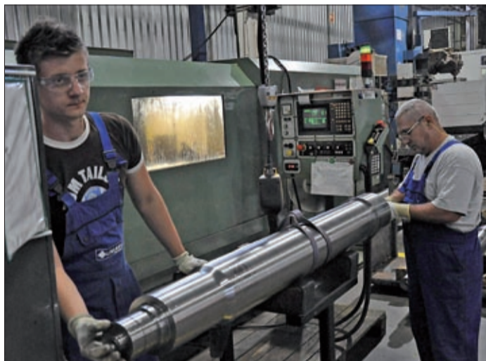
Szigorú minőségi elvárásoknak kell megfelelni