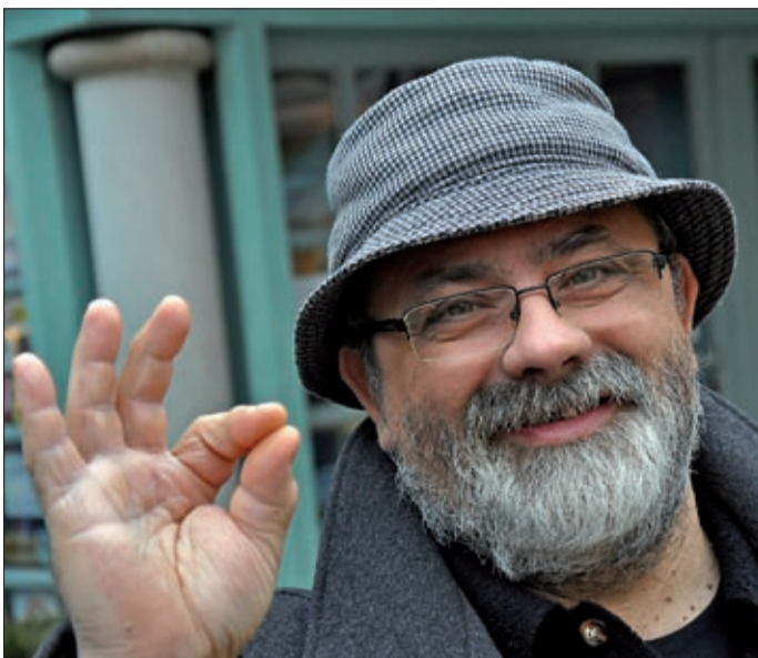
Máshol nem található izek is vannak nálunk

– 1991 Mikulása előtt jöttünk át. A feleségem Csorvásra származik, és amikor a háború a Vajdaságot is elérte, úgy döntöttünk, hogy mi inkább nem harcolunk más háborújában. Közel laktunk a laktanyához, féltettem a családomat, a gyerekeimet, így aztán útra keltünk. Szabadkán volt egy Speed Burgerünk, úgy döntöttünk, hogy ha már ehhez értünk, akkor Békéscsabán is egy ilyen üzletet nyitunk.