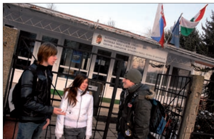
A szlovák iskola utcáját Dedinszky Gyuláról nevezik el

A Magyar Tudományos Akadémia állásfoglalását az alábbi nevekkkel kapcsolatban kéri a város: Lipták András utca, Rajk László utca, Somogyi Béla utca, Stromfeld Aurél utca, Úttörő utca, Botyánszki Pálné utca, Dobos István utca.