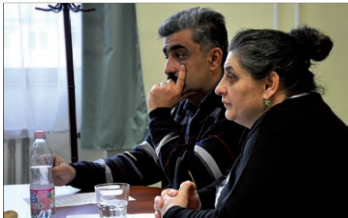
A közfoglalkoztatásról is szó volt az ülésen

A roma nemzetiségi önkormányzat ülésén a képviselők elfogadták a 2013-as költségvetést, a tavalyi pénzügyi és tartalmi beszámolót, az ideai munkatervet, valamint a Csabagyöngye Kulturális Központtal való együttműködési megállapodást.