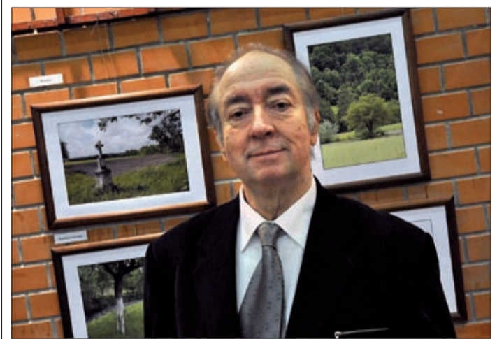
Minden fotó egy történet, minden történet egy mese