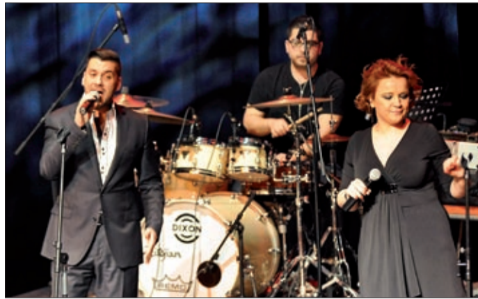
Kökény Attila és Náray Erika a színpadon

Kellemesen csalódhattak azok a férfiak, akik cukormáztól ragacsos „élményekre” számítottak február 13-án a Csabagyöngyében. A szerelmesek napja előestéjén megrendezett koncertre ugyanis ez legkevésbé sem volt jellemző.