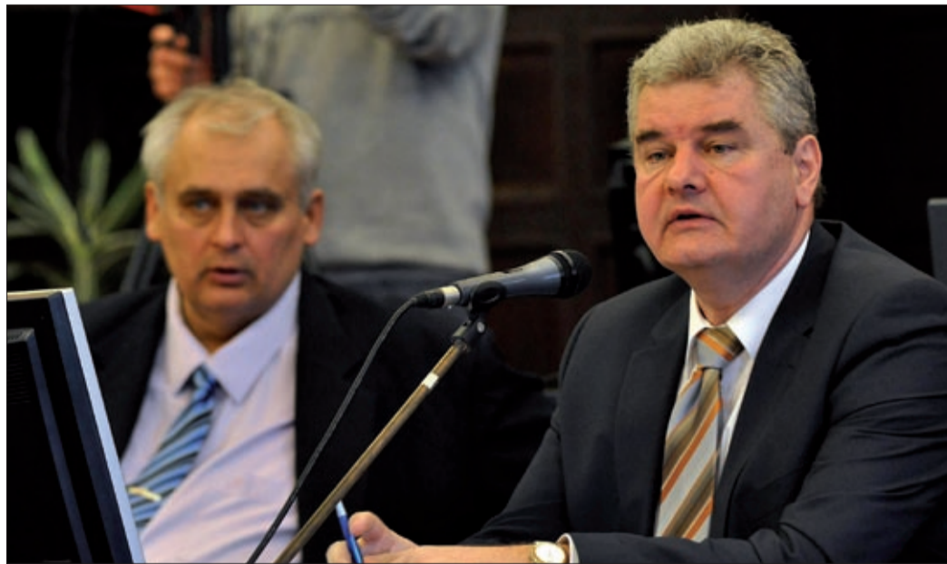
A városvezetés kiemelten kezeli a foglalkoztatás kérdését Békéscsabán

Kétségtelenül jó hír, hogy 2013-ban is több közfoglalkoztatási program megvalósítására is lehetőség lesz Békéscsabán. Az erről szóló előterjesztést is a közgyűlésen fogadták el a képviselők.