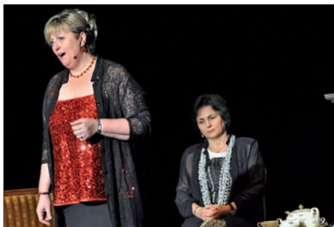
Színt vittek a szürke hétköznapokba