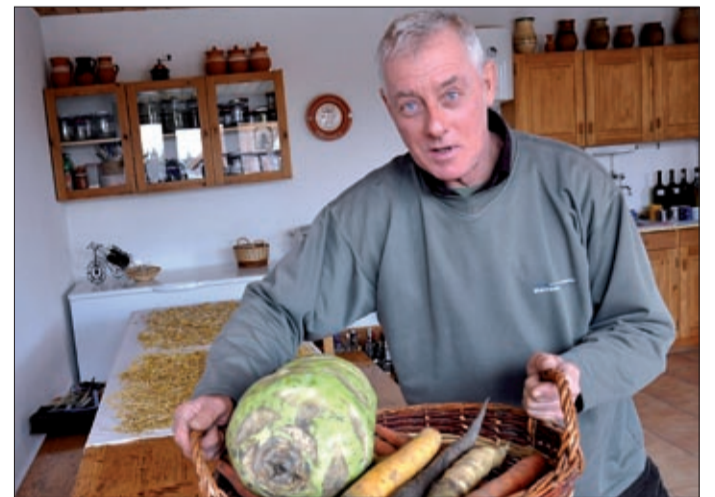
Ha hiszik, ha nem, az a nagy zöld egy karalábé

– Úgy 25 éve vettem portát Fényesen, és szép lassan fejlesztettem a zöldségeskertet. Egy magbörzén összehozott az élet egy holland családi vállalkozásból kinövő