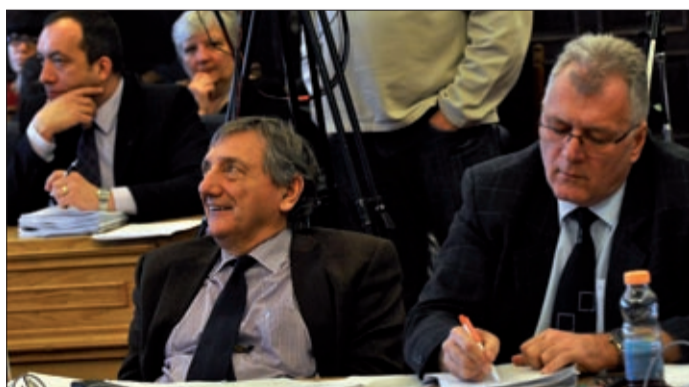
A rendelettervezetet még finomítják

tervezet letölthető Békéscsaba honlapjáról (bekescsaba.hu), és lapunk következő, március 14-én megjelenő számában is közzétesszük.