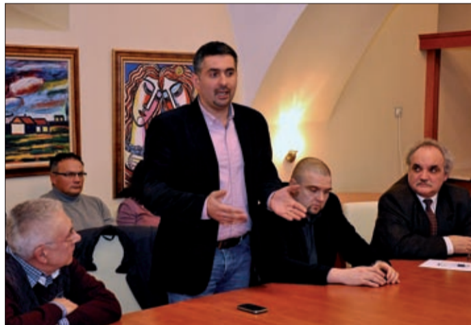
Az érintetteket a Mokos teremben tájékoztatták