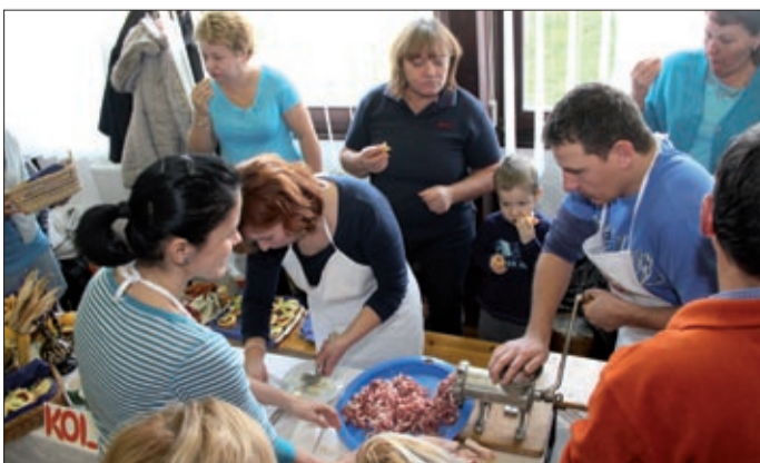
A lakótelep közösségei töltötték a kolbászt