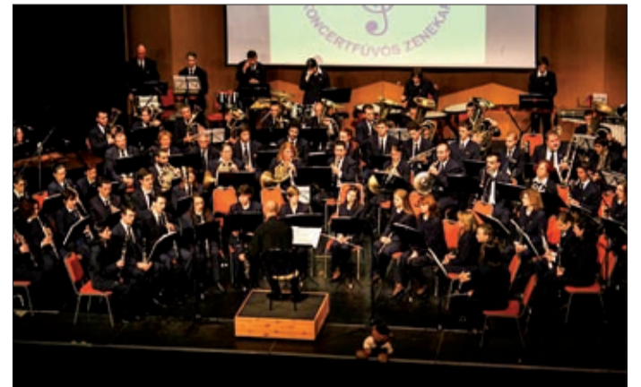
A jubileum alkalmával nagy sikerű hangversenyt adtak a Pécsi Vasutas Koncert Fúvószenekar közreműködésével