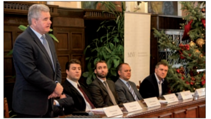
A szakmai esemény megnyitója

A Magyar Nemzeti Vagyonkezelő (MNV) Zrt. Országos Vagyongazdálkodási Roadshow-t indított, amelynek keretében december tizenegyedikén a békéscsabai városházán találkoztak a szakemberek.