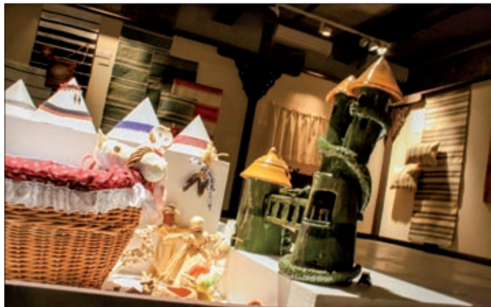
A kis kézművesek éppolyan ügyesek, mint a nagyok

Tizedik alkalommal rendezték meg a gyermek és ifjúsági népi kézművespályázat alkotásait felvonultató tárlatot, amelynek idén is a Munkácsy Mihály Múzeum ad otthont. A díjátadás és a megnyitó – ahol a várost Kiss Tibor alpolgármester képviselte – advent második vasárnapjának délelőttjén volt a múzeum Tégla termében.