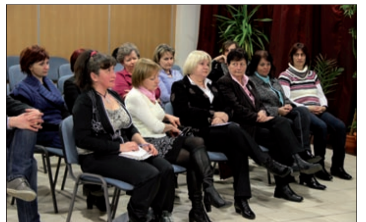
A Csabagyöngye továbbra is számít az önkéntesekre

Egy húszfős, civilekből álló kis csapat segíti jelenleg is a Csabagyöngyében dolgozók munkáját. A lelkes önkénteseket december tizenegyedikén köszöntötték a kulturális központ munkatársai.