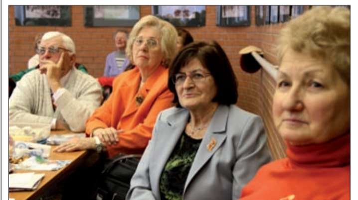
Az idősek körében népszerűek az előadások, kirándulások

Idén ünnepli működésének harmincéves jubileumát a Lencsési Községi Ház Nyugdíjas Klubja. A jubileum kapcsán egész héten át tartó programsorozatot tartottak.