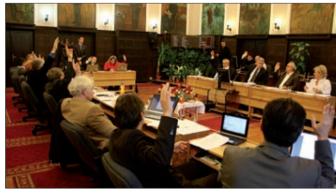
Péntek 13-án kézzel szavaztak: elromlott a szavazógép

A közgyűlés idei utolsó ülésén döntött több utca és közterület át-, illetve elnevezéséről.