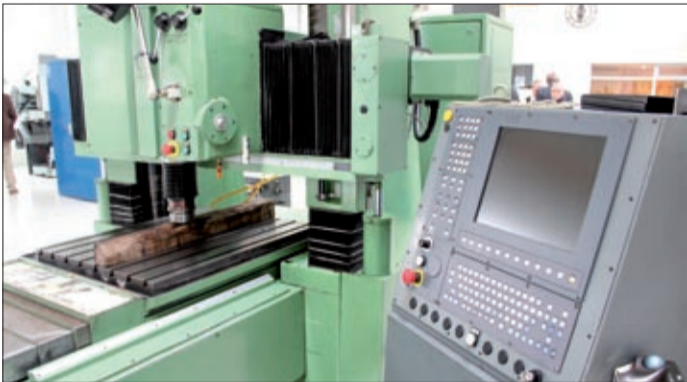
A csarnokban korszerű gépekkel dolgoznak