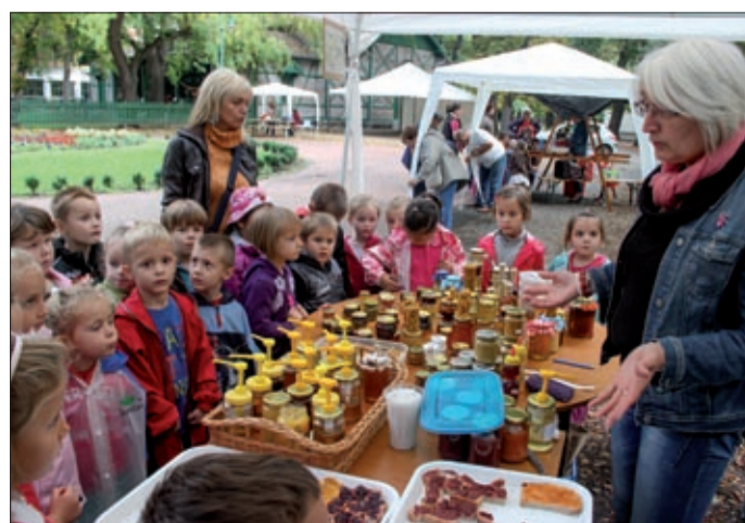
A gyerekek kíváncsian barangoltak a liget standjai közt