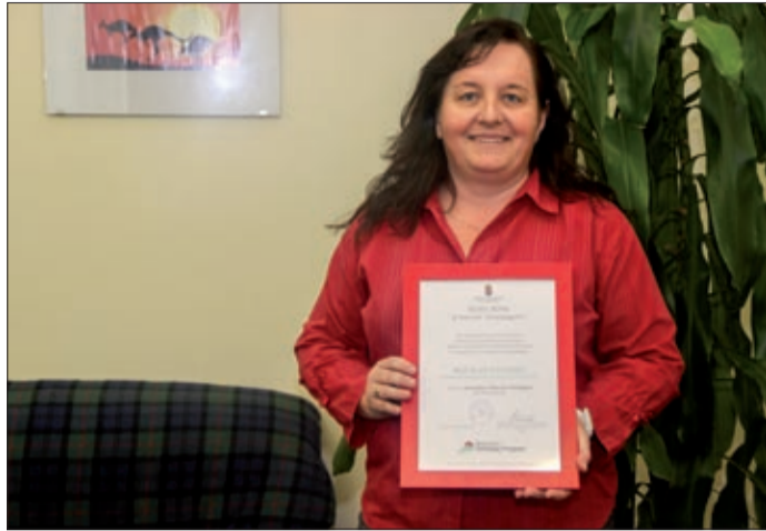
Tavaly egy versenyen ő lett a legjobb felkészítő

második helyezéssel tért haza a megmérettetésről.