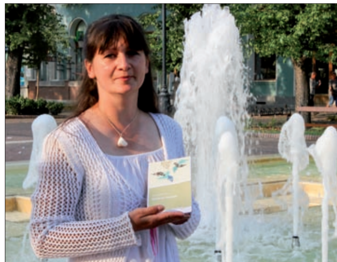
Most gyerekverseket ír a szerző