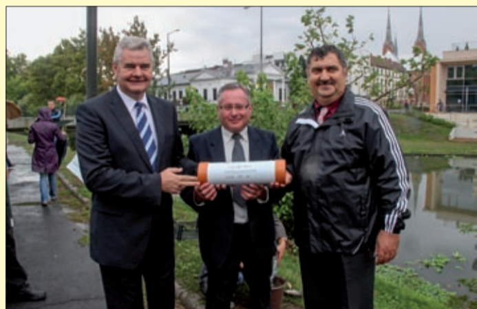
Bár nem közlekedik majd, de itt lesz a kisvasút