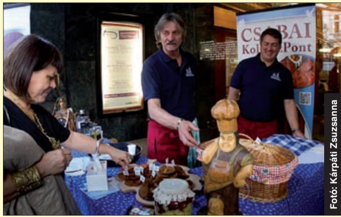
A fesztiválon nagy sikerük volt a csabai ízeknek

A Jókai színház nagy sikerrel, igazi utcai happeninggel szerepelt Budapesten. Az „Egy békés, csabai színházi nap” című rendezvény már