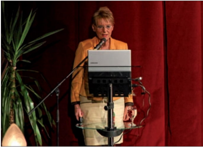
Tanévkezdő-konferencia vendége volt az államtitkár

Hoffmann Rózsa szólt arról a hároméves munkáról, amelyet eddig tett a kormányzat. Elmondta, hogy az intézkedések az ország megújulására irányulnak, amelyek célja a gyermekek és fiatalok fejlődésének előtérbe kerülése, a családok és Magyarország jóléte, a nevelés megújulása, az igazságosság és az egyenlőség, valamint a gazdaságosság. A megújulás főbb állomásai között említette a