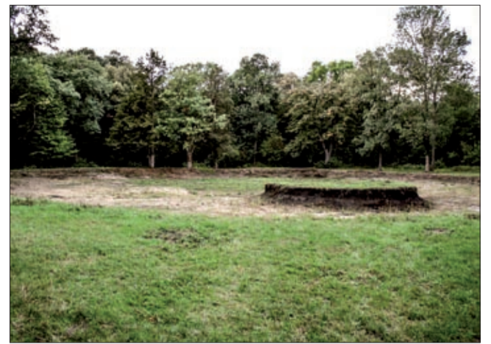
Helyreállítják a kiszáradt tavat, növényeket telepítenek

A 2150 négyzetméteres, jelenleg kiszáradt tavat is helyreállítják, ezzel megvalósul a fejlesztés legnagyobb attrakciója. A tó helyreállítása jelentős hatással lesz a park mikroklímájára és számos élőhely kialakulására, s a jövőben az idelátogatók csónakázhatnak is a vízfel-