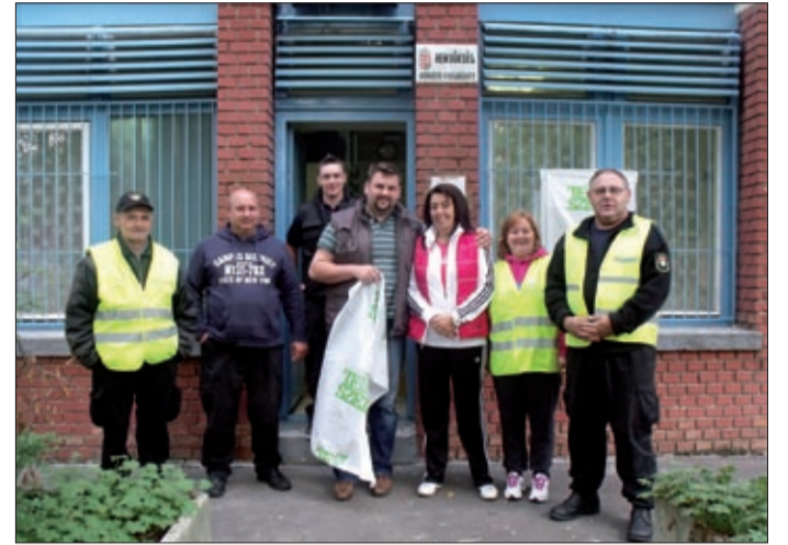
A lelkes szervezők sok embert vontak be az akcióba