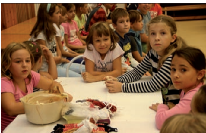
A gyerekek kézműves játszóházban alkothattak