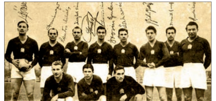
Az Aranycsapat az angliai 6:3 után

A kezdés után azonnal Csepreginek kellett rávetődéssel menteni Csordás elől. A válogatott csatársa vezetett szép támadásait. Puskás villámgyors kiugrással megszerezte az első gólt. Besztráltak a hazaiak, Grosicsnak nem akadt védenivalója. Ismét Puskás volt eredményes, 2:0. A 30. percben Zakariás