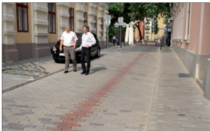
A Justh Gyula utca burkolatát is ebből újították fel

A Szent István téren és az Andrássy úton, a belváros felújítása miatt felszedett burkolóköveket újrahasznosítja a város. A közel 8200 négyzetméternyi anyagot közterületek újraburkolásához, iskolák, óvodák és más városi intézmények járdáinak, udvarainak szepítéséhez ajánlotta fel a város vezetése, az önkormányzati képviselők javaslatait figyelembe véve.