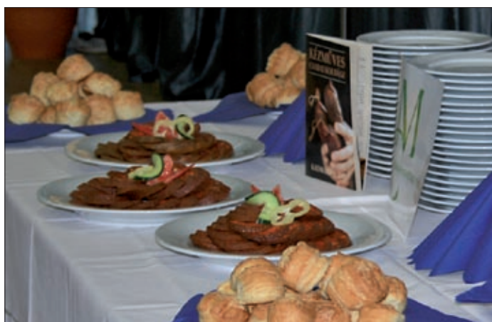
A csabai asztaláról nem hiányozhat a kolbász