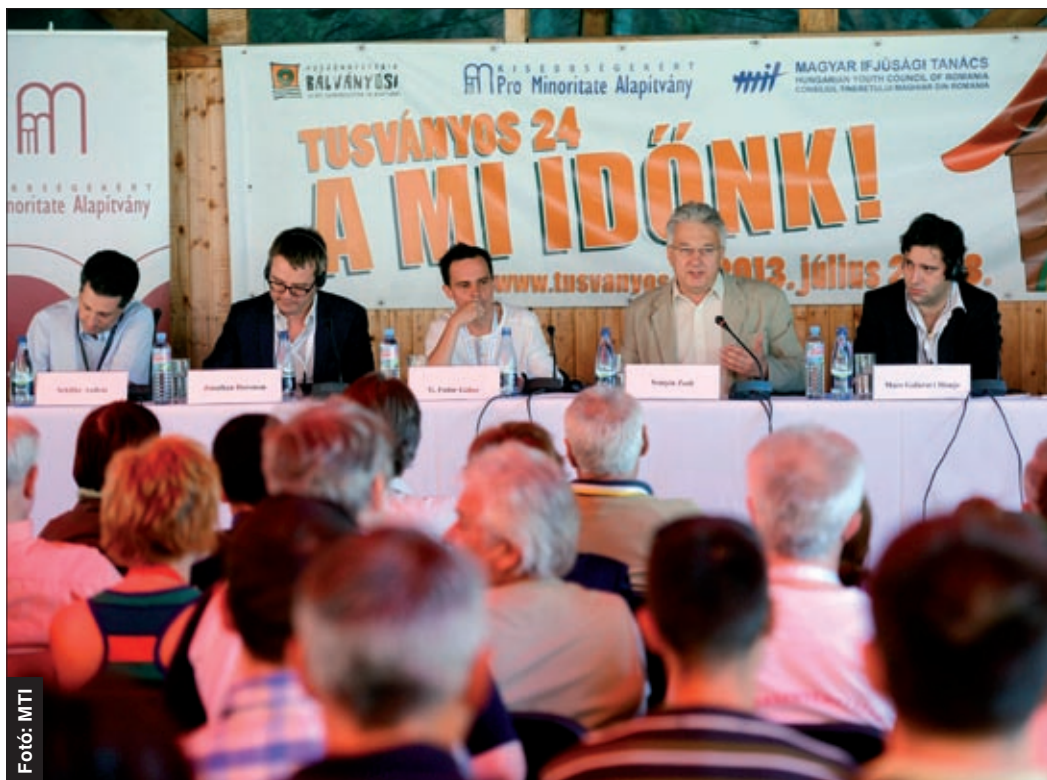
A tusványosi szabadegetemen is téma volt a határon túliak választójoga

A kormányzat várakozásai szerint az év végére eléri az 500 ezret az állampolgársági esküt tett határon túli magyarok száma, akik választójogot kapnak a 2014-es parlamenti választásokon. A Helyi Témának nyilatkozó szakember szerint a honosított szavazók nem befolyásolják érdemben a hazai választásokat.