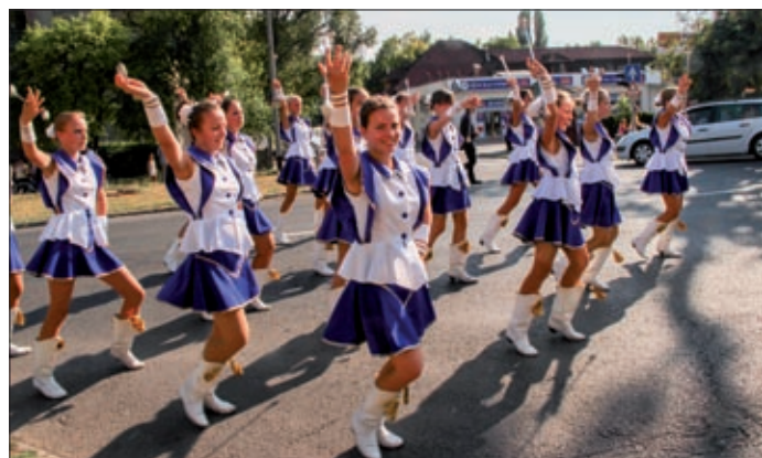
Mazsorették látványos felvonulása a Lencsésin