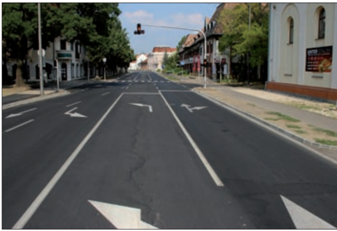
A Luther utcán is látványos a változás

A forgalmi rend oly módon változott meg, hogy a folyamatos haladás biztosított legyen. Ennek érdekében, ahol lehetett, külön forgalmi sávokat alakítottak ki a csatlakozó utcákba befordulni szándékozók számára, de néhány kanyarodási lehetőség megszűnik. A Gyóni Géza utca a Luther utca felől a Csaba Centerhez vezető útig egyirányú lett.