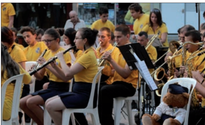
A Körös-parti Vasutas Koncert Fúvószenekar a kabalával