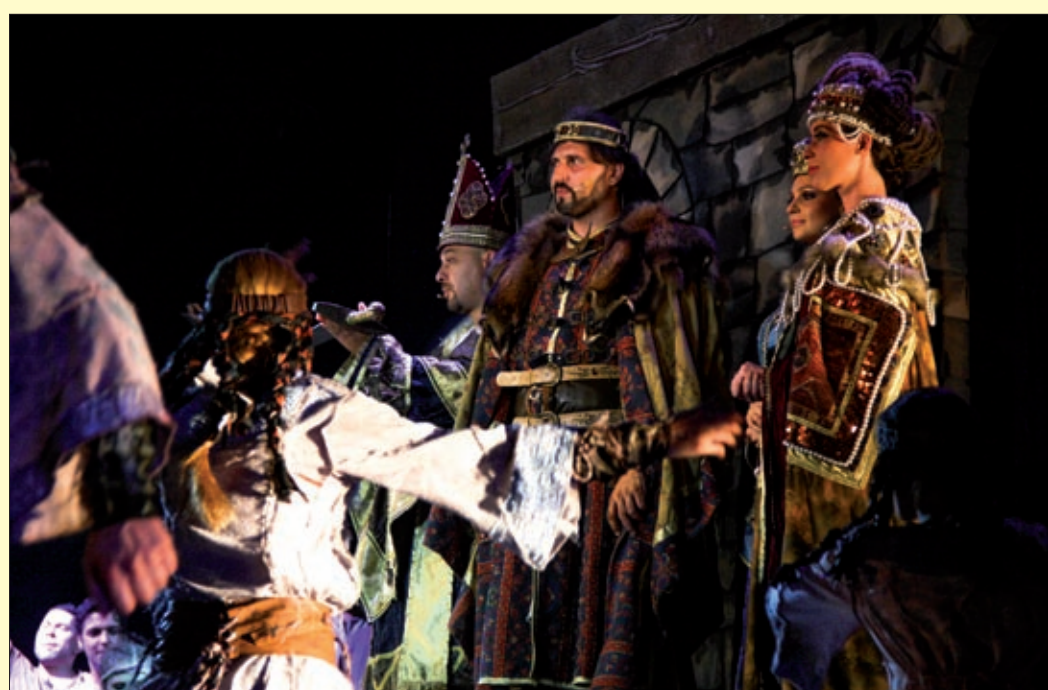
Harminc évvel az ősbemutató után Békéscsabán láthattuk az István, a királyt