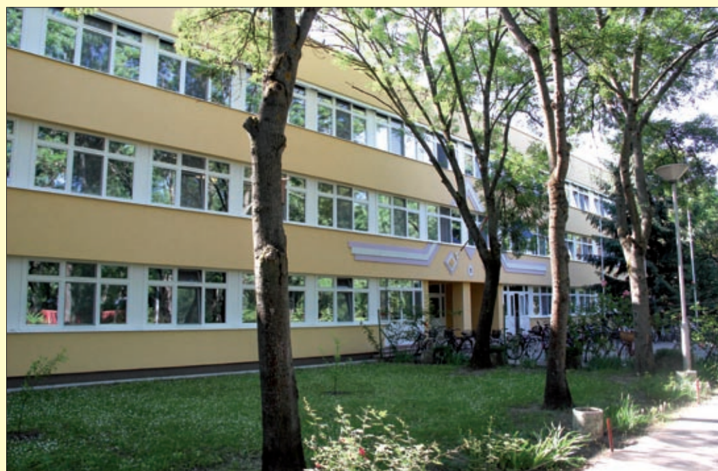
Szeptember másodikán Békéscsaba iskoláiban is becsengetnek