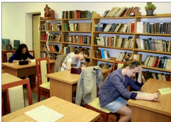
Vetélkedőn bizonyították tudásukat a diákok

A projekt az Európai Unió támogatásával, az Európai Szociális Alap társfinanszírozásával valósul meg.