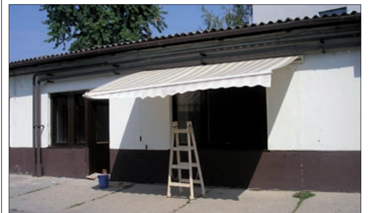
Az Inkubátorház vállalkozói udvarában lesz a bolt