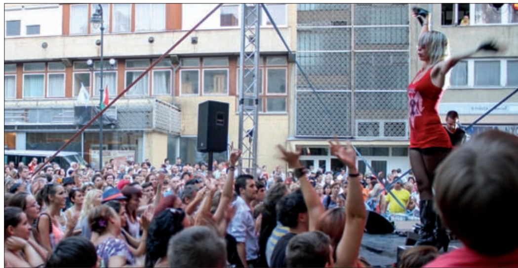
Délután a Péterfy Bori & Love Band koncert is nagy sikert aratott