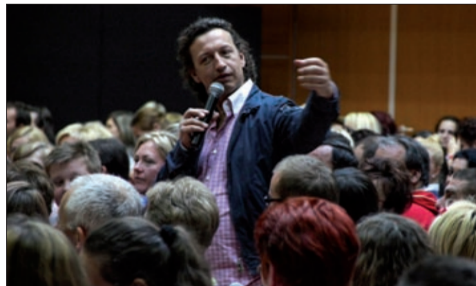
„Sokszor egyszerűbbnek tűnik mást hibáztatni”

Van olyan, amit szégyell elmondani a párjának? – kérdezte dr. Csernus Imre egy önként jelentkezőtől több száz ember előtt. – Igen – válaszolta kicsit megszeppelve a nő. – És mi az? – folytatta a faggatózást Csernus, aztán a nő szabadkozására megváltoztatta a kérdést.