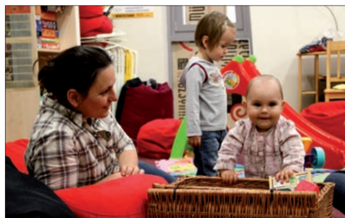
A gyereknapon a legkisebbek is jól érezték magukat

Amikor először gondolunk arra, mi lesz, ha gyermekünk születik, általában olyan idilli állapotot látunk magunk előtt, amelyben minden tökéletes. Ha a gyermek a valóságban is megérkezik, hamar rádöbbenünk, hogy időnként mindnyájan hibákat követünk el. Ha azonban ott vagyunk a gyermekeinknek, ha szeretjük és elég jól neveljük őket, emellett még a közös élmé-