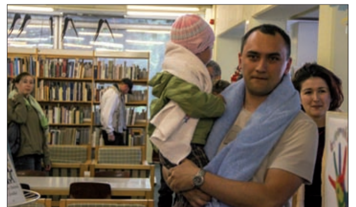
A törülköző a leghasznosabb a csillagközi stopposoknak