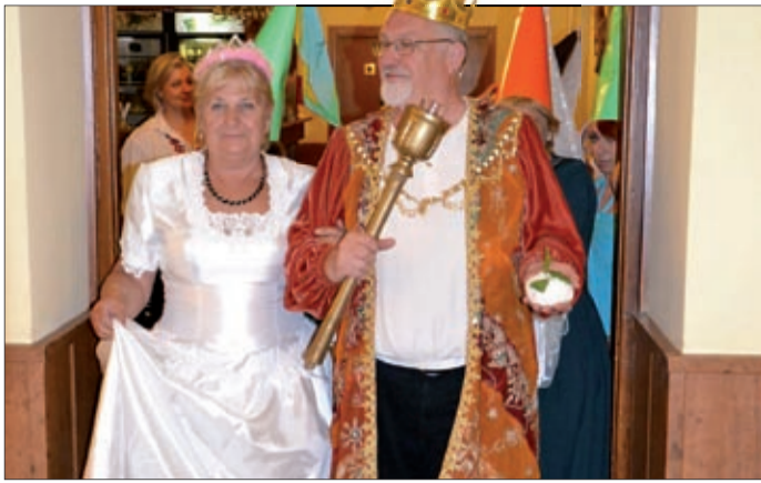
A pünkösdi király és királyné a ceremónián