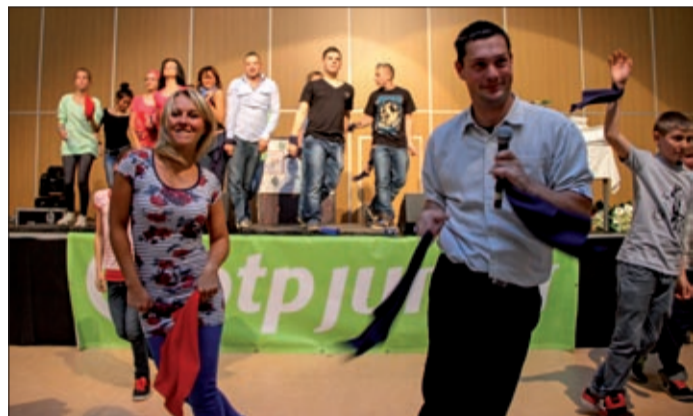
A koreográfiát a Nyíri Lajos Táncsport Egyesület tanította be