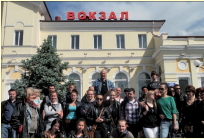
A színház hetvenfős csapatának egy része