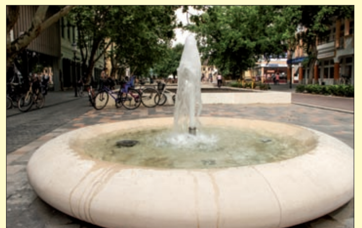
Az újdonságokat már a próbaüzem alatt is sokan fotózták