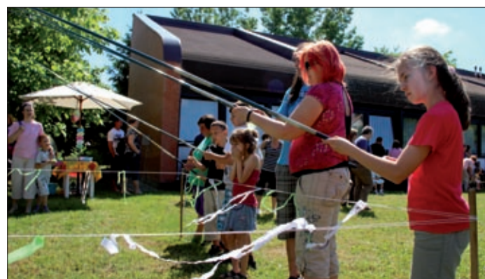
A gyermeknap előzetesét 1991 óta rendezi meg a ház