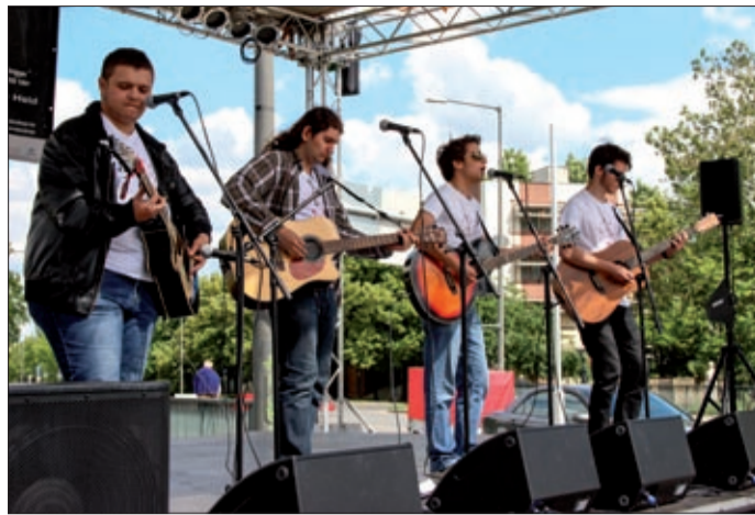
A Kemény Mag volt az egyik fellépő a Kemény Gitárklubból