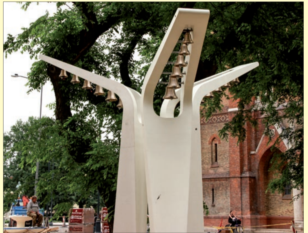
A harangjáték már áll a katolikus templom közelében

Az utóbbi időben rohamtempóban változik a belváros képe. Alig pár napja még terelőszalagokat kerülgetve néztük, hogy éppen merre lehet menni, mostanra viszont már szinte kész a burkolat, padokat, kerékpártárolókat tettek le, növényeket telepítettek, áll a harangjáték és a szökőkutakat is próbálgatják.