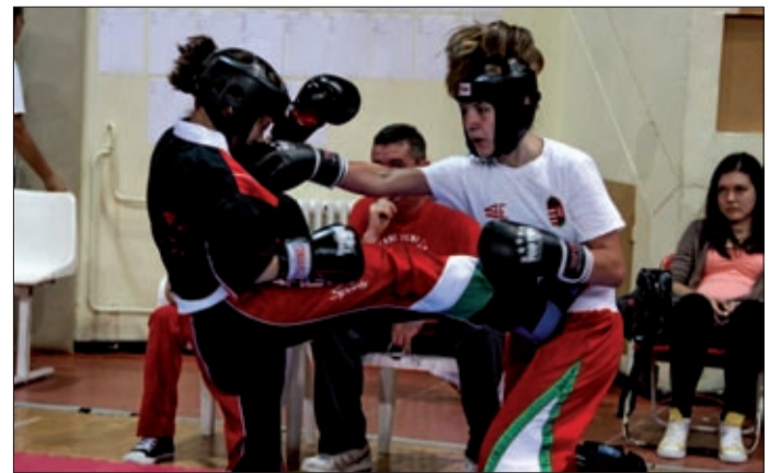
Komoly küzdelmek zajlottak a sportcsarnokban

A diákolimpián húsz klub képviseltette magát, Esztergomtól, Budapesten és