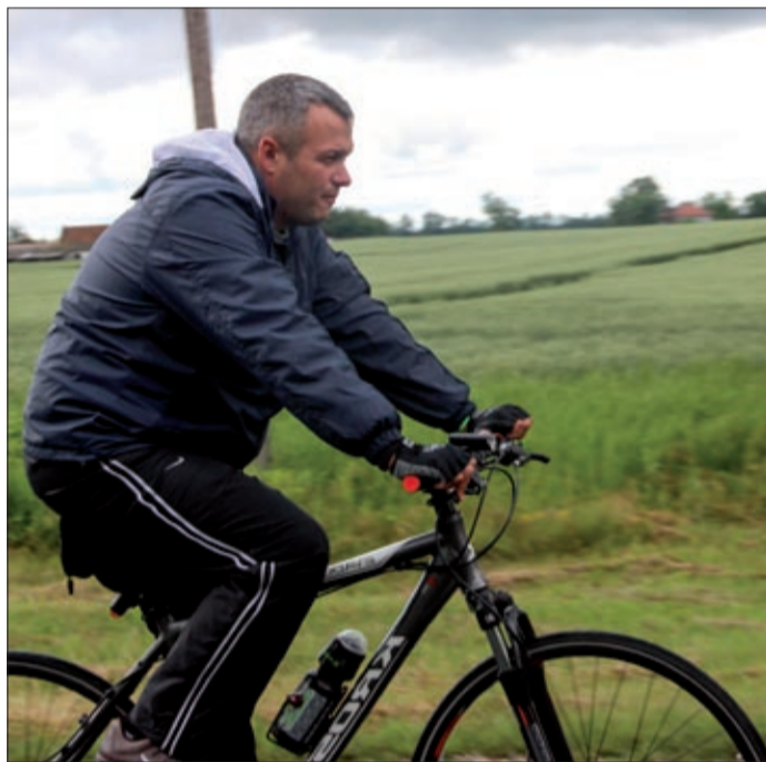
A csaknem 76 km hosszú nyomvonal a magyar oldalon Köröstarcsát, Mezőberényt, Békést, Dobozt és Gyulát érinti

Elkészült a magyar-román bicikliút terve