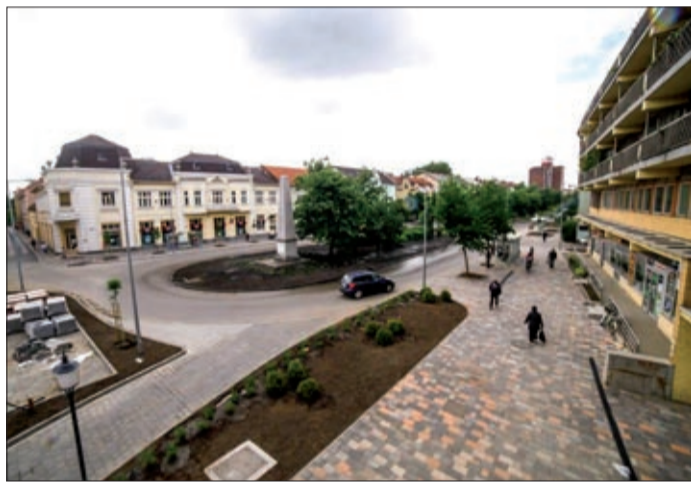
A Szabadság tér, Andrásy út sarkán is lesz térfelügyelő

A rendszer kezelője a közterület-felügyelet lesz, a diszpécserközpont helye pedig a polgármesteri hivatal. A kamerák elhelyezéséről természetesen a rendőrséget is tájékoztatják, hiszen a jövőben az így elkészült felvételek az adatvédelmi szabályok betartásával elsősorban a nyomozásokat segíthetik majd.