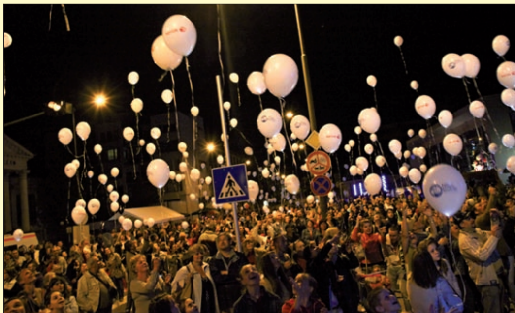
Világítottak a lufik, hogy jelezzék a hazafelé vezető utat