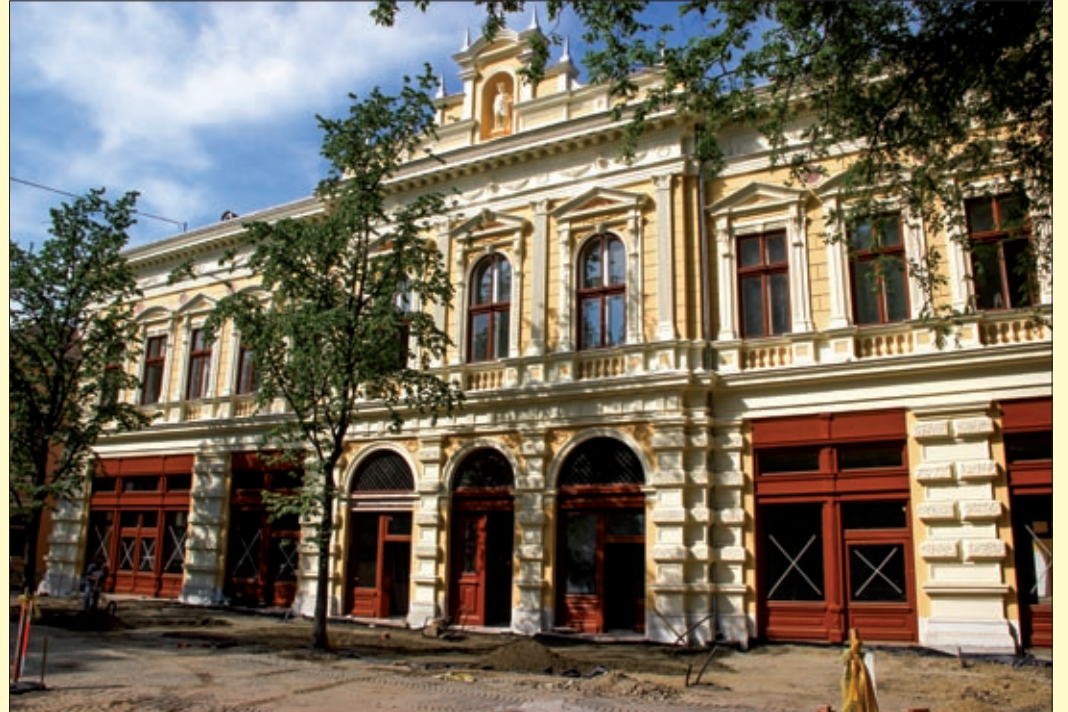
A Szent István tér 10. számú épület homlokzata a régi fényében pompázik