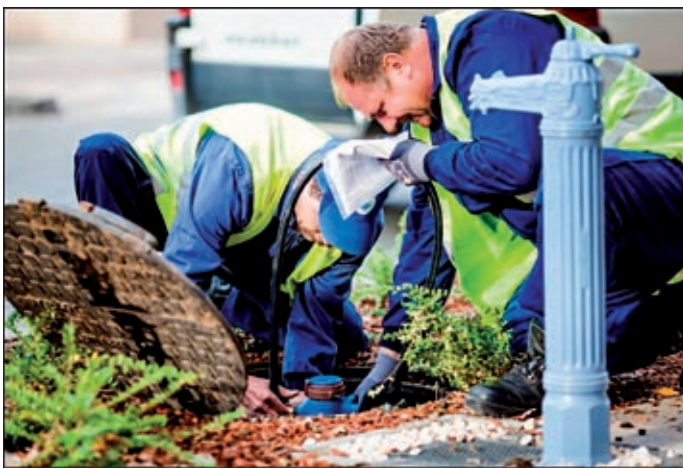
Az Alföldvíz Zrt. őszeszokott kollektívával dolgozik

Tevékenységének ugyan csak fontos eleme a szolgáltatott ivóvíz minőségének folyamatos ellenőrzése