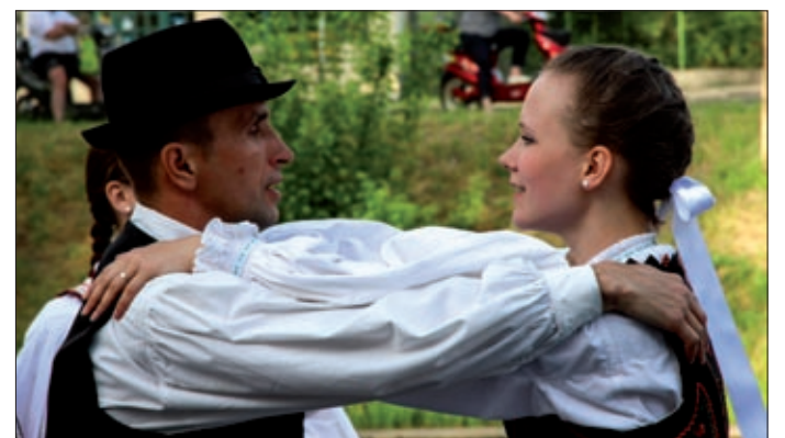
Ezúttal a Csabagyöngye stégszínpadán is ropták

Szavak nélkül, a test, a lélek, az érzelmek nyelvén mondtak el történeteket, villantottak fel vidám, andalító vagy éppen megindító pillanatok a IV. Békéscsabai Táncfesztivál és 19. Táncgála résztvevői május első hétvégéjén a Csabagyöngye Kulturális Központban. A ragyogó időben még egy gyönyörű, új helyszínnel is megismerkedtünk: a táncosok felavatták a stégszínpadot.