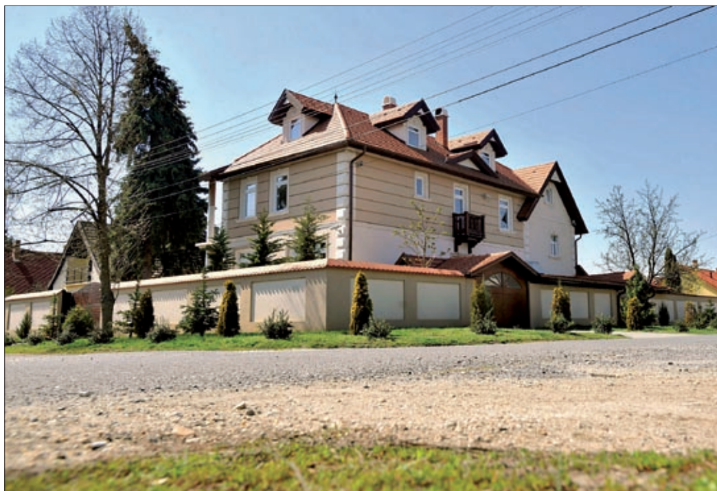
Az agárdi fényevők családi böjtje egy kisfiú halálához vezetett

Fényevők, pránaevők – ők azok, akik saját akaratukból nem vesznek magukhoz szilárd táplálékot, és folyadékot is csak ritkán. „A 21 napos folyamat lényege nem a böjtölés, hanem, hogy magasabb rezgésszintekre hangolódjunk rá, melyek lehetővé teszik számunkra, hogy a kozmikus fény tartson életben bennünket. Az evés és ivás iránti vágyak régi, megrögzött szokásokból erednek, s nem a test igénye” – foglalja össze a lényegét Ellen Greve, más néven Jasmuheen, aki könyvet írt arról, hogy 21 nap alatt hogyan lehet végleg elhagyni a táplálékot. Az asszony azt állítja, 1990 óta nem eszik, de komolyabb orvosi vizsgálatoknak, megfigyeléseknek soha nem vetette alá magát. Németországban több éhenhalásos esetet az ő szám-