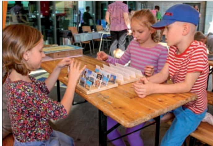
A gyerekek sok mindent kipróbáltak az Európa-napon