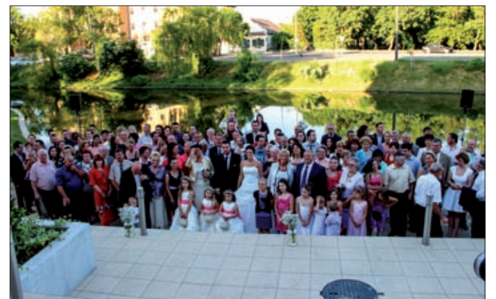
A kulturális központ esküvői helyszíneként is bemutatkozott

A Békéscsabai Evangélikus Gimnázium, Művészeti Szak-középiskola, Kollégium és Alapfokú Művészetoktatási Intézmény