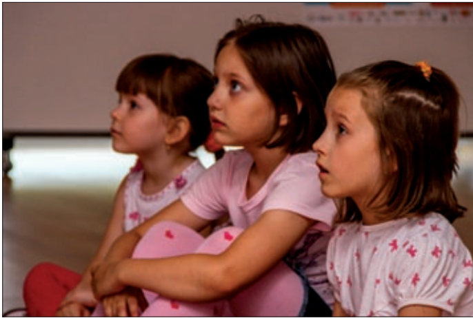
A Csaba betyár és a birka gyerekrajzokból készült

A csabai vetítések két helyszínen zajlottak. A Panoráma terem programjában az ügynevezett egész estés filmek, a Csingiling – A szárnyak titka és a Mézengúz