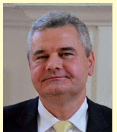
A város és a megye lakosait is szívesen látjuk

A polgármester érdeklődésünkre azt is elmondta, hogy a rendezvénysorozat összeállításánál az elsődleges cél az volt, hogy a megújult főtér minden lakos részére rendelkezésre álljon. A szervezők remélik, hogy a kulturális, szórakoztató, sport- és közösségi programok idevonzzák az embereket, akik szívesen töltik majd szabad idejüket a megszépült belvárosban, amely városi ünnepek helyszíne is lesz. A nyári hónapokban rendszeresen tartanak a főtéren és környékén gyermek- és családi programokat, bábszínházi, színházi előadásokat, de láthatunk musicalt is. Vannak belépős rendezvények, de az előadá-