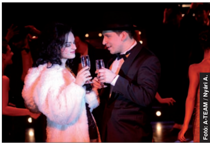
A Jókai színház és az ExperiDance közös produkciója

Ismét egy fergeteges, több művészeti ágat összekapcsoló produkció mutatkozott be Békéscsabán, a Jókai Porondszínházban, a városközpontban, az evangélikus kistemplom mögött felállított cirkuszátorban. Szomor György rendező és Román Sándor koreográfus Frank Sinatra életéről szóló, cirkuszi elemekkel is tűzdelt, látványos musicalshow-t állított színpadra.