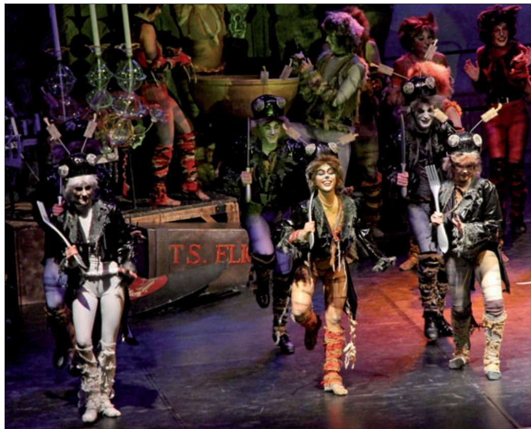
Az elmúlt 30 évben az előadást közel 1400-szor játszották

Fergeteges előadást hozott el a Madách Színház