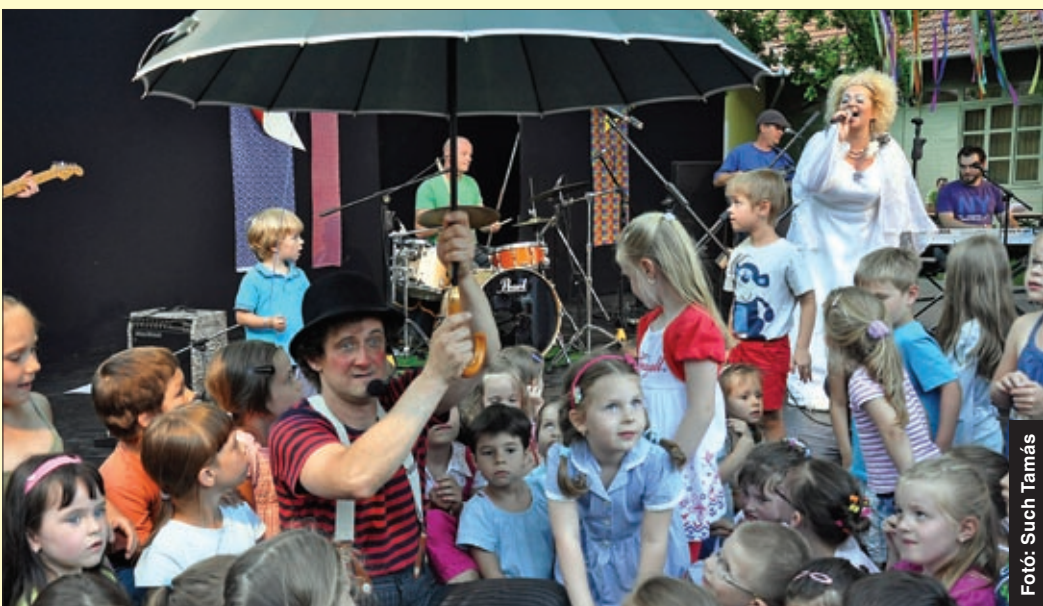
A nyár folyamán sok-sok családi és gyermekprogram is várja majd a kicsiket és nagyokat