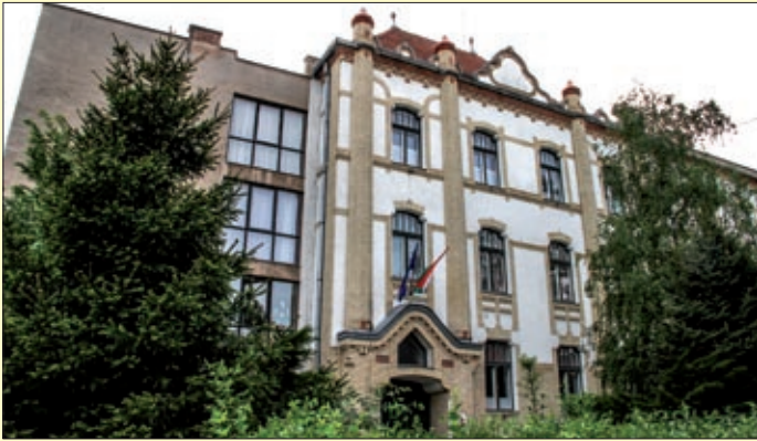
A Petőfi utcai iskolában három első osztály lesz