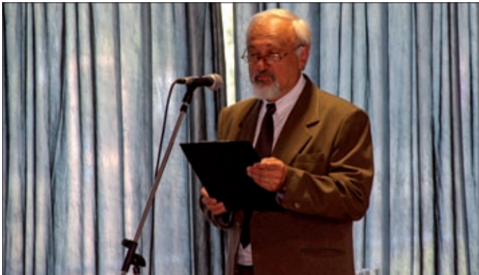
A könyvet dr. Ambrus Zoltán szerkesztette

Gazdák, iparosok, kereskedők a XX. századi Békéscsabán címmel jelent meg egy kötet a városvédő és városépítő egyesület kiadásában, dr. Ambrus Zoltán szerkesztésében. A könyvet pénteken, május 10-én, a Csabagyöngye Kulturális Központban mutatták be a közel kétszáz fős közönségnek.