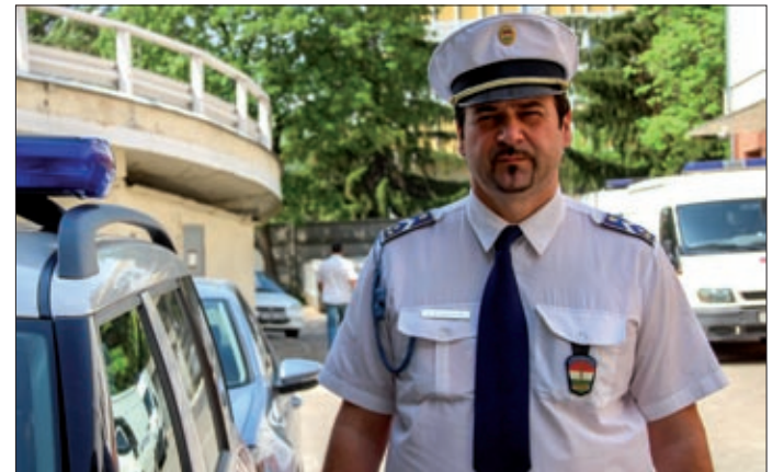
Ha újakezdené, megint rendőrnek jelentkezne

A fentieket sugározza magából a határozottan nyilatkozó, ám mosolygós egyenruhás is, aki családi indíttatásból lépett a pályára, hiszen bátyja is rendőr.