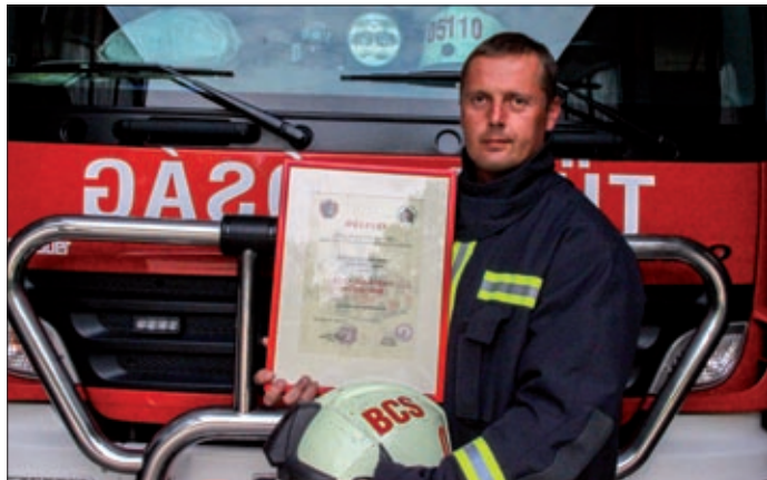
Az év tűzoltója mindig az adott feladatra koncentrált

Mint megtudtuk, a tűzoltó végzettség megszerzése után szerparancsnoki, valamint beosztott tűzoltói feladatokat lát el. Előjárói szerint elméleti és gyakorlati ismereteinek birtokában határozottan és szakszerűen végzi munkáját, nagy pontossággal dolgozik. Higgadt, nagyfokú önuralommal, fejlett érvelő és ítéletformáló képességgel rendelkezik, cselekedeteiben megfontolt. Kreatív gondolkodásával a tűz- és káreseteknél esetlegesen felmerülő problémák megoldását elősegíti. Szorgalma, igyekezete nemcsak a szakmai munkában, hanem a laktanyán belüli, egyéb feladatok végrehajtása során is