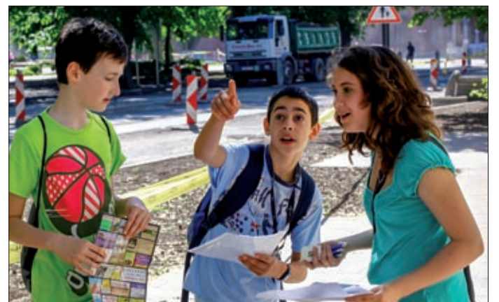
A csapatok öt helyszínt fedeztek fel a versenyen

A helyi történelemtanárok munkaközössége szervezte meg május 11-én a Tanösvény Békéscsaba belvárosában címet viselő városismereti vetélkedőt az önkormányzat, a Magyar Tartalékosok Szövetsége és a városvédő és városzépítő egyesület közreműködésével.