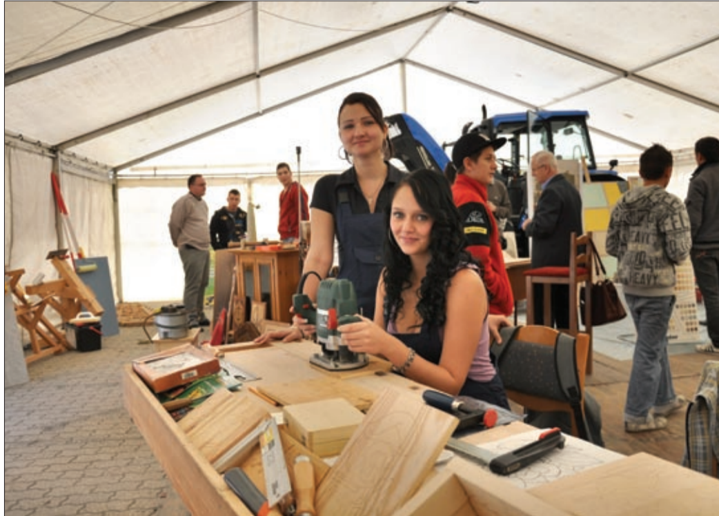
A lányok körében is egyre népszerűbbek az eredendően férfiasnak tartott szakmák

– Mindenképpen a rendezvény sikerét jellemzi, hogy az idei pályaválasztási vásáronkon több látogató és kiállító van, mint eddig bármikor. Több mint ötezer pályaválasztás előtt álló vagy pályakorrekcióra készülő fiatal vett részt a vásáron. A megye szinte minden szakképző vagy szakképzésben is érintett közép- és felsőfokú intézménye mellett a felnőttképzési szervezetek, a gyakorló intézmények és a nagyobb foglalkoztatók is képviseltetik magukat. Sajnos azt kell mondanom, hogy szép lassan kinőjük a sportcsarnokot, nem tudunk