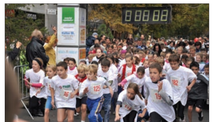
Kicsi a bors, de gyors

A szórakoztatás már délelőtt megkezdődött. A center előtt felállított színpad