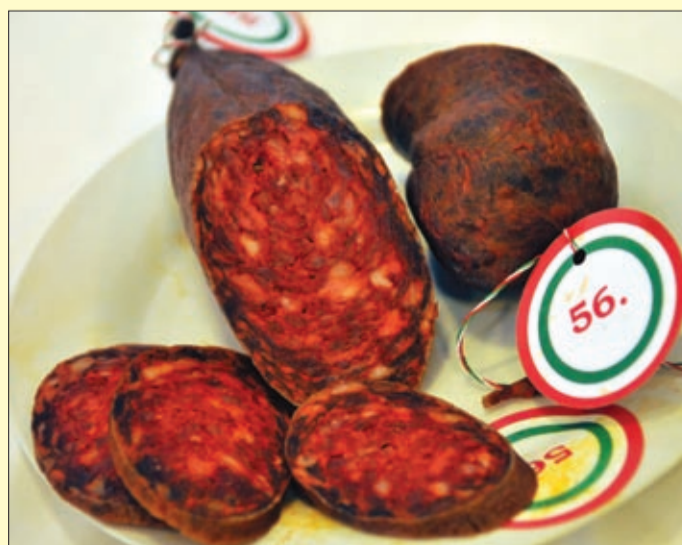
Igazi csabaikum az egyik legszebb versenymű

mindenféle kézműves terméket. Korábban a koncertek főként a sportcsarnokban voltak, most a legnagyobb programok kedvéért egy több mint négyezer négy-