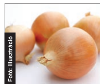
Hiába ízletesebb a magyar dughagyma, a hibrid olcsóbb