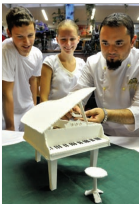
A hangok és az ízek összhangban

Az évfordulóra a cukrász-tanulók – tanáraik felügyelete mellett – készítettek el a díszortát, de emléksztalt is állítottak Liszt Ferenc emlékére. A tányérokat külön erre az alkalomra készítették Hollóházán. A dísz-tányérok szelén fekete-fehér zongorabilentyüket ábrázoló motívumok láthatók. A megterített asztal további dekorációja is a zene vilá-