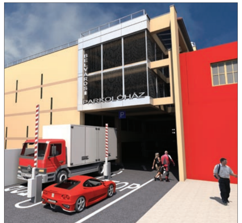
Az ötszintes épületben több mint kétszáz autó parkolhat