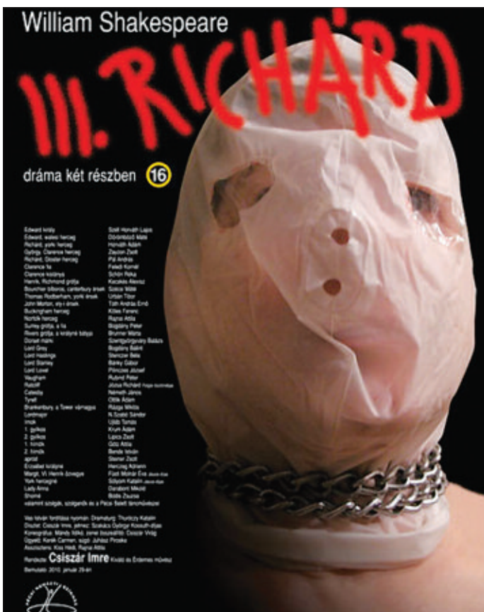
A Pécsi Nemzeti Színház a III. Richárdot idomította a mai korhoz

Színház körökben úgy tartják: Shakespeare darabjai korunk problémáinak bemutatására is alkalmasak. Csiszár Imre rendező a Pécsi Nemzeti Színházban a III. Richárdot idomította a mai korhoz.