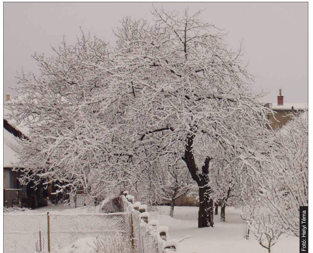
A gyümölcsfák mélynyugalmi állapotban vannak