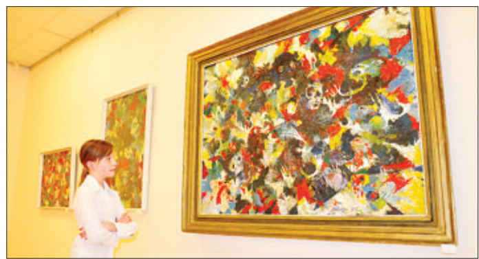
Bolmányi-kiállítás a Jankayban