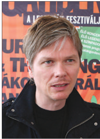
Gulli Briem ENSZ-nagykövetségként is segít

Összesen ötvenmillió forint jött össze az árvízkárosultak számára szervezett rendezvényen. A Helyi Téma, a Magyar Televízió és a StarGarden fesztivál közös szervezésben kezdeményezték gyűjtést a magyarországi árvízkárosultak javára. A monstre koncertsorozaton az érdeklődők számos külföldi és magyar sztár fellépését követhették figyelemmel, a belépőjegyek árának egy részét pedig az árvízkárosultak kapják.