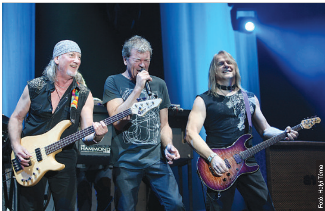
Millióért kelt el a legendás Deep Purple gitárja