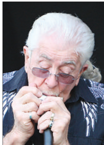
John Mayall örül, hogy ilyen nemes ügyet szolgálhat

diákokkal, pénzzel és kapcsolatokkal segítettük a zenei tanulmányaikat. Játsoztunk olyan emberek előtt is, akik maguk nem engedhették volna meg, hogy kifizessenek egy koncertbelépőt. A New Orleans-i árvíz idején egy iskolát támogattunk. Legutóbb pedig volt alkalmunk ellátogatni Haitire is, közvetlenül a földrengést követően. Ott örökbe fogadtunk egy várost, és láthattuk, hogy a természeti katasztrófák miként képesek derékba törni egy em-