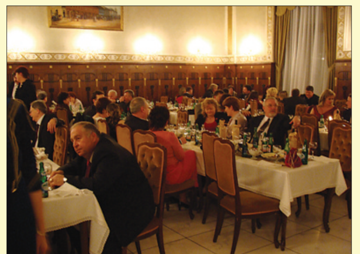
Sikeres volt a polgári bál a Fiumében