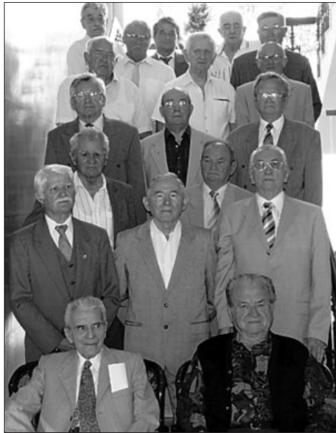
A mostani találkozáson felelevenítettük az 1949–1953-ig együtt töltött békéscsabai diákéveket, megemlékeztünk iskolánkról, volt tanárainkról.

Akad köztünk olimpiai bajnok labdarúgó, majd nemzetközileg elismert FIFA-bíró – Palotai Károly –, de van katonatiszt, rendőrtiszt, vezérigazgató, bankigazgató, iskolaigazgató, jogász, főkönyvelő, könyvvizsgáló, könyvtáros, kultúrház-igazgató, vasutas, vámos is. Vannak olyan osztálytársaink, akik egész életükben egy munkahelyen dolgoztak, és vannak, akiknek az '56-os események miatt külföldre kellett távozniuk. Igen jó képességű, összetartó közösség volt a mi osztályunk, s ez a szeretet nem múlt el.