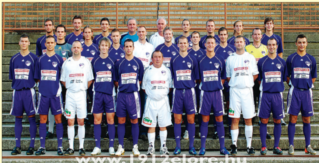
Az Előre focicsapata ősztől az NB II-ben szerepelhet. Gratulálunk!