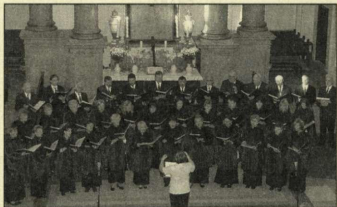
A 2005. június 11-i jubileumi hangverseny