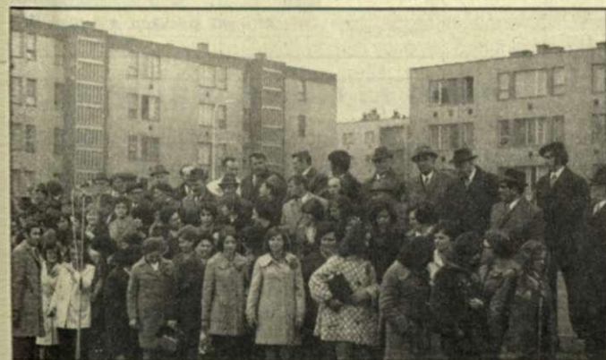
A kórus 1975-ben