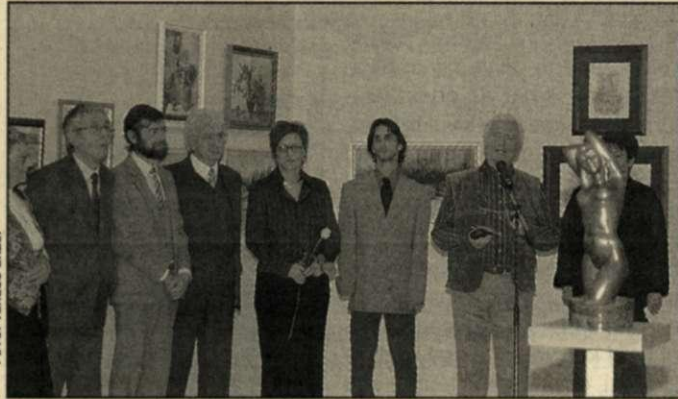
A megnyitó egy pillanata

Január 17-ig látható a Csaba Center Jankay-galériájának kortárs termében a FAMME, a Független Alkotók Művészeti és Művelődési Egyesületének 2004-es kiállítása. A 18 éve alakult egyesület tagjai leginkább művésztanárok, a társaságot egyben tartó kapcsolat lényege pedig a tehetségéből kiinduló ösztönzés arra, hogy gondolataikat, érzéseiket a képzőművészet különböző műfajaiban megfogalmazva közöljék az érdeklődőkkel, a művészetek barátaival.