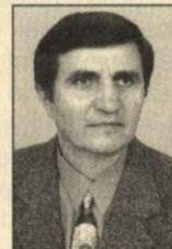
Timár Imre 15. vk.