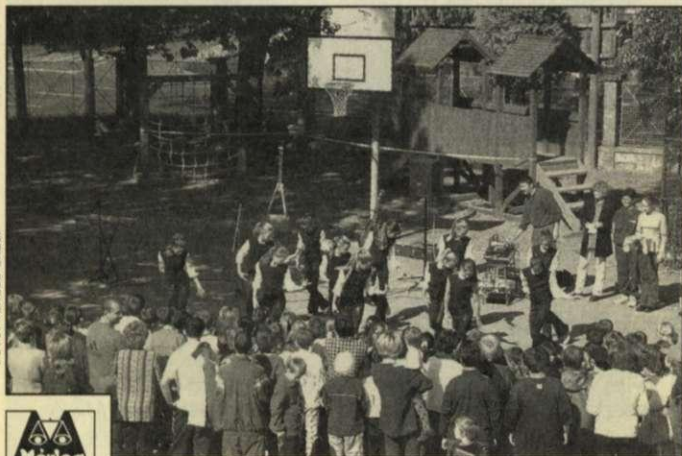
Gyermeknyüzgés az iskolaudvaron

■ TISZTELT OLVASÓINK! Lapunk következő száma az ünnep környékén megváltozott munkarend miatt október 27-én, pénteken jelenik meg.