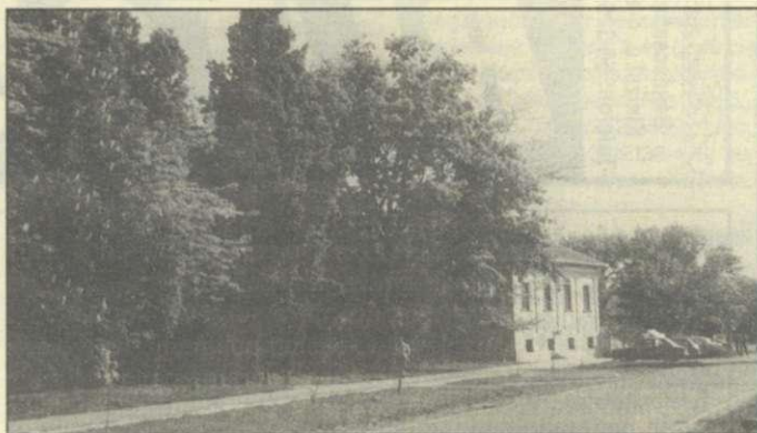
A hajdani első kád- és gőzfürdő épülete ma