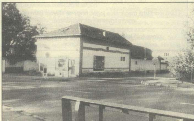
Az artézi gőz gyógyfürdő mai helyszíne