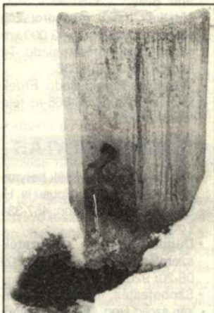
A nagytemplom mögötti artézi kút egyike a még vizet adó keveseknek

gén ismét nem adott vizet, már nem gondolták a tisztítására. Rövid ideig a medence földdel töltve virágoskertként díszelt a téren. Hamarosan lebontották, elhordták mívesen faragott kőlapjait. A halászlányszobor a strandra került, majd nyomtalanul eltűnt.