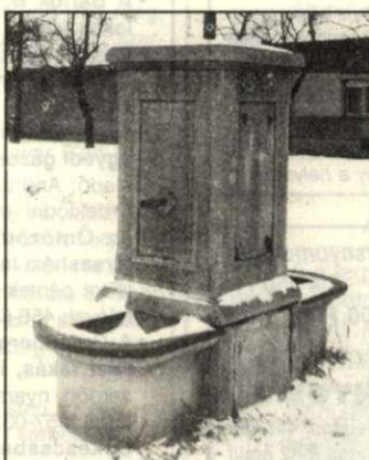
Ipari műemlék, az Oncsa-telepi artézi kút évtizedek óta nem ad vizet

Több mint egy évtizedig rendszeren működött, aztán fokozatosan csökkent, majd 1909-ben már felére apadt a vízhozama. Többször szorult kompresszoros tisztításra. Amikor az 1940-es évek vé-