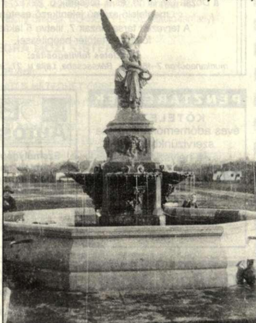
1892. Angyalos vagy Viktória artézi kút (Andrássy út, a laktanya mellett)